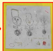
残りの三面、絵 を描いて削る