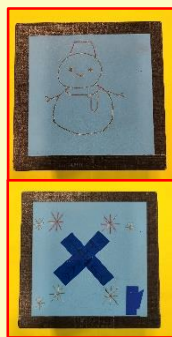
さらに色を塗ったり テープを張ったり