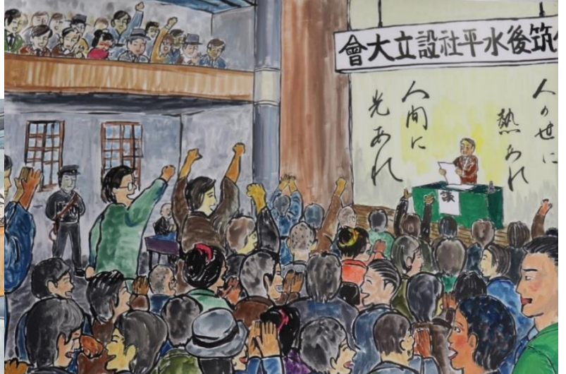
とくべつてん もあ ほのお 【特別展パネル「燃え上がる炎」より】

かいさい きかん がつ にち にち がつ にち か 開催期間 12月3日(日)から1月30日(火)まで