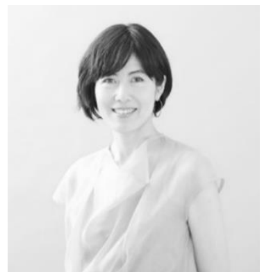
講師 小島 慶子さん エッセイスト・タレント 東京大学大学院情報学環客員研究員