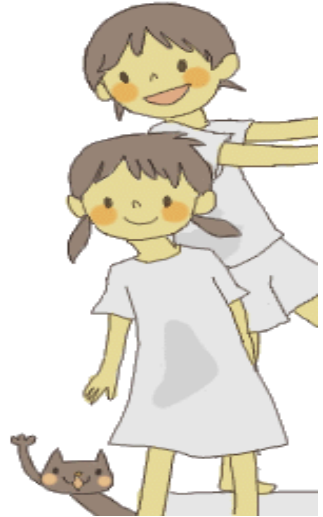
イラスト提供: かわらわ。り