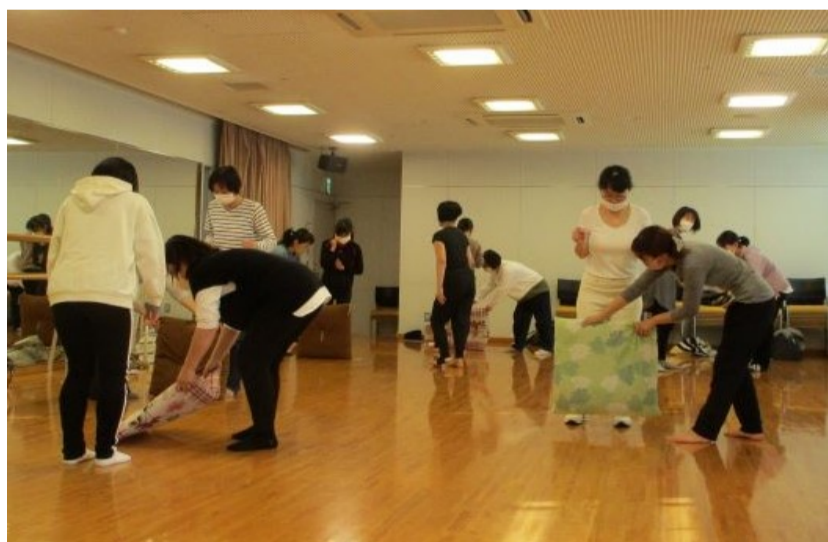
実践的な啓発講座「女性のための護身術」