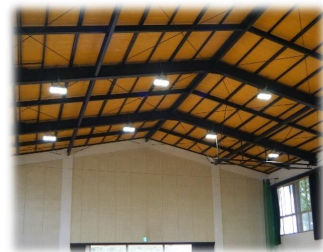
LED照明に改修した体育館