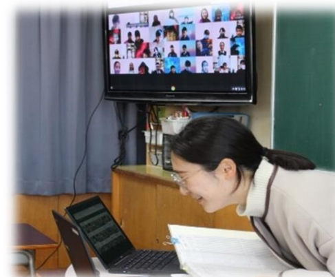
オンライン朝の会の様子