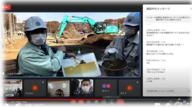
浸水対策と算数のハイブリット授業