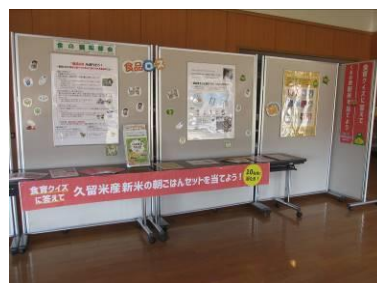
(田主丸複合文化施設)