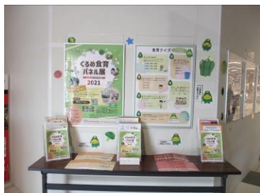
(ゆめタウン久留米店)

内容：食育推進プランや、食育都市宣言、4つの基本施策に関するパネル展示、食に関するクイズやパンフレットの設置 など