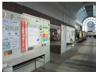
(JR久留米駅東西自由通路)