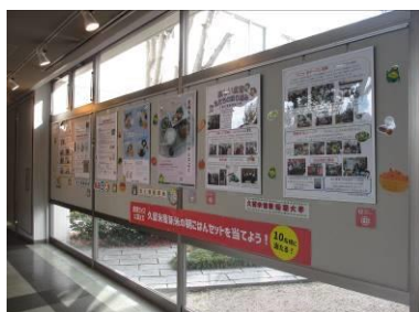
(三潯生涯学習センター)