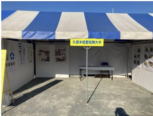
(久留米信愛短期大学)