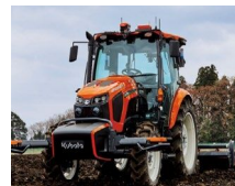
ロボットトラクタ