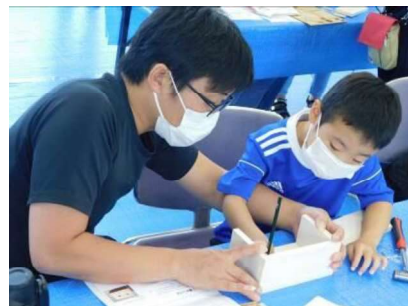
○講師：グッデイファブ久留米スタッフ様 (1/21の講師はセンター職員による)