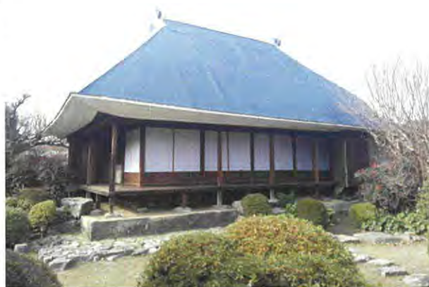
上野家住宅御成間事業完了後（南東から）

平成 28 年 4 月の熊本地震により、建物全体に歪みが生じ、建物内外面の土壁各所にクラックや、壁土の浮きなどが生じた。平成 29 年度に実施した災害復旧事業では不陸修正を行い、雲筋交いによる屋根裏の構造補強や礎石周りの補強、また、左官工事や木工事等を実施した。本事業期間は平成 29 年 4 月 26 から平成 29 年 12 月 30 日までである。