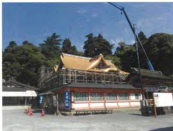
高良大社屋根葺き替え状況（北西から）

本殿の檜皮葺き屋根の一部が破損し、雨漏りが発生した。これを補修するため、棟周辺の檜皮差し替えを行った。事業期間は平成 30 年 3 月 26 日から平成 30 年 3 月 30 日までである。