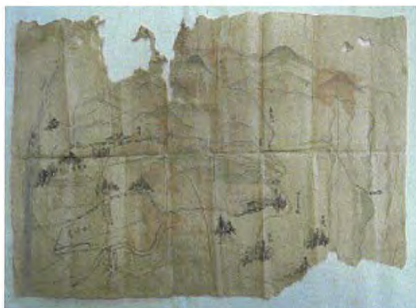
船曳大滋「国府ノ図」修復前

船曳大滋「国府ノ図」は、江戸後期の久留米の歌人で、書画をよくした船曳大滋（ふなびきたいじ）が筑後国府を描いたもの。紙本淡彩。裏打ちされておらず、シミ、折れ、破れが多く見られるため、本紙の欠失箇所を補修紙で繕い、周りに和紙で保護紙を付ける。付属の封筒は同じ台紙（マット）に窓を開け並べて保存を行った。表装については、中性紙の台紙、マット、表紙（和紙）を作