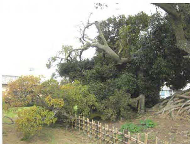
エノキ折損状況②（南西から）