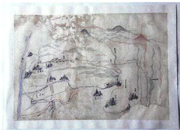
船曳大滋「国府ノ図」修復後