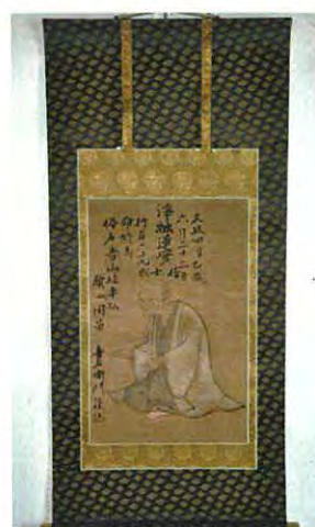
「吉山喜右衛門像」左：修復前 右修復後