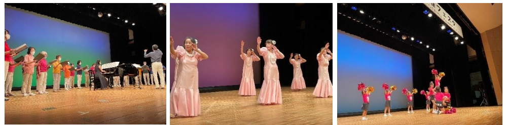
※演目 コーラス、フラダンス、チアリーディング、楽器演奏など