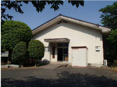
荒木老人いこいの家