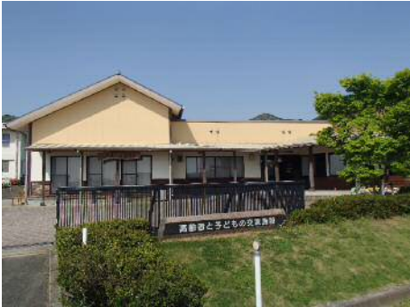
高齢者と子どもの交流施設