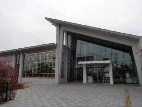
北野保健センター（コスモすまいる北野）