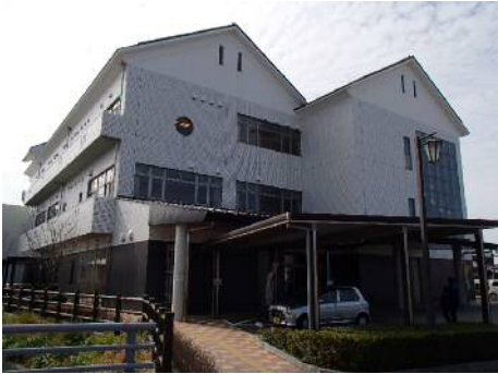
城島保健福祉センター（城島げんきかん）