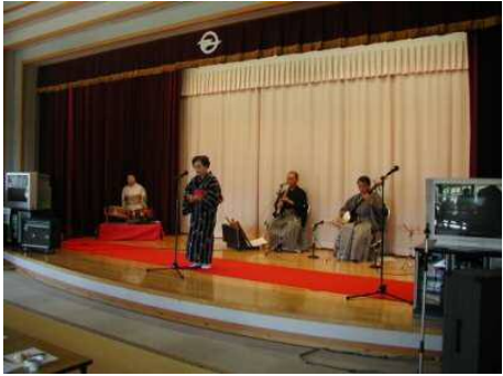
三潞総合福祉センター（ゆうゆう） 【集会室】