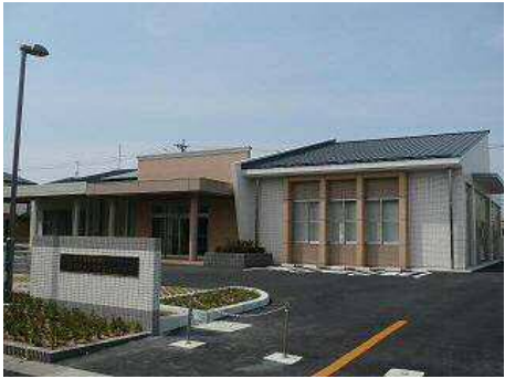
南部保健センター