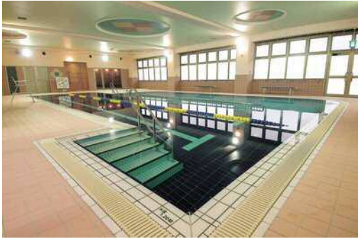
城島保健福祉センター（城島げんきかん） 【歩行プール】