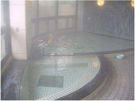
三潞総合福祉センター（ゆうゆう） 【浴場】