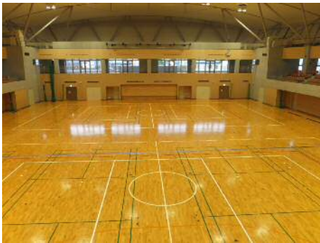
みづま総合体育館 【メインアリーナ】