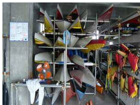
筑後川漕艇場 【艇庫】