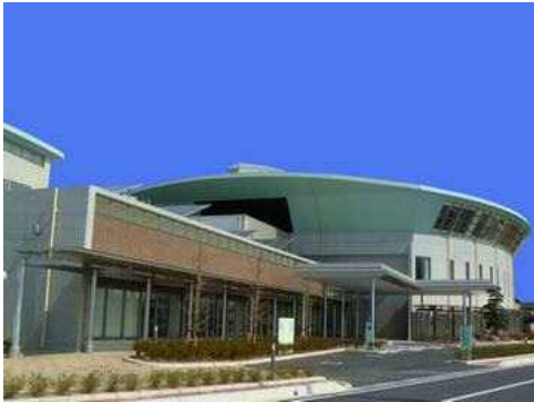
みづま総合体育館