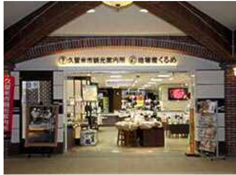
J R久留米駅内観光案内所