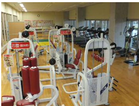
みづま総合体育館 【トレーニングルーム】