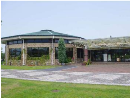
ふれあい農業公園