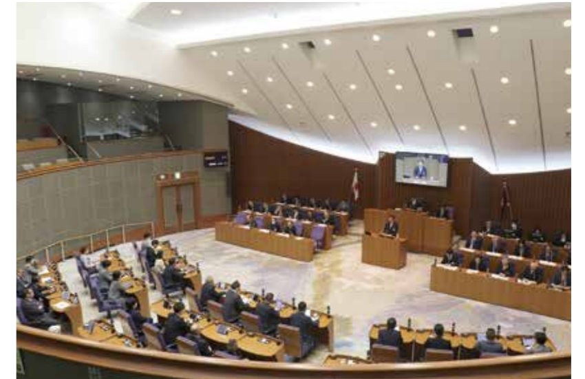
議案の議決結果と賛否の状況はP7へ ➡