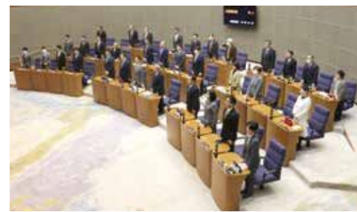
12月定例会での採決