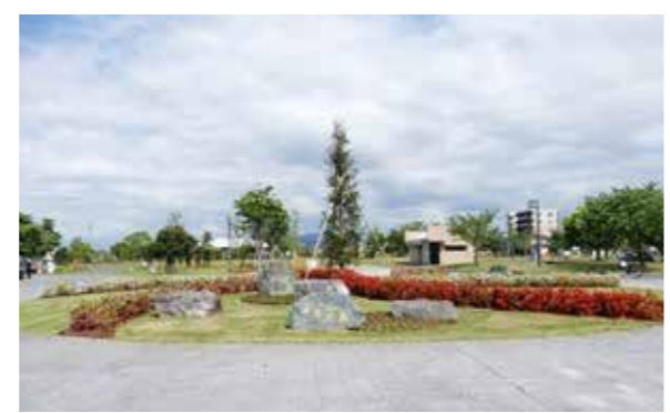
指定管理者により管理運営する公園の一つ:津福公園