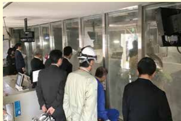
ごみクレーン操作室