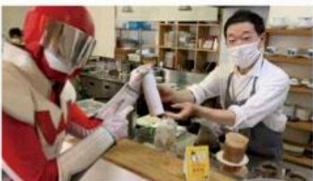
持参したマイボトルで飲み物が買える「マイボトル推奨店」