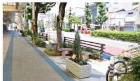
明治通りでは保水性の高い基盤材を活用した緑化スポットを整備