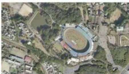
競輪場や円形野外講堂などがある正源氏公園計画地