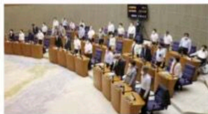
6月定例会での採決