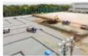
本誌に掲載している写真は、撮影時のみマスクを外しています

下弓削川・江川の内水対策として、久留米市と久留米大学が協力し、御井キャンパスのグラウンドに雨水を貯める施設をつくっています。令和5年度の完成を目指して工事が進んでいます。