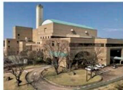
建て替えが予定されている上津クリーンセンター

上津クリーンセンターを建て替えるに当たり、委員会を市の附属機関 ※1 に加えるために、条例の一部改正を行うものです。