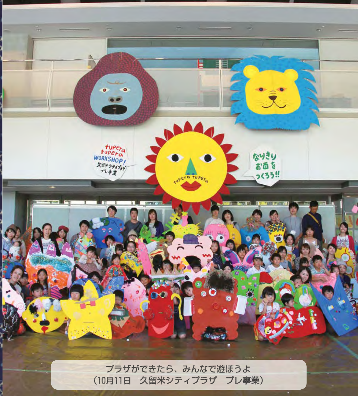
プラザができたなら、みんなで遊ぼうよ (10月11日 久留米シティプラザ プレ事業)