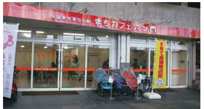
平成27年12月に廃止される「まちの駅」

委員から「現在のまちの駅は、町なかを歩いている人が気軽に立ち寄ることができないように感じた。今後事業を引き継ぐ予定のハイマート久留米に対して、利用しやすい施設となるよう今までの経験を伝えた上で、本市のPRにも取り組んでいただきたい」との意見が出されました。