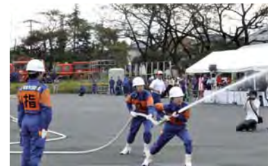
県の女性消防操法大会の様子

A 現在の本市の状況は、定数1,587人のうち実員1,515人で、充足率は95.5%である。消防団員の確保のため、今年度は消防団員の定年の引き上げに取り組んでいる。また、退職した消防団員などで組織する ※ 機能別団員の確保に向けた取り組みについても協議を進めることとしている。