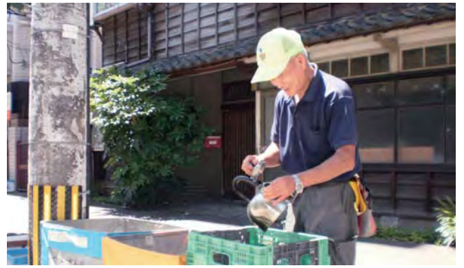
地域の集積場で活動される分別推進員さん

* 専決処分…議会が議決すべき事柄について、緊急を要するため議会を招集する時間的余裕がないなどの場合に、市長が議会に代わって決定すること。専決処分した事柄は、次の議会でも報告し、承認を求めることになっている。