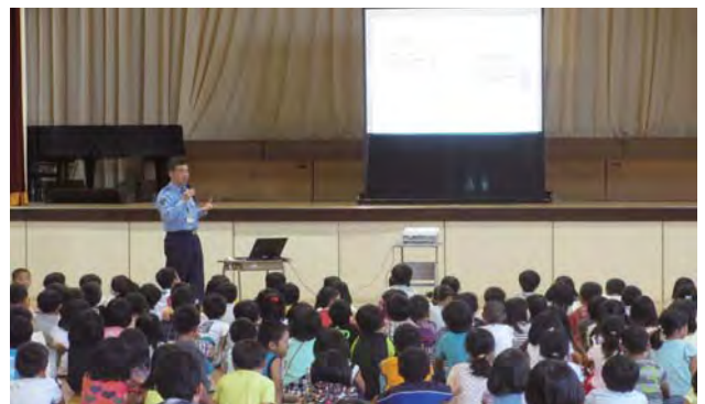
小学生向けの「非行防止教室」の様子

A 年齢別では、15歳が最も多く、14歳、16歳の順に多くなっている。検挙補導人員全体の7割を中学生と高校生が占めており、13歳から急増している状況である。