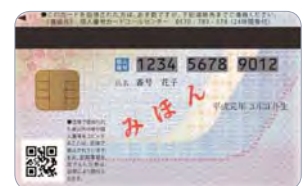
申請者に交付される「個人番号カード」