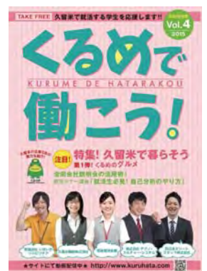
地場企業の魅力を伝える情報誌 (市労政課発行)

A 地場企業の魅力について掘り起こしを行い、販路拡大などの支援をするとともに、学生の地元就職を推進する産学官の仕組みが必要と考えている。今後は、こうした仕組みを通して、本市の魅力を広く発信していきたい。