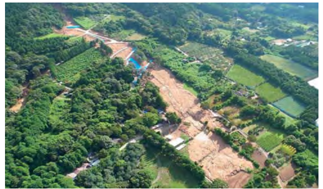
九州北部豪雨で被害を受けた農地

A 平成24年の九州北部豪雨災害では、市内の多くの農地が被害を受けたが、市では国や県の補助事業も活用しながら、農地の復旧支援に取り組んだ。