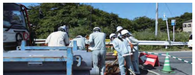
下水道の工事現場で研修を受ける職員

A 現状では、現場での対応力も含め、技術力の継承に課題があると認識しており、今後も外部研修などを活用し、技術力の向上に努めたい。災害時の下水道管の破損などについては、土木協同組合や維持管理協同組合などと連携して取り組むことができるような災害協定を締結している。