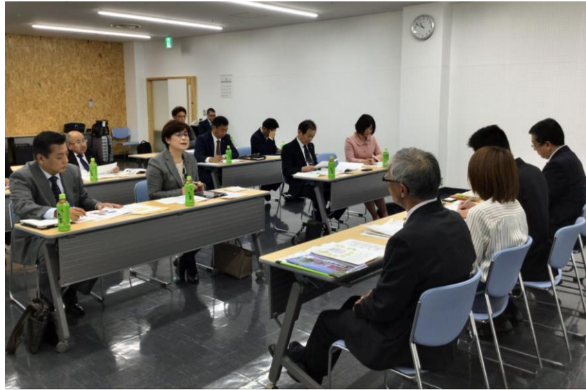
<視察の様子：岩見沢市>

放課後は1時間程度で毎週1～2回実施している学校もあれば、月に1～2回の学校もあり、小学校にはその学校を卒業した中学生が、中学校にはその学校を卒業した高校生なども指導に来ており、地域のボランティアと連携して、在校生への支援にあたっている。