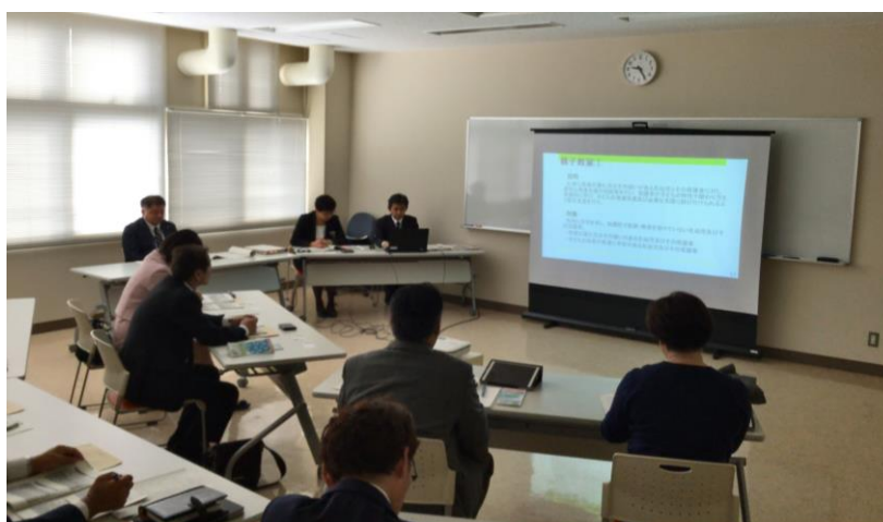
<視察の様子：旭川市>

(2)児童家庭相談事業では、保護者からの子育てに関する相談だけでなく、子供たちからの不登校やいじめ、児童虐待などの相談にも応じており、児童相談所と同じく児童虐待の通告先となっている。寄せられる相談の約2割が虐待に関するものであり、そのうち約6割は心理的虐待が占めているとのことであった。