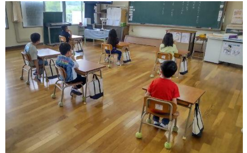
青峰小学校の1年生