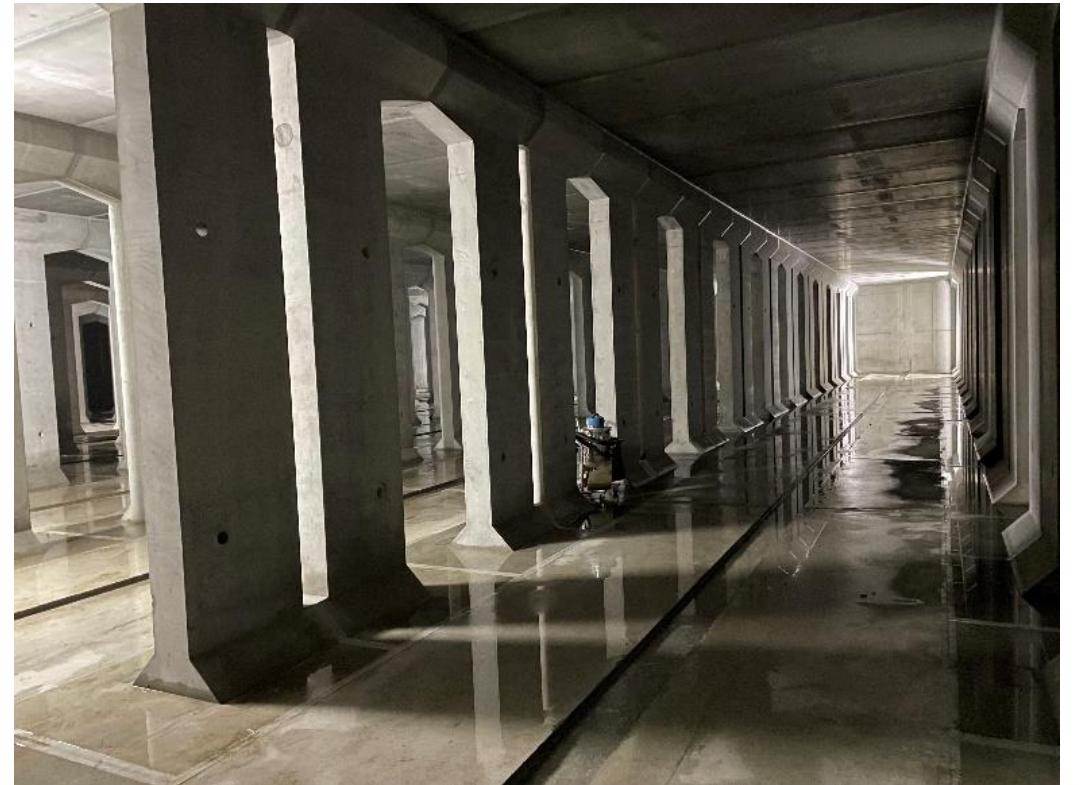
貯留槽内部(地下)の様子