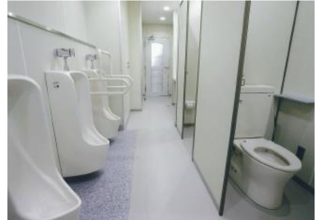
衛生的で利用しやすいトイレへ改修