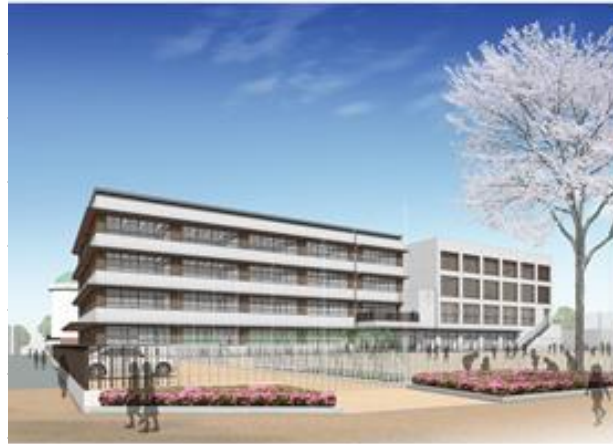
京町小学校外観イメージパース