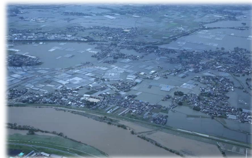
大刀洗川・陣屋川流域 (R2. 7豪雨)