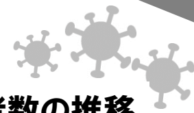
5月の新型コロナ陽性者数の推移