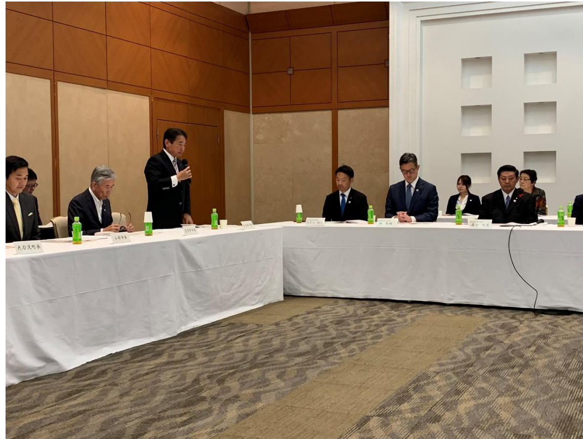
(写真 要望活動の様子 )

主要地方道 久留米筑紫野線、久留米立花線、藤山国分一丁田線、久留米柳川線に係る各道路整備促進期成会において、整備事業促進のため福岡県への要望を行いました。引き続き、福岡県におかれましては、地域の声を道路施策に反映していただき、早期整備が図られますよう、ご支援、ご協力をお願いします。