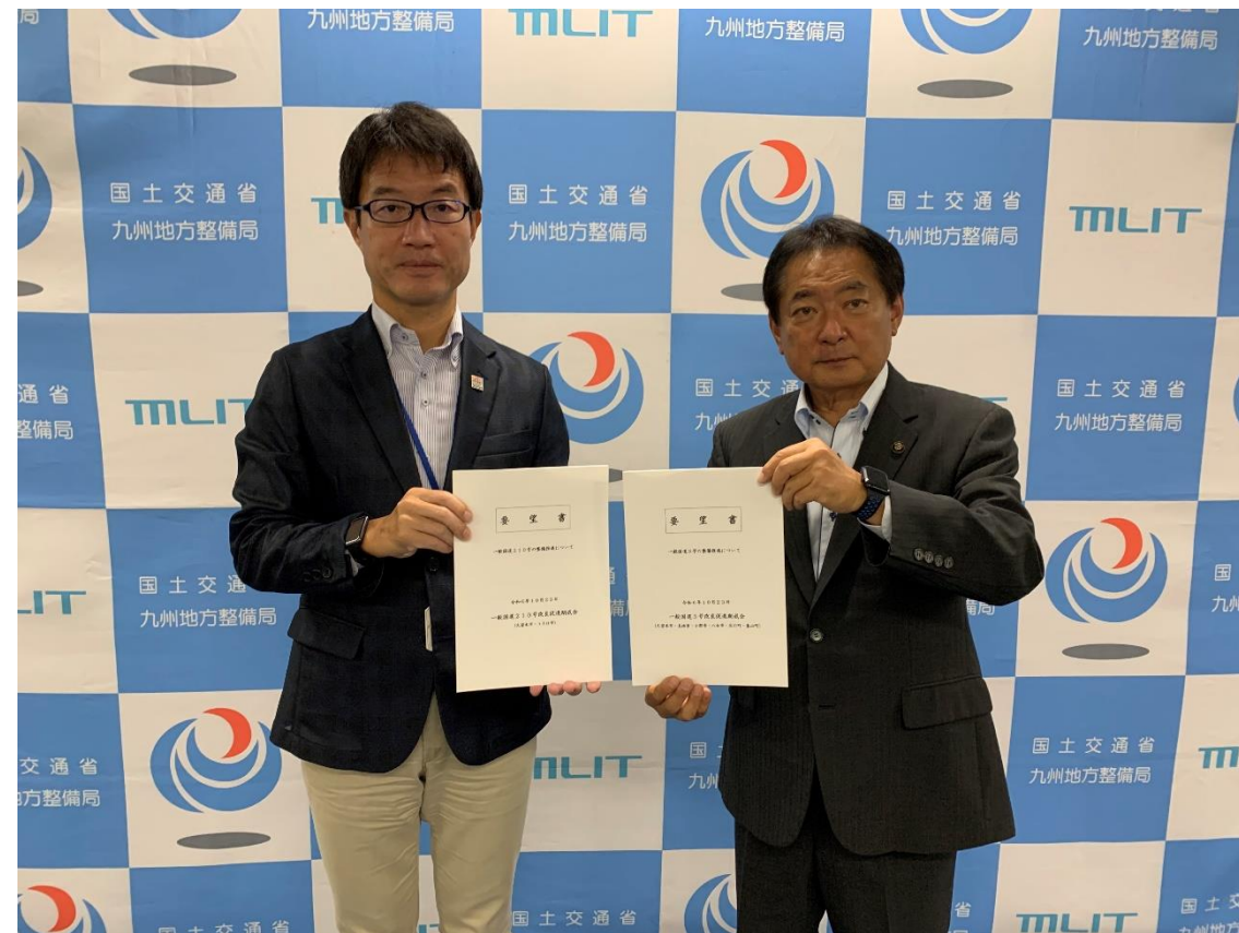
(写真 一般国道3号・210号改良促進期成会の要望書を渡す様子)

久留米市、鳥栖市、小郡市、基山町、八女市、広川町及びうきは市で構成する、「一般国道3号・210号改良促進期成会」から、国土交通省九州地方整備局に対して要望活動を行いました。