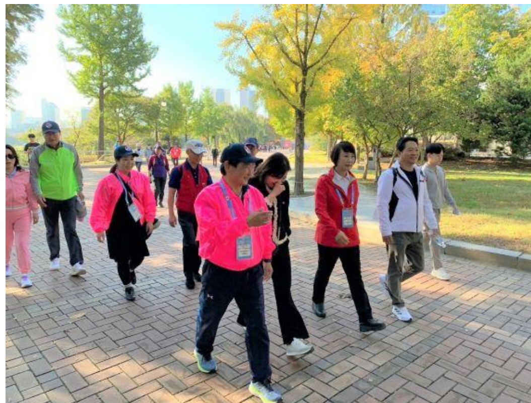
(写真 ウェルカムパーティとウォーキング大会の様子)