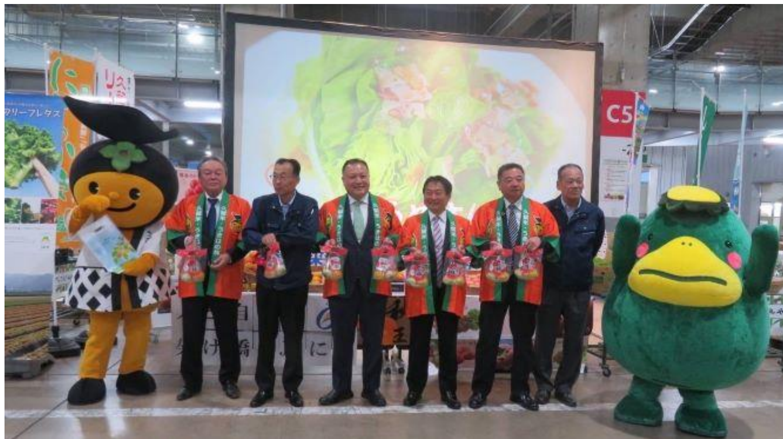
(写真 福岡市中央卸売市場青果市場でトップセールスを行う様子)

久留米市、うきは市、にじ農業協同組合が合同で、特産の柿やトマトをはじめとした農作物を福岡市中央卸売市場青果市場でPRしました。絶品の久留米産フルーツや野菜を、多くの方に楽しんでいただきたいと思います。