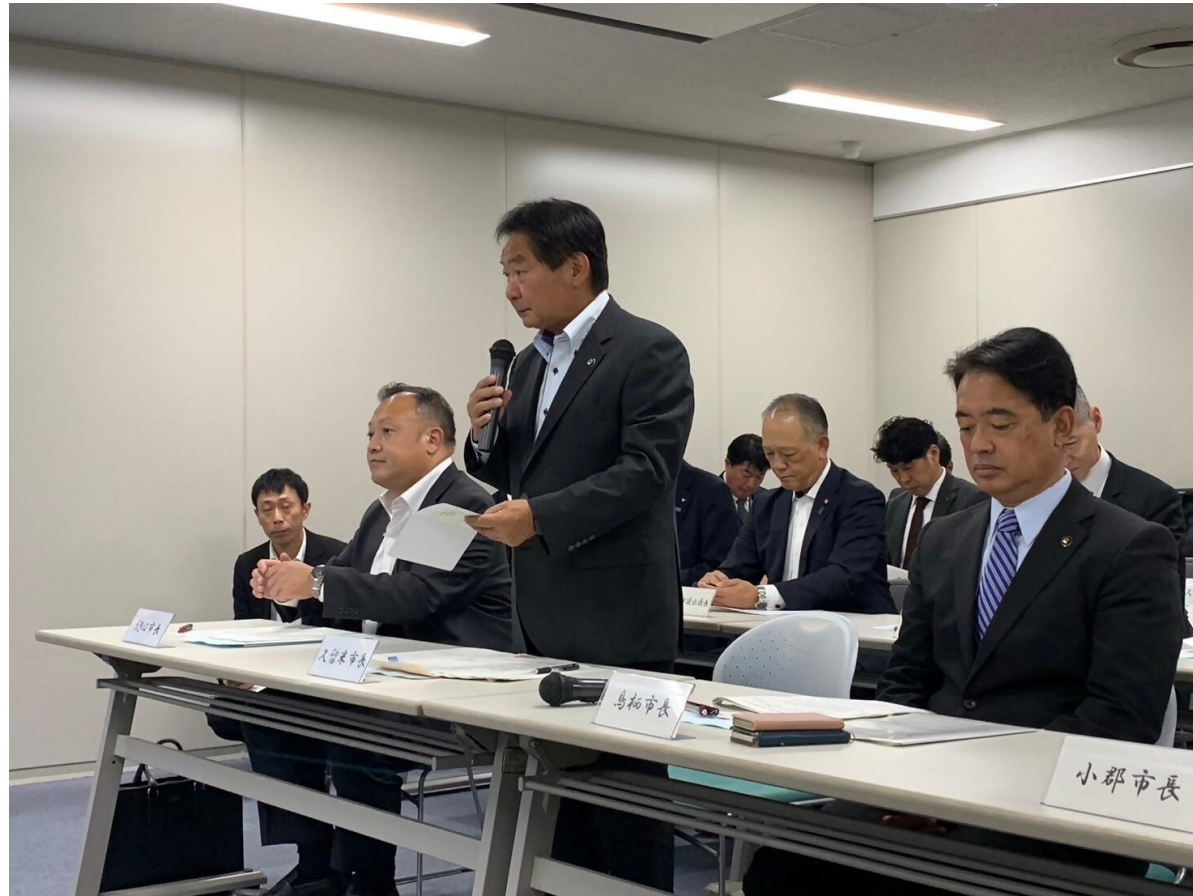
(写真 意見交換会で久留米市の状況を説明する様子)

水管理・国土保全局との九州治水期成同盟連合会意見交換会に、筑後川改修期成同盟会の会長として出席しました。意見交換会では「各自治体の流域治水の取り組み及び課題」について率直に意見を交わしました。