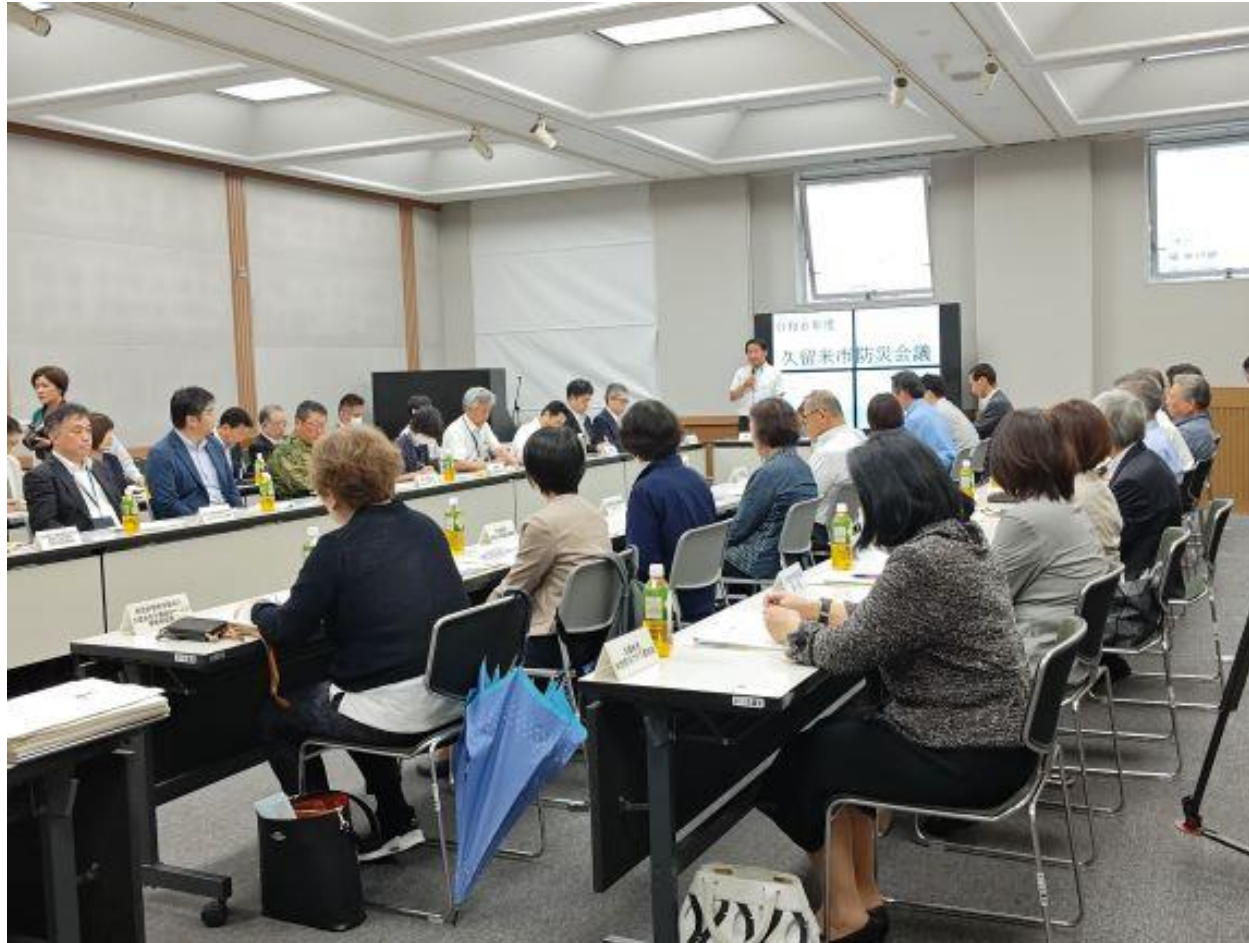
(写真 久留米市防災会議の様子)

出水期を前に、久留米市防災会議を開催しました。会議は国や県、警察、消防、市民団体など約40名で構成され、地域防災計画の見直し案は原案通り承認されました。