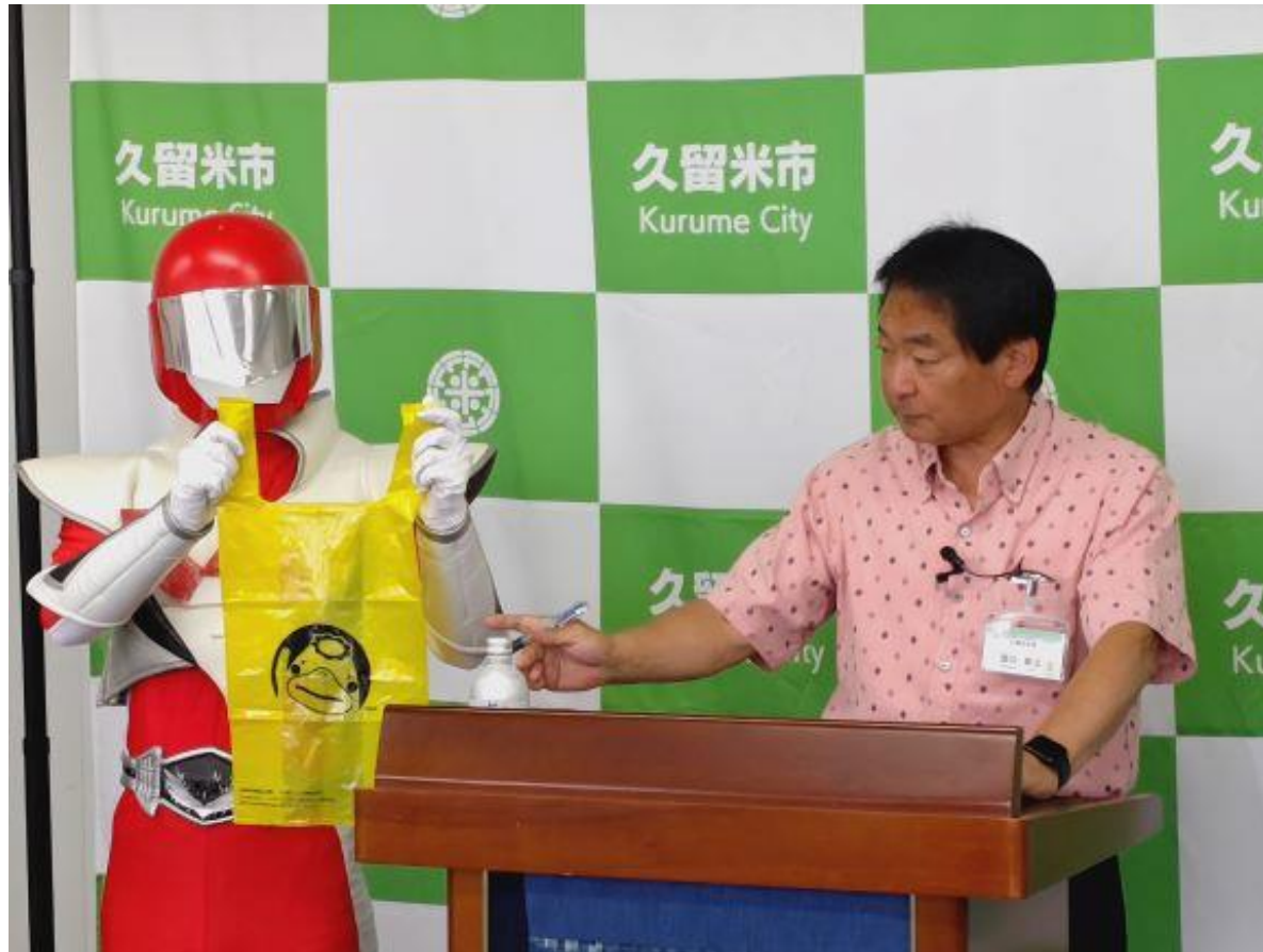
(写真 市長定例記者会見の様子)

記者会見を開催し、6月市議会(定例会)の議案や、大雨への備え、次期総合計画の策定等について説明しました。また、新たに小サイズを設定した指定ごみ袋については、ワケルンジャーとともにPRいたしました。