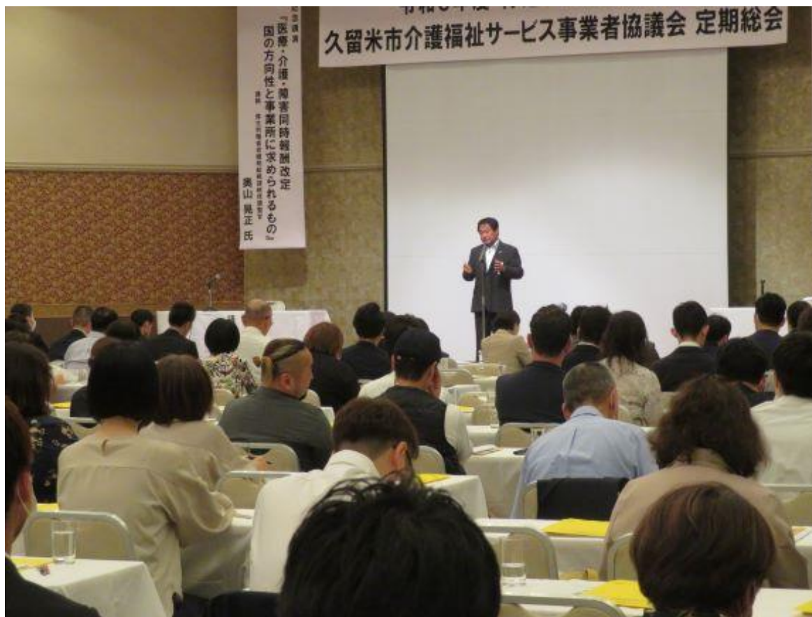
(写真 定期総会の様子)

特定非営利活動法人久留米市介護福祉サービス事業者協議会定期総会に出席しました。同協議会は平成12年12月の設立以来、介護保険制度の歩みとともに着実に発展を遂げられ、久留米市の福祉行政の運営に多大なるご協力をいただいています。理事長はじめ会員の皆様に深く敬意を表します。