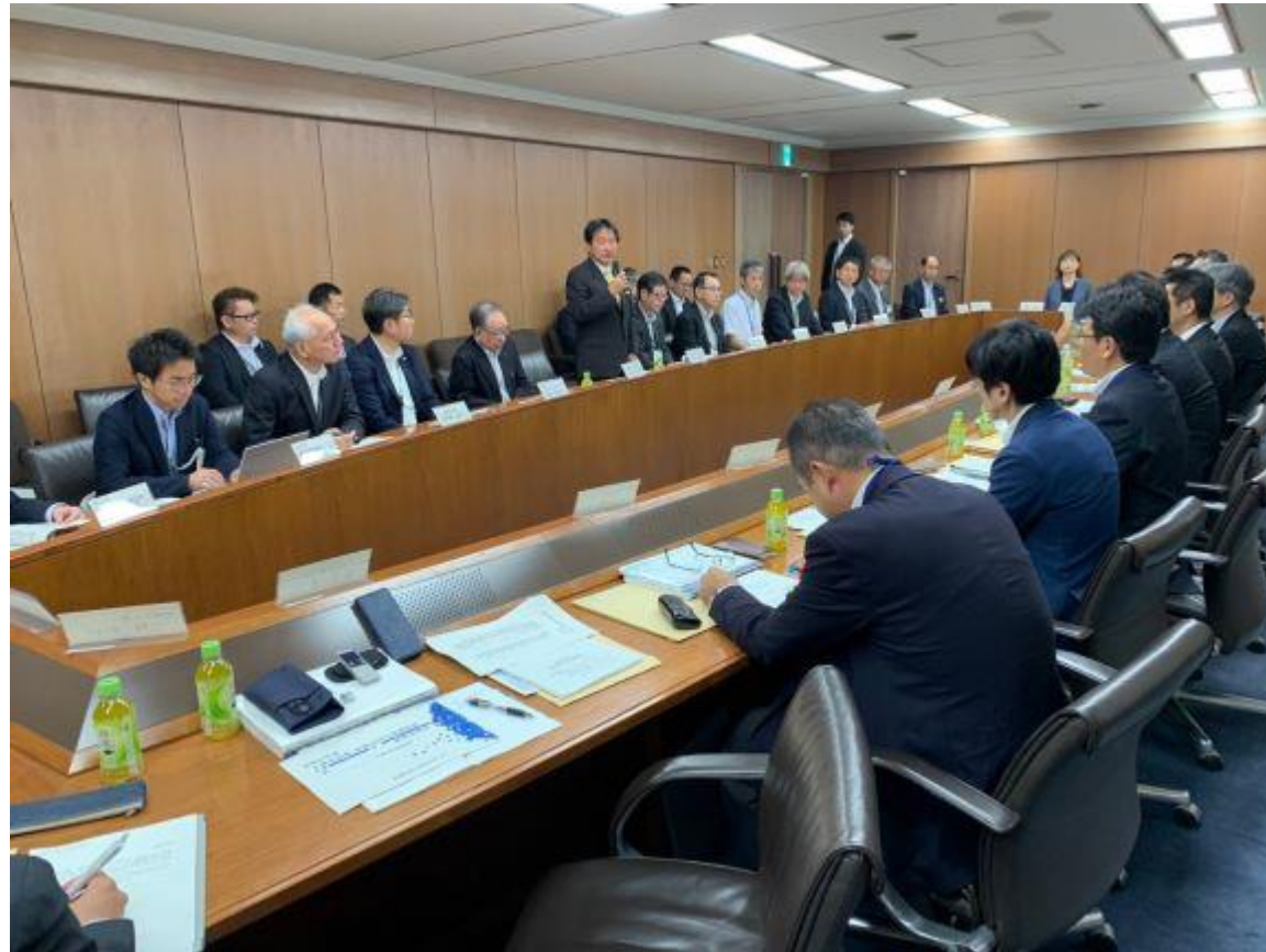
(写真 筑後川河川事務所長との意見交換会の様子)

国土交通省筑後川河川事務所長と筑後川・矢部川水系河川整備に関する意見交換会を行いました。筑後川河川事務所の皆様には筑後川の整備や巨瀬川流域緊急治水対策プロジェクトなど、多くの治水事業にご尽力いただき心より御礼申し上げます。