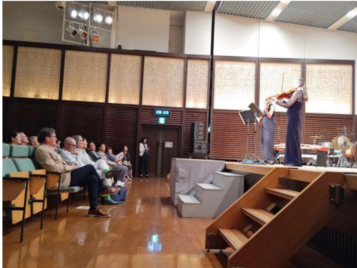
(写真 記念合同音楽会の様子)

久留米市とアメリカ合衆国モデスト市との姉妹都市締結30周年を記念し「合同音楽会」を開催しました。モデスト市からは、指揮者でビオラ奏者のアン・マーティン様、バイオリン奏者のアリソン・ペルティエ様の2人の音楽家をお招きし、ご来場の皆様は楽しんでおられました。