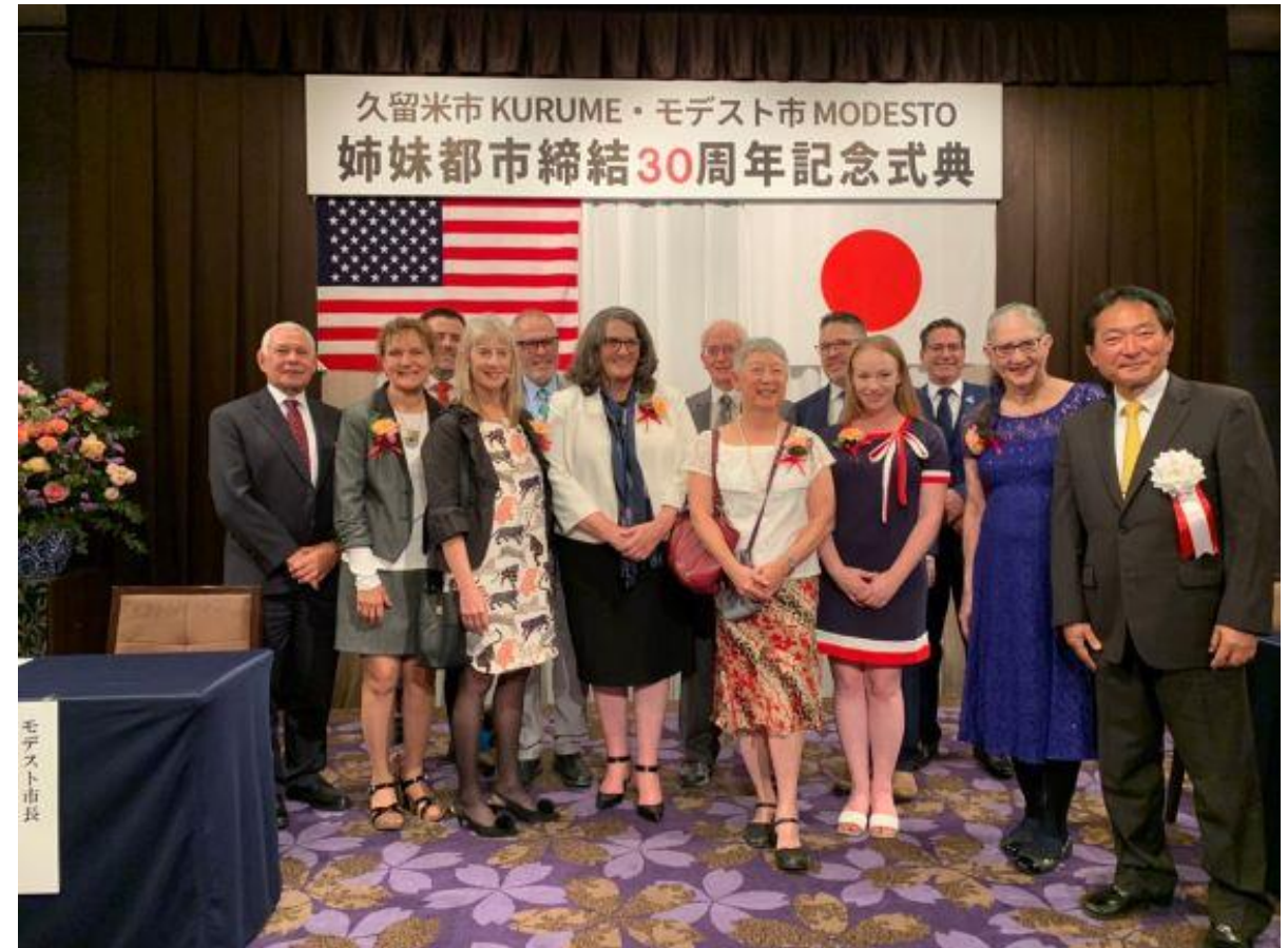
(写真 モデスト姉妹都市締結30周年記念事業・レセプションの様子)