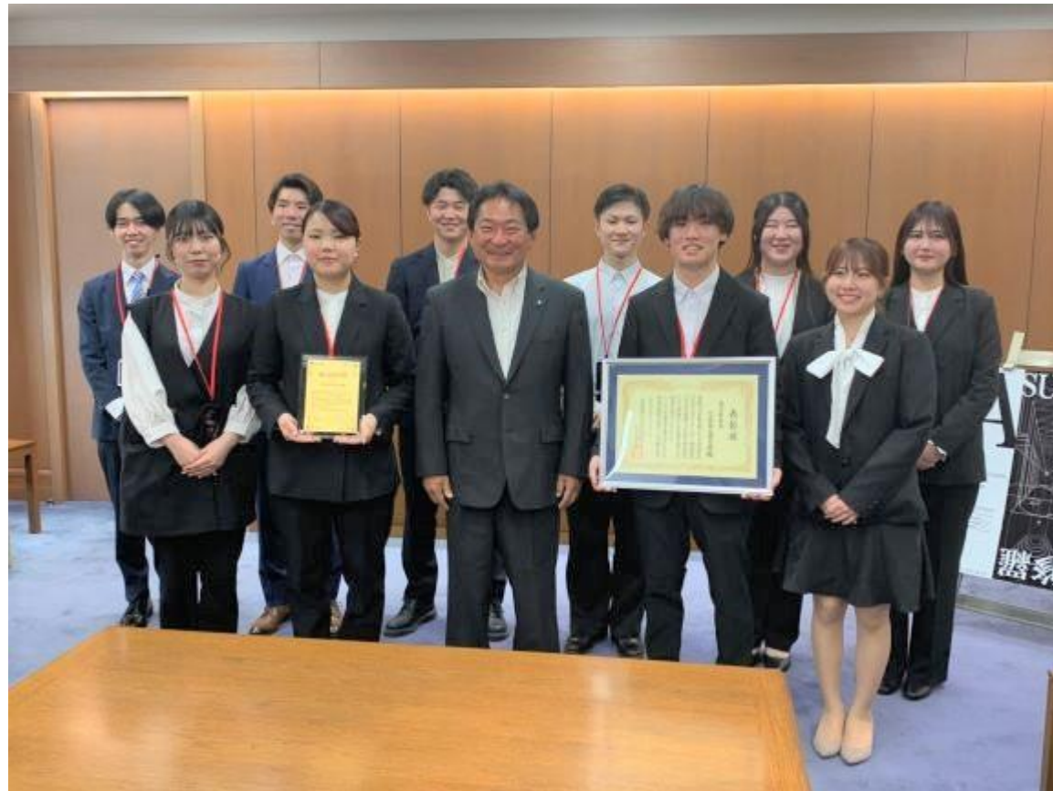
(写真 久留米工業大学様の皆様との記念撮影)

久留米工業大学 建築・設備工学科の学生を主体とするプロジェクト「ASURA(アシュラ)」の皆様がお越しになりました。学生のキャリア形成支援に係る取組などを表彰する「学生が選ぶキャリアデザインプログラムアワード」で地方創生賞を受賞されたことを報告いただきました。