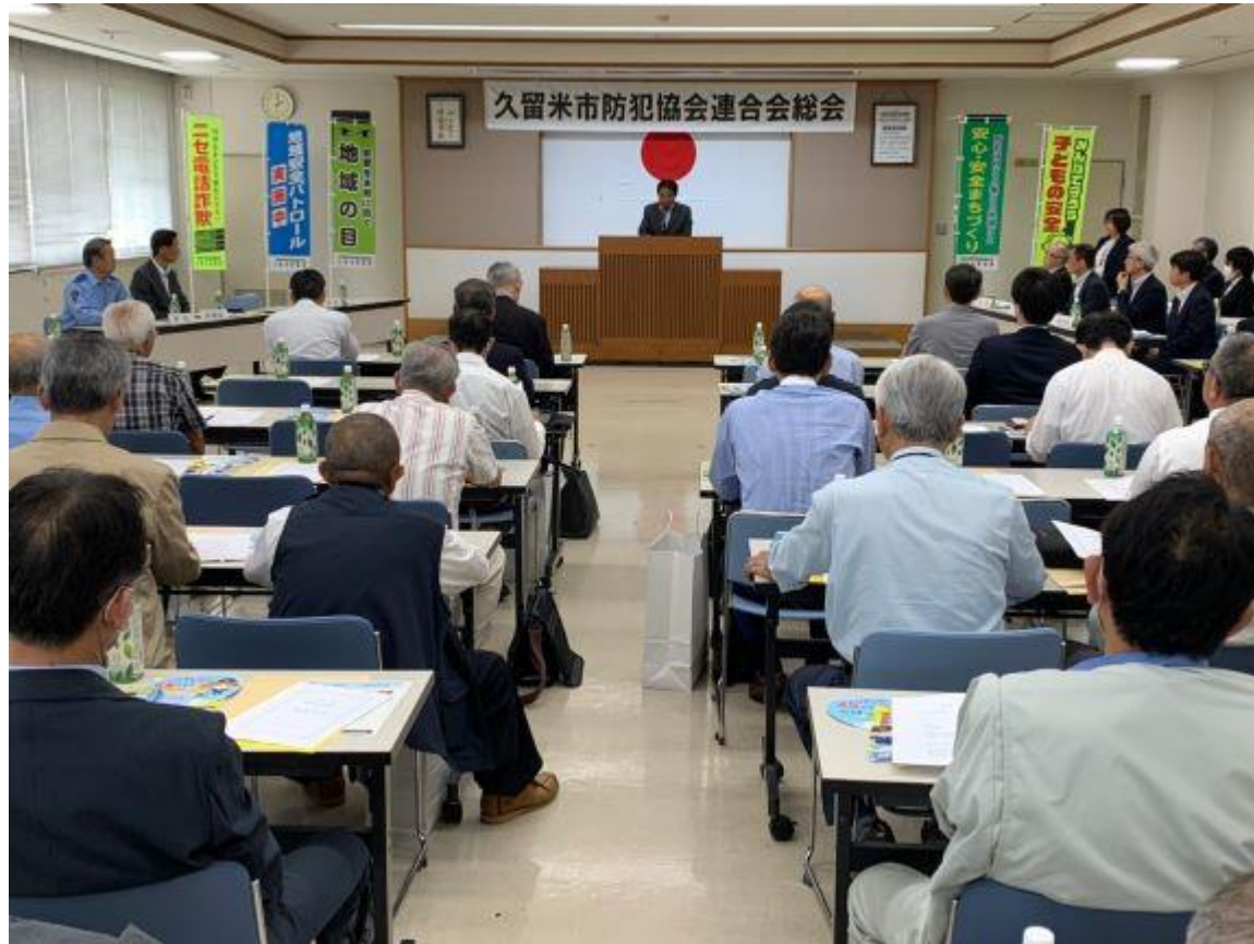
(写真 久留米市防犯協会連合会総会の様子)

久留米市防犯協会連合会総会に出席しました。日頃から青パト車による校区防犯パトロールへなど、市民が「安心して安全に暮らせる久留米」の取組を進めていただいています。久留米市も引き続き、セーフコミュニティの「みんなで取り組む安全安心のまちづくり」を推進していきます。