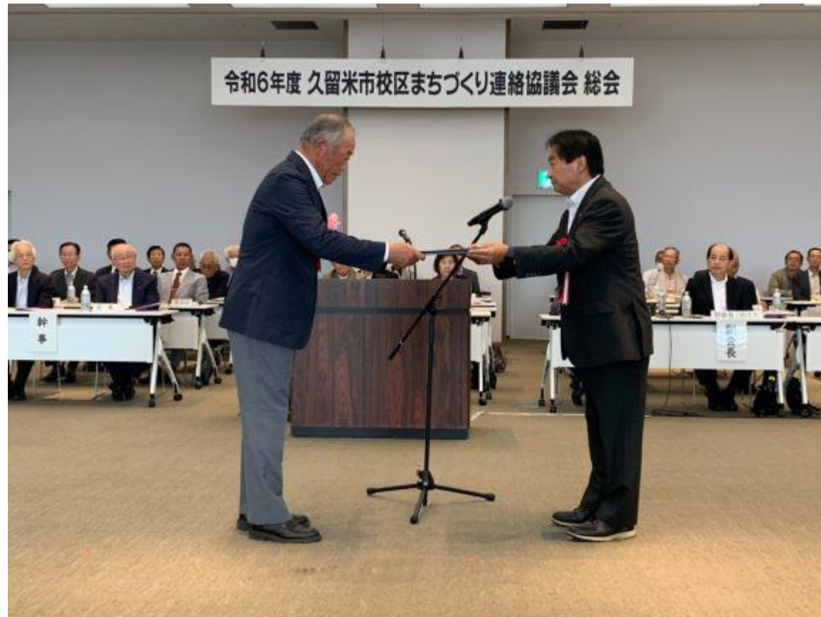
(写真 地域コミュニティ組織会長感謝状贈呈式の様子)

令和6年度久留米市校区まちづくり連絡協議会総会に出席するとともに、総会の場をお借りして校区や自治会の会長職を務められた地域コミュニティ組織会長に感謝状を贈呈しました。地域のまちづくり活動への長きにわたるご尽力とご苦勞に、感謝申し上げます。