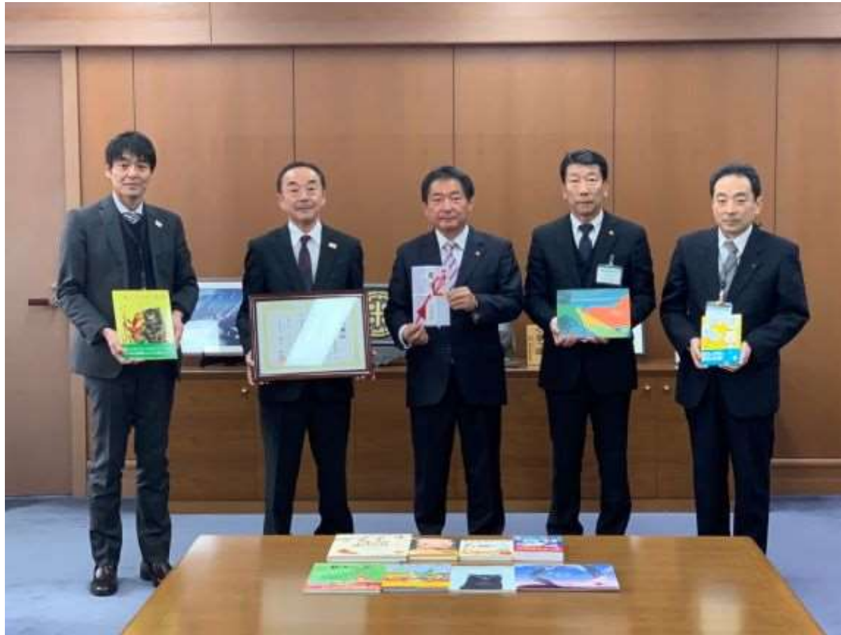
(写真 筑後信用金庫様から本を頂く様子)

筑後信用金庫様から、道徳に関連する図書を492冊寄附していただきました。頂いた本は、市立小学校と特別支援学校の計45校に配布し、久留米の未来を担う子どもたちのために活用させていただきます。