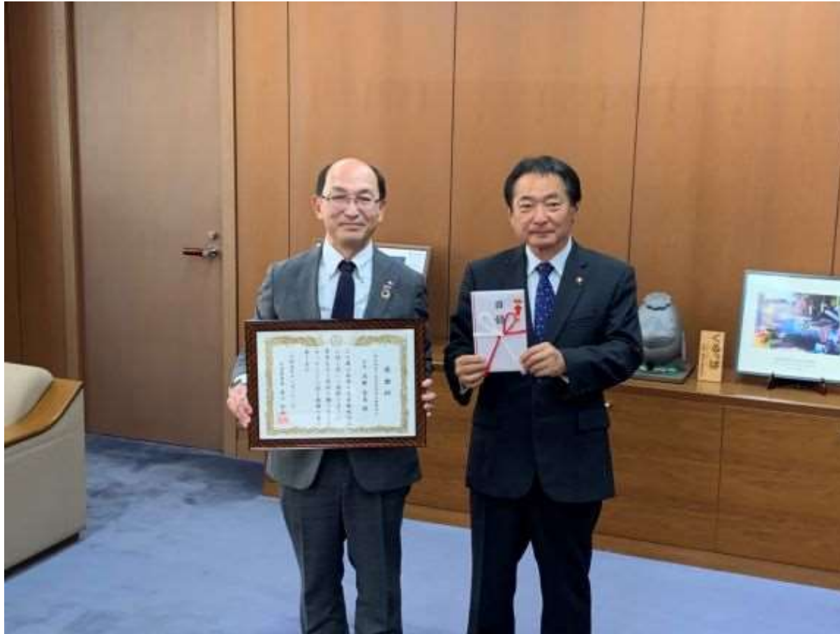
(写真 一般社団法人生命保険協会福岡協会様から寄付金を頂く様子)

一般社団法人生命保険協会福岡協会様より寄付金をいただきました。一般社団法人生命保険協会福岡協会様の温かいご支援に対し、厚くお礼申し上げます。