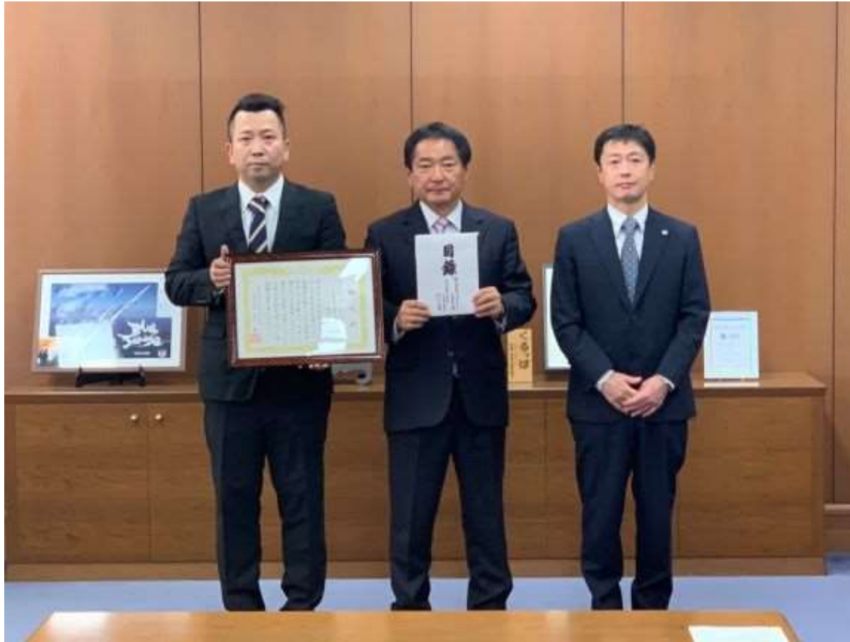
(写真 株式会社ブリヂストン久留米工場様から義援金を頂く様子)

株式会社ブリヂストン久留米工場様より納涼会の売上金を義援金として贈呈頂きました。株式会社ブリヂストン久留米工場様の温かいご支援に対し、厚くお礼申し上げます。