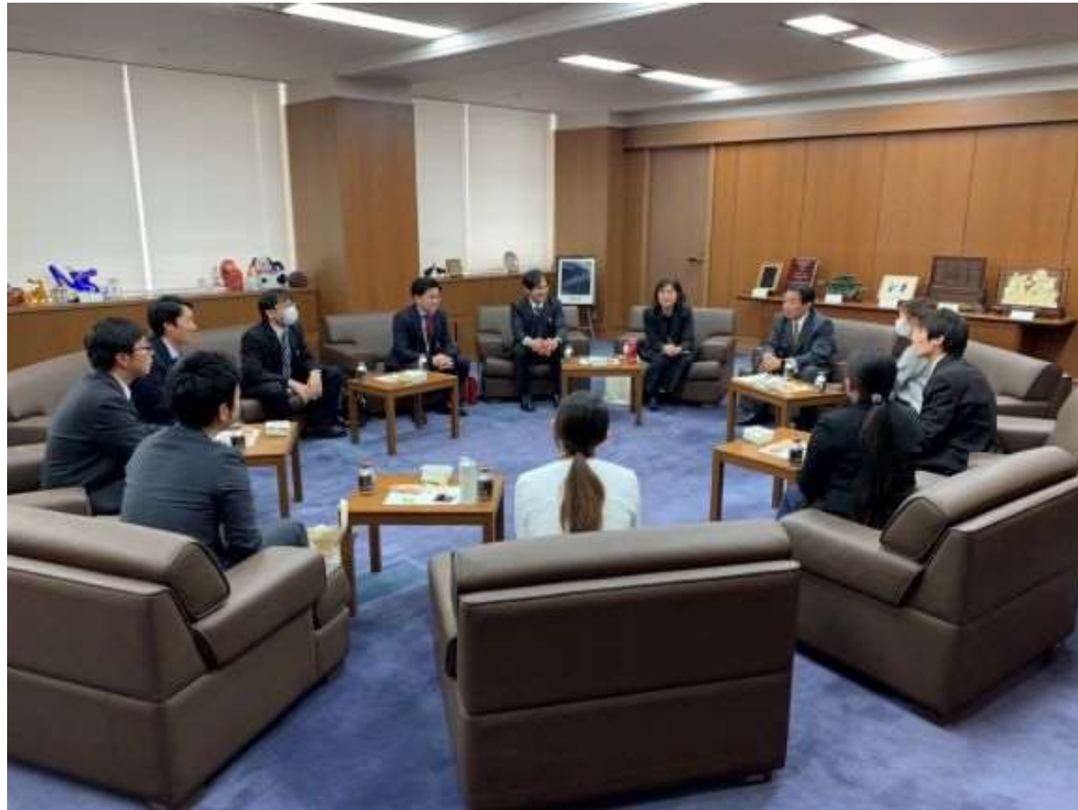
(写真 若手職員と意見交換をしている様子)

若手職員と今後のまちづくりに関するアイデア等について直接意見交換する場を設けました。意見交換を通じて職員の育成を図ります。