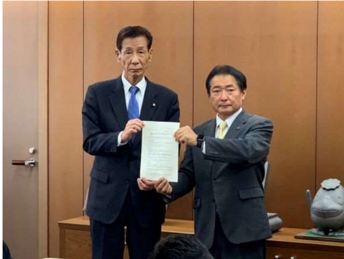
(写真 久留米市議会との懇談会の様子)

令和6年度予算の編成方針について市議会の各会派の代表との懇談会を行いました。議員を通じていただいた市民の皆様の声も、しっかりと参考にいたします。