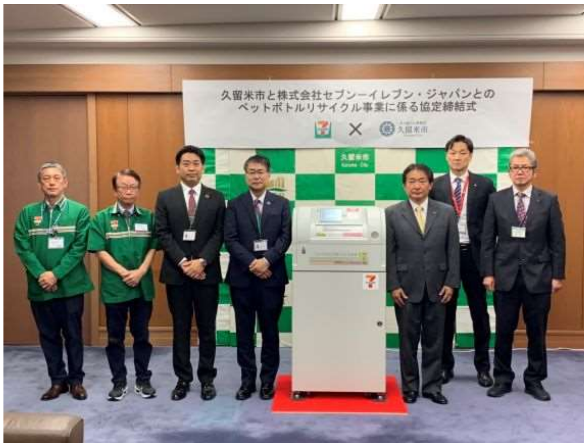
（写真 （株）セブン-イレブン・ジャパン様と記念撮影）

（株）セブン-イレブン・ジャパン様とペットボトルリサイクル事業に係る協定を締結しました。プラスチックごみ削減や資源の有効活用など循環型社会の構築に寄与する先進的な取り組みを実施できることに感謝申し上げます。