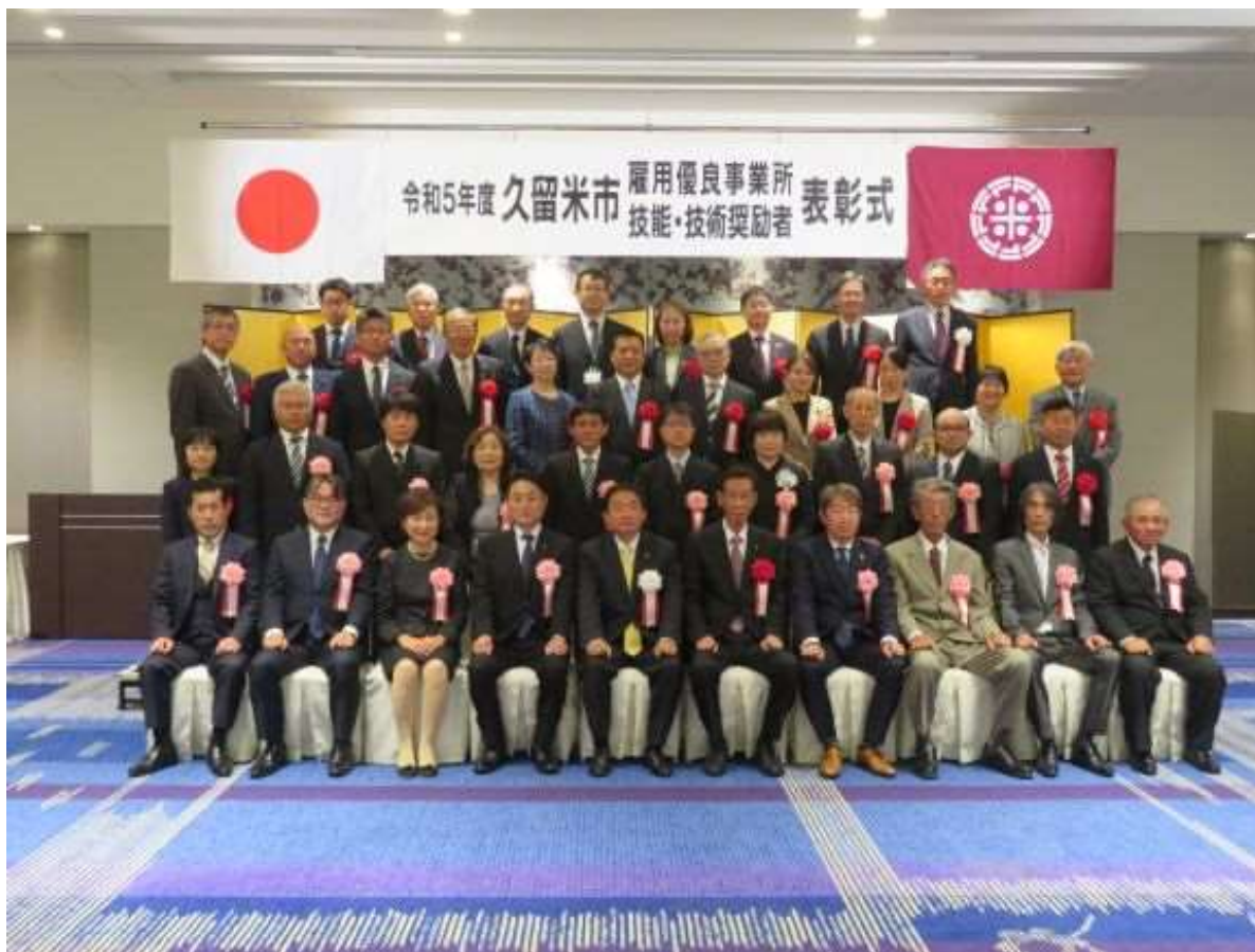
(写真 久留米市雇用優良事業所及び技能・技術奨励者表彰式で記念撮影)

障害者雇用、仕事と家庭の両立支援や女性労働者の活躍推進に積極的に取り組まれている3事業所を雇用優良事業所として表彰いたしました。また、技能・技術奨励者5名、技能・技術優秀士7名、青年技能・技術優秀士1名をそれぞれ表彰いたしました。今回受賞された皆様の今後益々のご活躍を期待いたします。