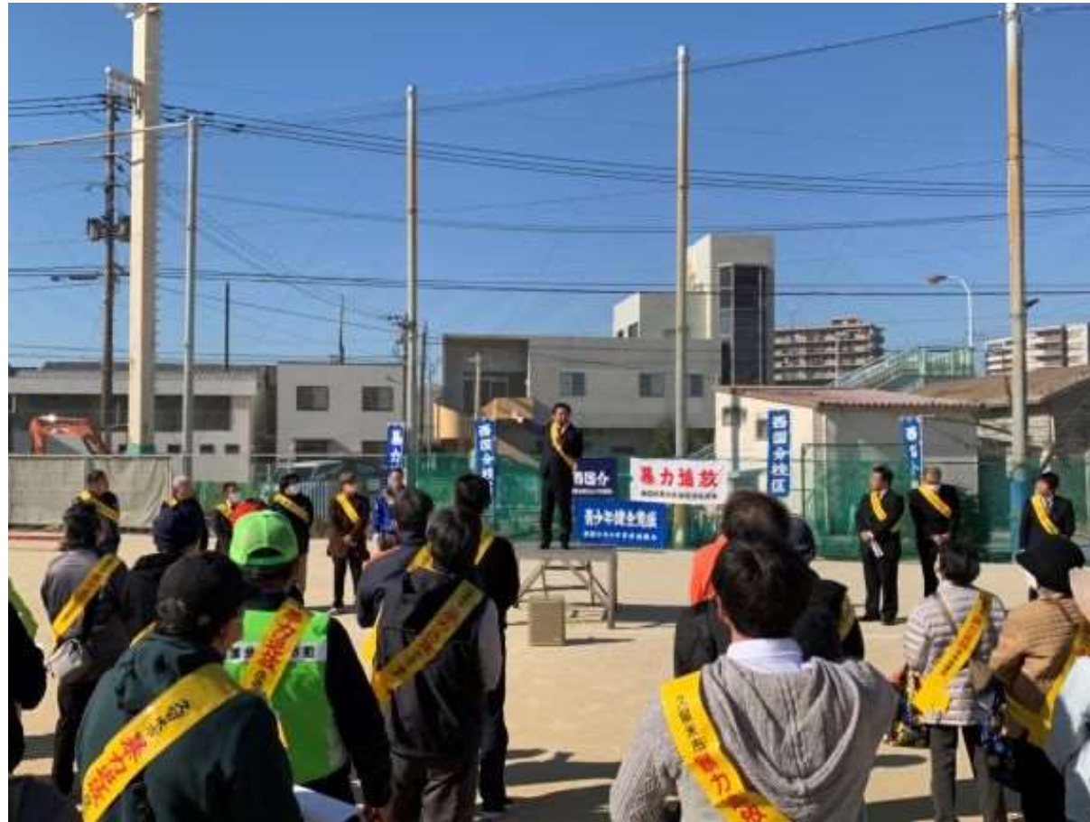
(写真 西国分校区暴力絶滅決起大会で挨拶する様子)

西国分校区暴力絶滅決起大会で挨拶を行いました。西国分校区の皆様には、日頃から安全安心のまちづくりに向け、本市が推進するセーフコミュニティ活動にご尽力頂いております。