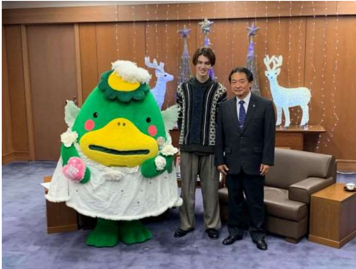
(写真 くるめふるさと大使就任式の様子)

翔様が、くるめふるさと大使に就任されました。お母様の故郷が久留米市で、帰省されたときは久留米の魅力をSNSで発信頂いております。大使就任に合わせ「第19回くるめ光の祭典広報アンバサダー」にもご就任頂いております。