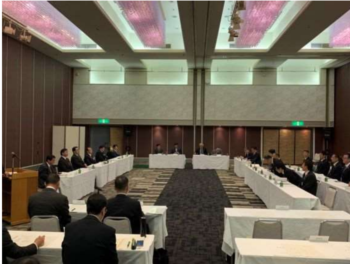
(写真 合同要望会の様子)

福岡県に対し、山ノ井川治水促進期成会、大刀洗川・陣屋川改修促進期成会の合同要望を行いました。近年の降雨による被害が激甚化、頻発化していることから、国・県と連携して対策を進めます。