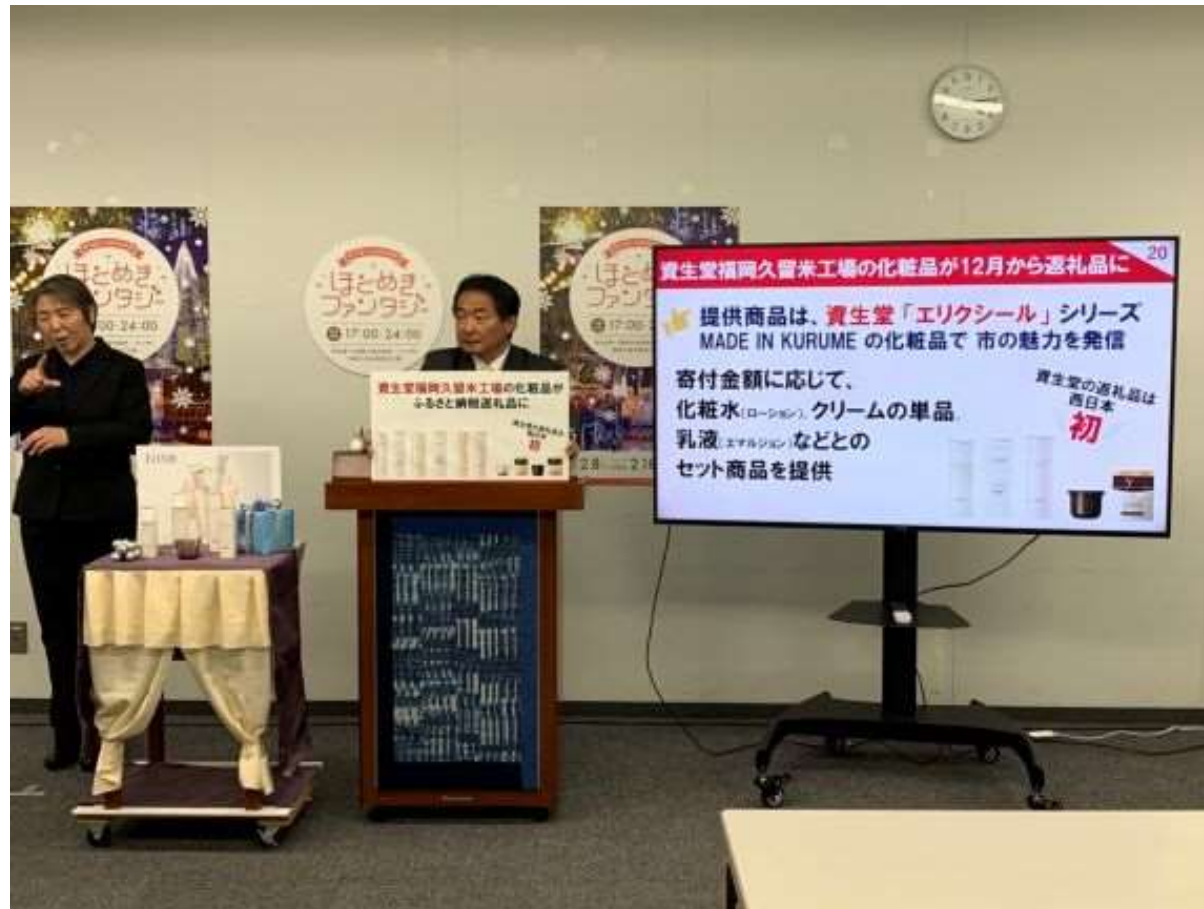
(写真 11月定例市長記者会見の様子)

11月の定例市長記者会見を行いました。7月大雨災害に関する対応状況の報告や、資生堂福岡久留米工場の製品をふるさと納税返礼品にすること等を紹介しました。