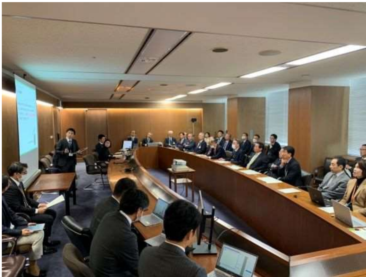
(写真 窓口改革ワーキンググループ報告会の様子)

「手順で書かない」「窓口で待たない」「役所に行かない」というバーチャル市役所の実現のため、窓口改革ワーキンググループを設置しました。まずは窓口利用者の実態を把握するため、職員が転入に関する手続きなどを疑似体験した内容について報告しました。