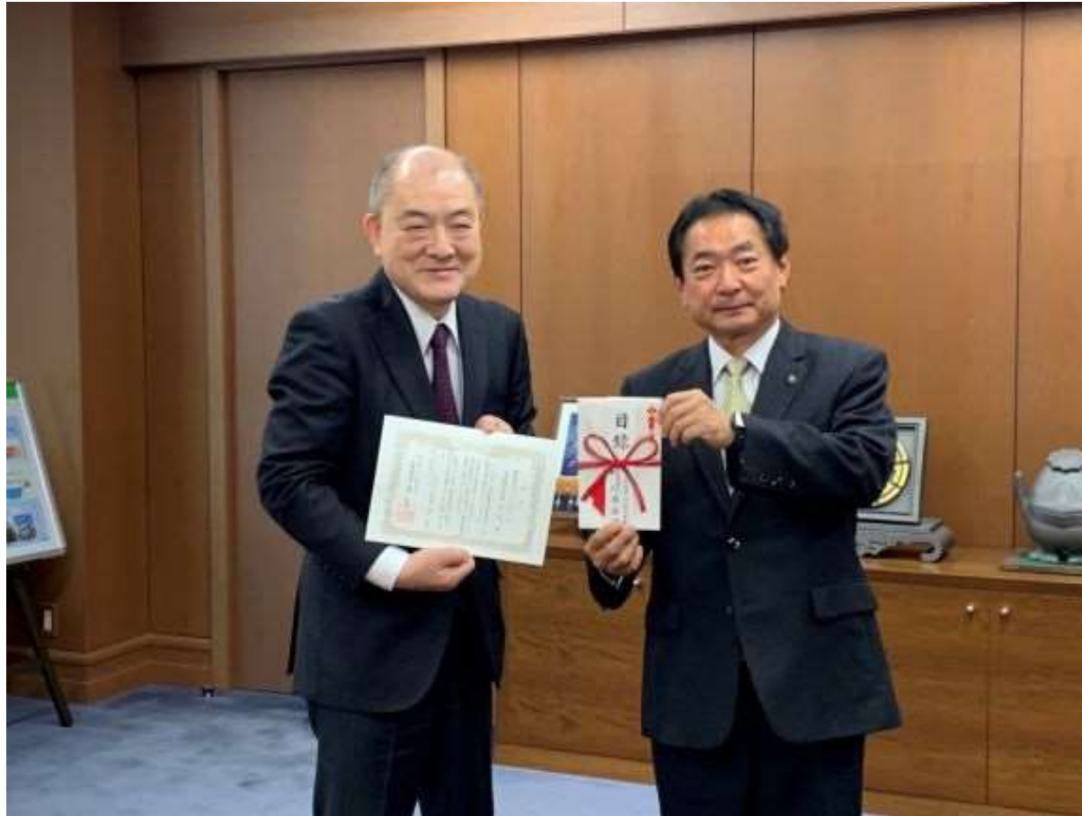
(写真 株式会社スーパーモリナガ様から寄付金を頂く様子)

株式会社スーパーモリナガ様より寄付金をいただきました。平成19年から毎年寄附をいただいております。今年で17回目となります。株式会社スーパーモリナガ様の温かいご支援に対し、厚くお礼申し上げます。