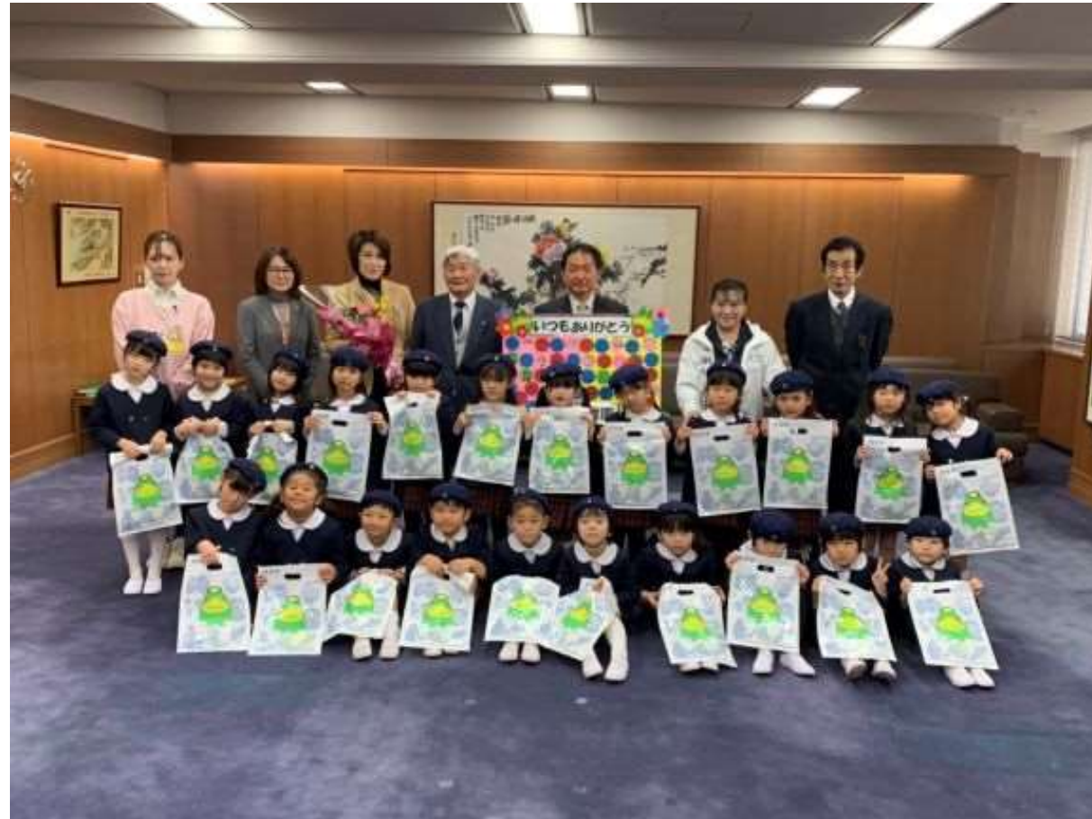
(写真 国分幼稚園の皆様と記念撮影)

国分幼稚園様にお越しいただきました。勤労感謝の日にちなんで、子どもたちから花束と手作りのパネルを贈呈していただきました。