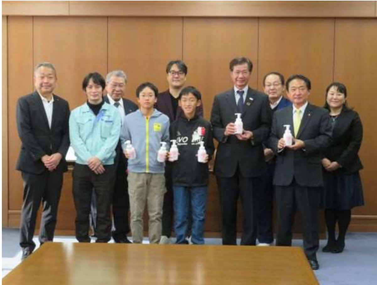
(写真 久留米中央ロータリークラブ様からハンドソープを頂く様子)

久留米中央ロータリークラブ様よりハンドソープを寄附していただきました。久留米市立小学校や久留米特別支援学校で使わせていただきます。久留米中央ロータリークラブ様の温かいご支援に対し、厚くお礼申し上げます。