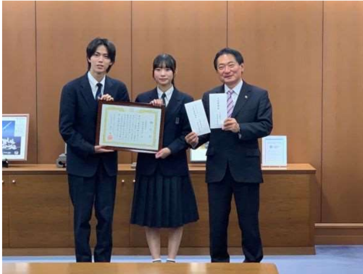
(写真 南筑高等学校様から義援金及び募金を頂く様子)

南筑高等学校様より災害義援金及びウクライナ人道危機救援募金を贈呈頂きました。南筑高等学校様の温かいご支援に対し、厚くお礼申し上げます。