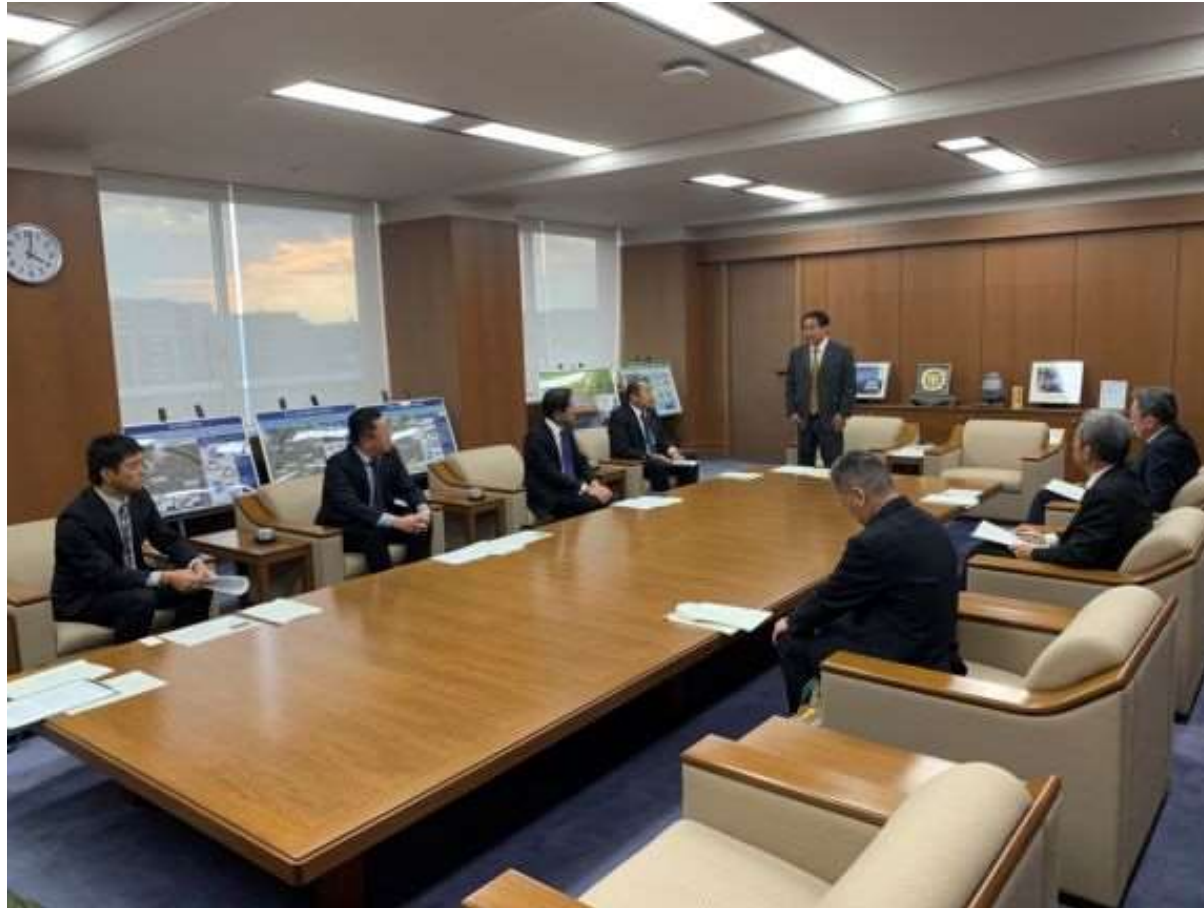
(写真 久留米市土木協同組合様と意見交換会をする様子)