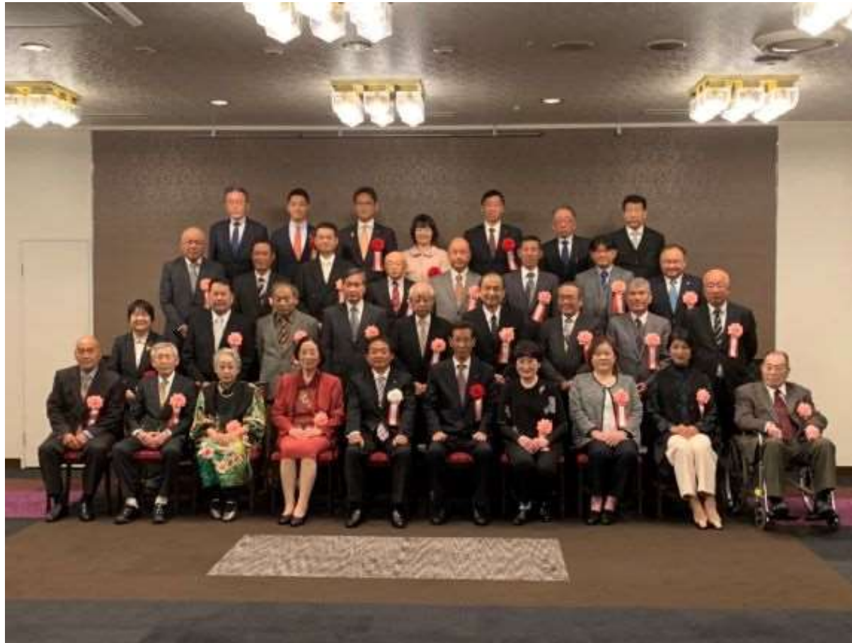
(写真 ふるさと市民賞受賞者との記念撮影)

市民の福祉向上と地域の振興発展に貢献され、久留米のまちづくりに大きく寄与された22名と2団体を表彰いたしました。受賞された皆様の久留米市を想う熱い気持ちとたゆまぬ努力に、心からの敬意と深い感謝を捧げます。