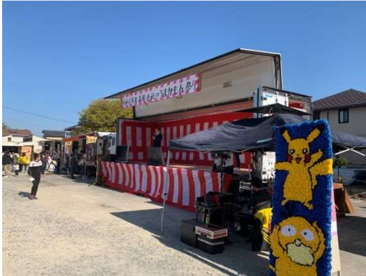
(写真 秋の善導寺うまかもん祭りの様子)

善導寺秋のうまかもん祭りに立ち寄りしました。好天のもと、キッチンカーや地元の名店多数が出店し、多くの人で賑わいました。