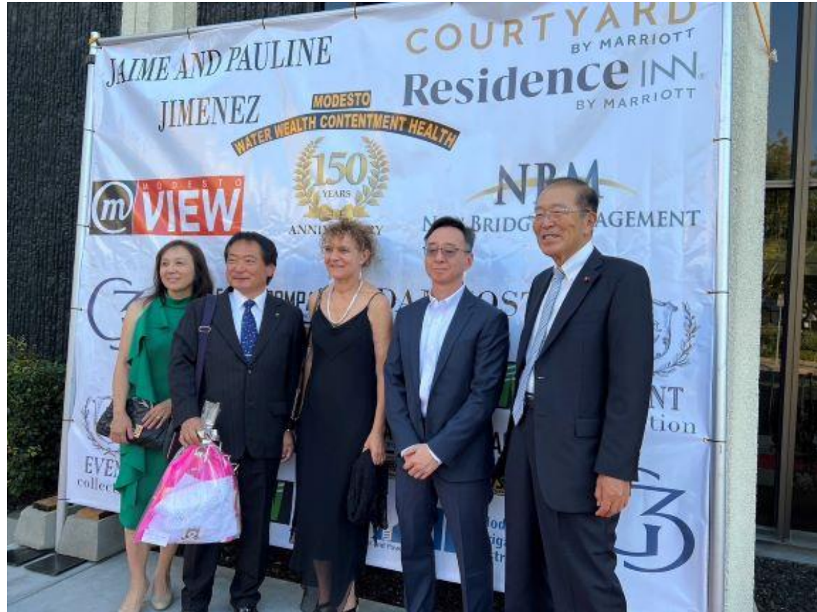
(写真 モデスト市150周年記念式典で記念撮影)

久留米市の姉妹都市・アメリカ合衆国モデスト市で開催された150周年記念式典に参加しました。式典には、モデスト市の海外姉妹都市を持つカナダ、ウクライナ、メキシコ、フランスからも参加され、ともに市政150周年をお祝いしました。