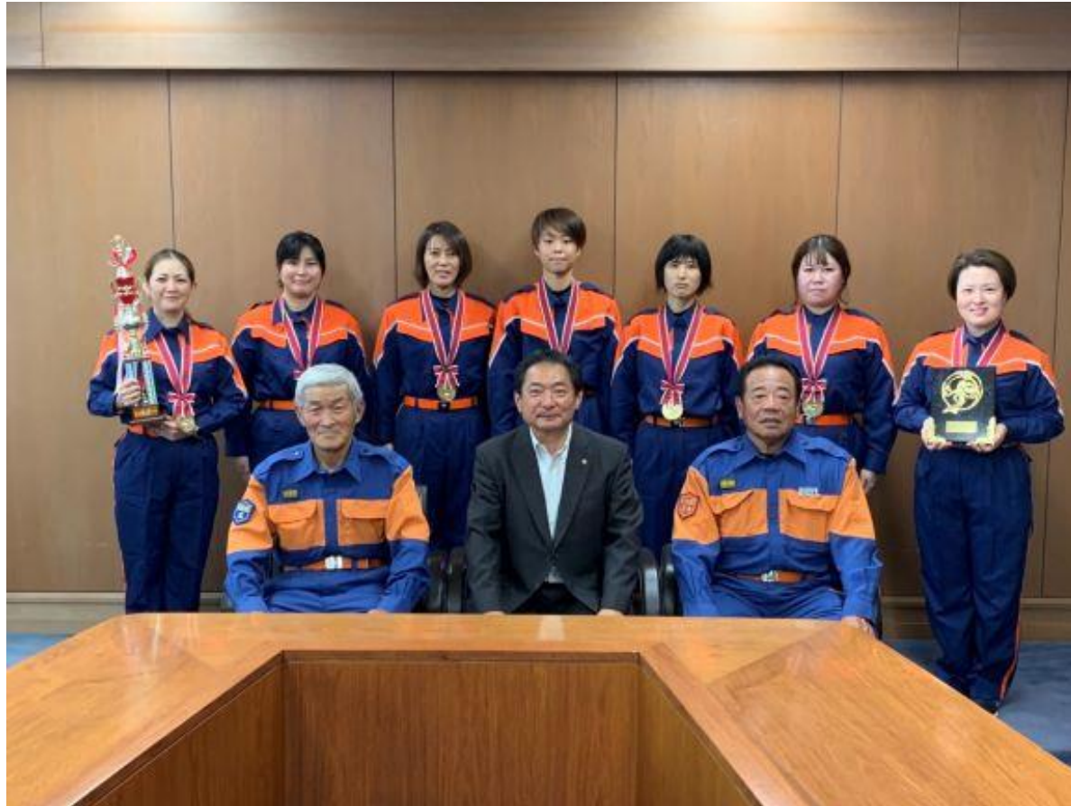
(写真 久留米市女性消防団様と記念撮影)

久留米市女性消防団員様が来所され、福岡県代表として「第25回全国女性消防操法大会」に出場されることを報告していただきました。日々の訓練で培った心・技・体、そしてチームワークを存分に発揮し、全国の舞台で活躍されることを祈念いたします。