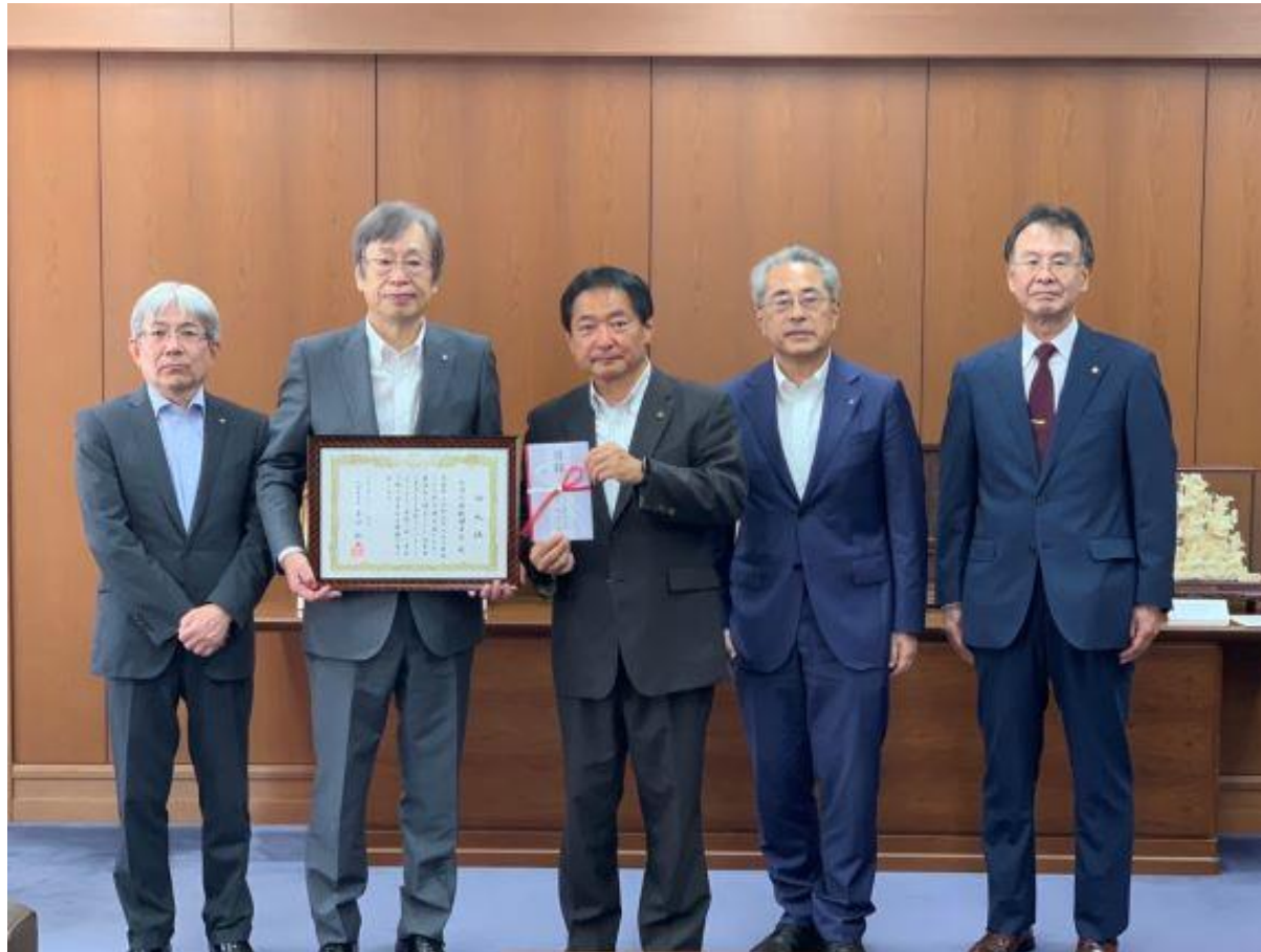
(写真 九州北部税理士会様から義援金を頂く様子)

九州北部税理士会様より災害義援金をいただきました。九州北部税理士会様の温かいご支援に対し、厚くお礼申し上げます。