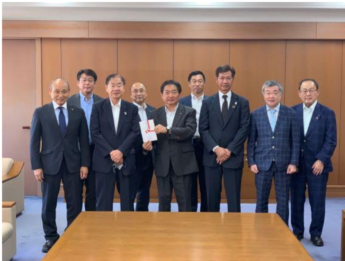
(写真 ロータリークラブの皆様から義援金を頂く様子)

久留米ロータリークラブ様、久留米中央ロータリークラブ様、久留米東ロータリークラブ様、久留米北ロータリークラブ様より災害義援金をいただきました。ロータリークラブの皆様の温かいご支援に対し、厚くお礼申し上げます。