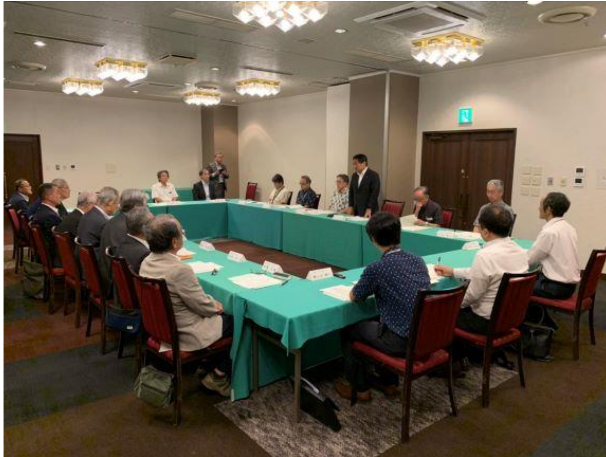
(写真 行政懇談会で挨拶する様子)

田主丸町商工会、久留米東部商工会、久留米南部商工会との行政懇談会を行いました。地域の中小企業者への経営改善普及事業や地域復興事業の取り組み活動など、各商工会の現状と課題について意見交換を行いました。