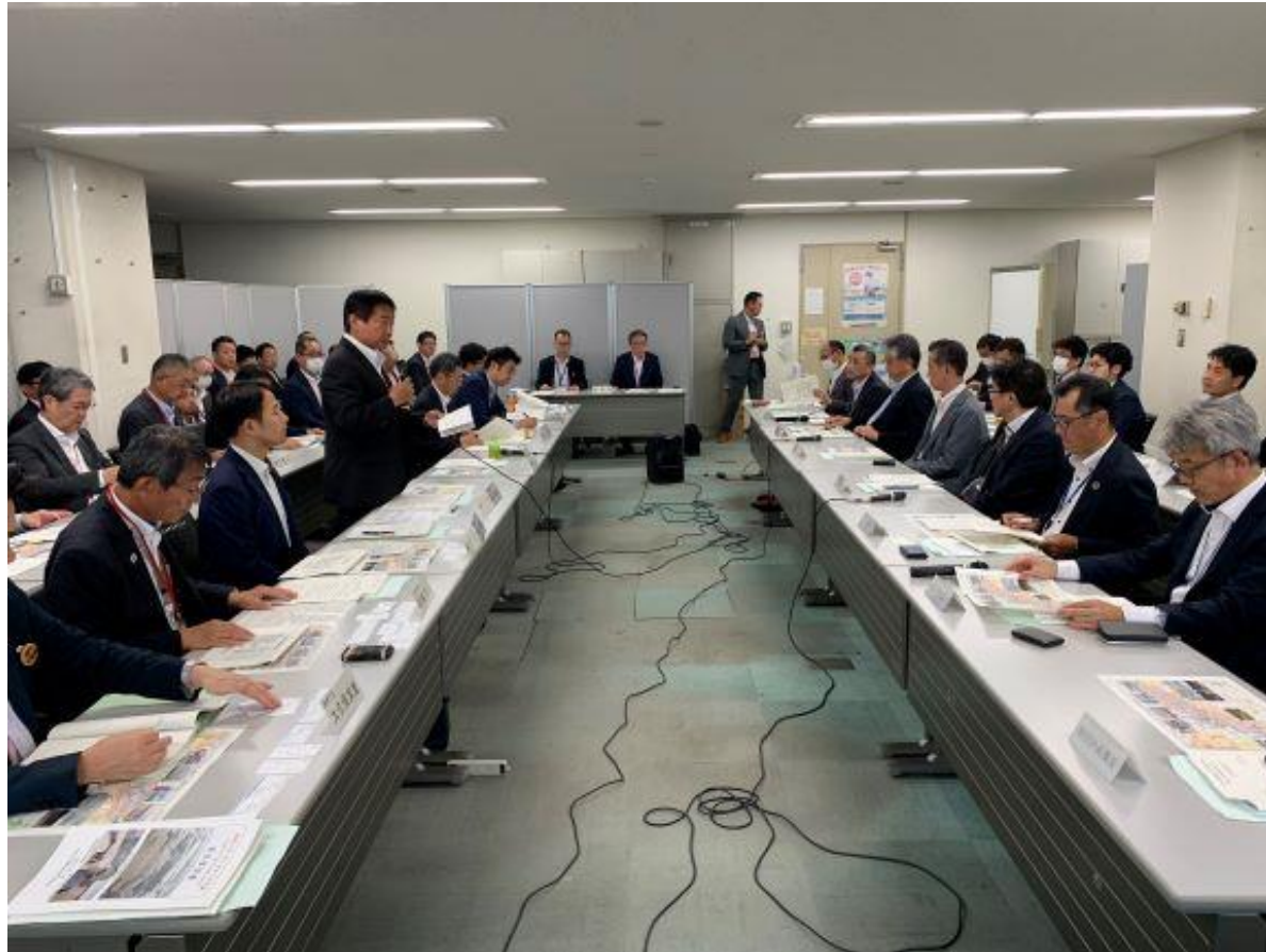
(写真 意見交換会の様子)

国土交通省水管理・国土保全局に対し、九州治水期成同盟連合会の会長として要望活動を行いました。九州内の各期成会も参加し、現在の取り組み状況や課題などについて状況を説明し、課題解決に向けて要望を行いました。