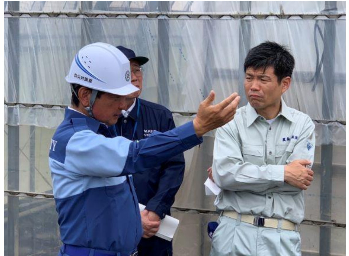
(写真 勝俣農林水産副大臣視察の様子)