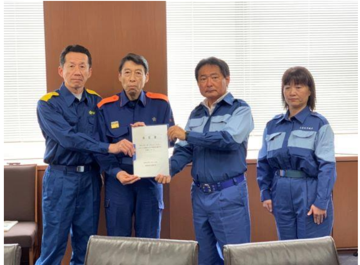
(写真 福岡県知事、福岡県議会議員長視察の様子)