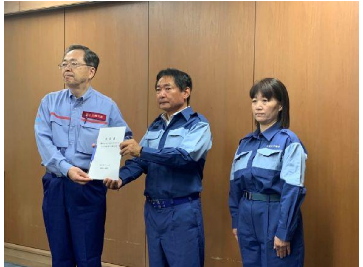
(写真 齋藤国土交通大臣視察の様子)