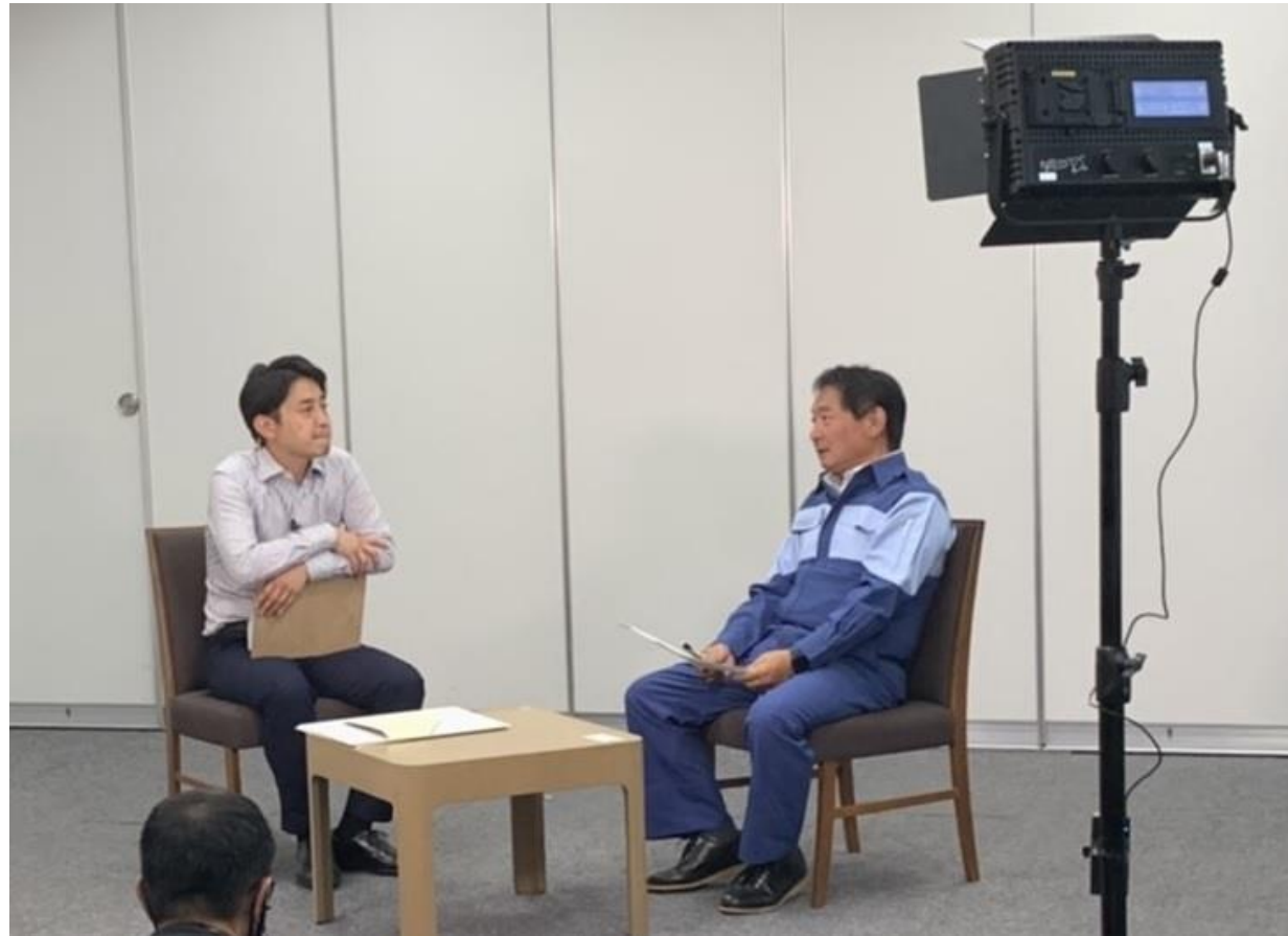
(写真 テレビ取材を受けている様子)

大雨による災害についてTNC様から取材を受け、生放送されました。インタビューでは、ハザードマップや避難についての課題についてお話ししました。