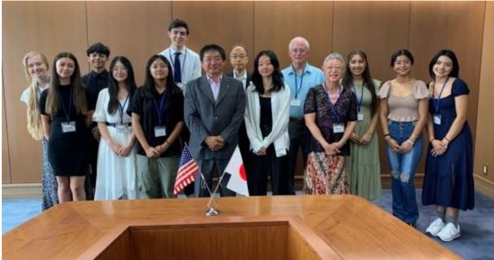
(写真 モデスト交換学生と記念撮影)

米国の姉妹都市モデスト市から交換学生の皆様がお越しになりました。青少年の交流事業は、姉妹都市を締結の翌年1993年からスタートしています。交換学生の皆様には、ホストファミリーを始め、久留米市の皆さんや文化に親しんでいただき、交流が実りあるものになることを祈念いたします。