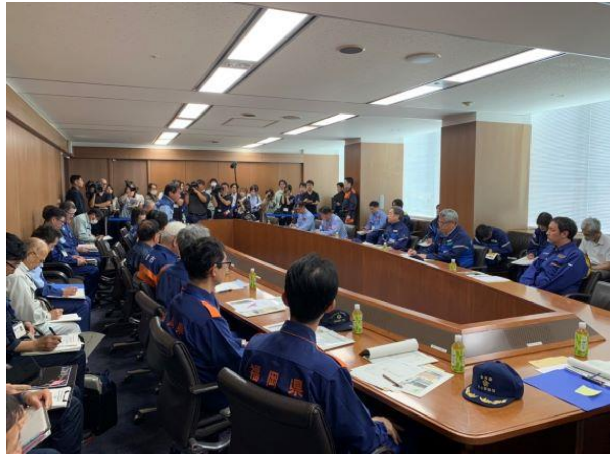
（写真 谷内閣府特命担当大臣（防災）視察の様子）