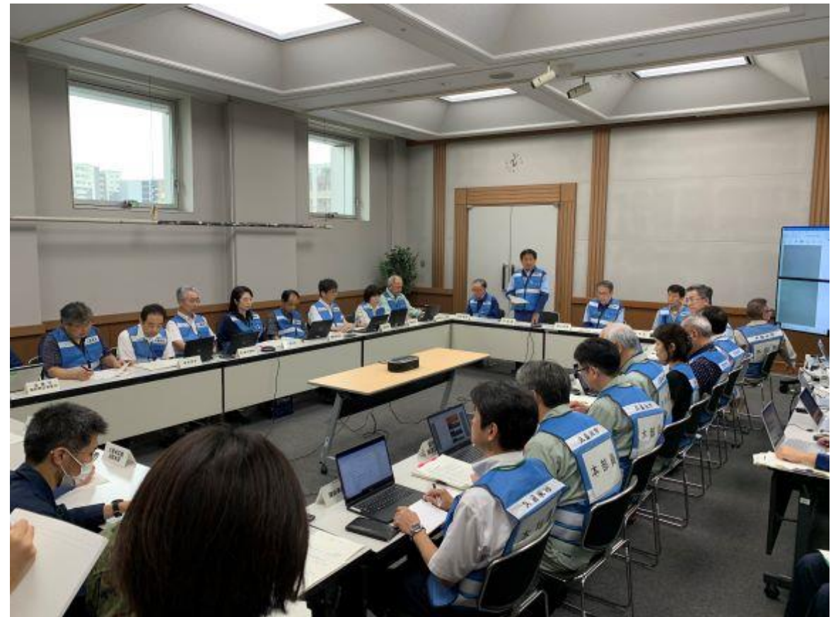
（写真 土砂災害現場と災害対策本部会議（7月10日）の様子）