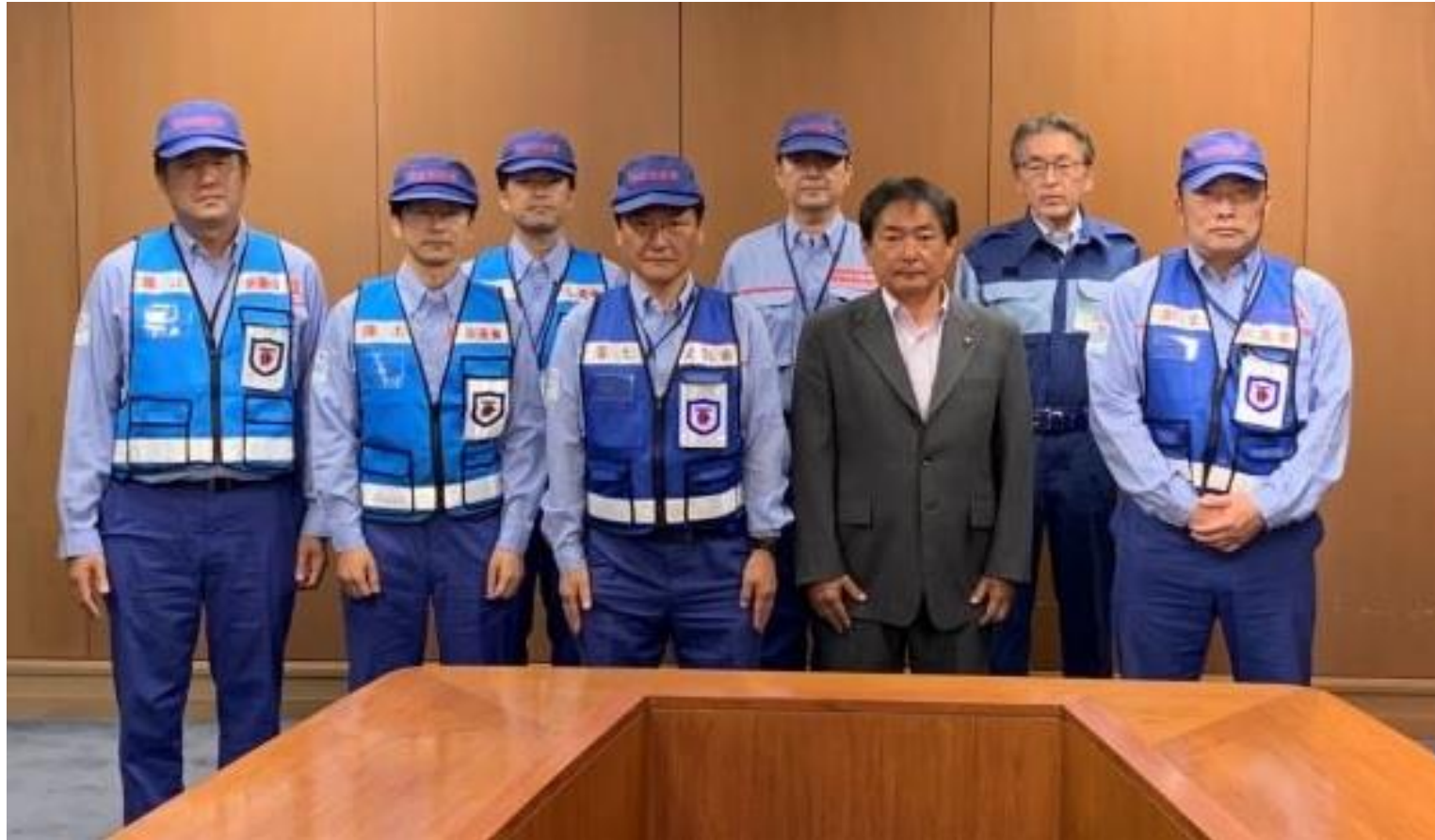
（写真 TEC-FORCE（テックフォース）様と記念撮影）

国土交通省緊急災害対策派遣隊「TEC-FORCE（テックフォース）」がお越しになりました。TEC-FORCEは大規模自然災害時に地方公共団体の支援活動をしており、7月10日からの大雨による災害調査等をしていただきます。私から、歓迎の気持ちと活動への期待を伝えました。