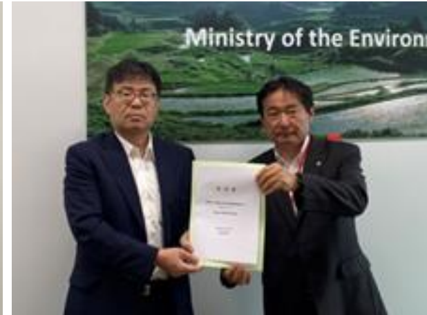
(写真 各省庁へ要望書を手渡す様子)