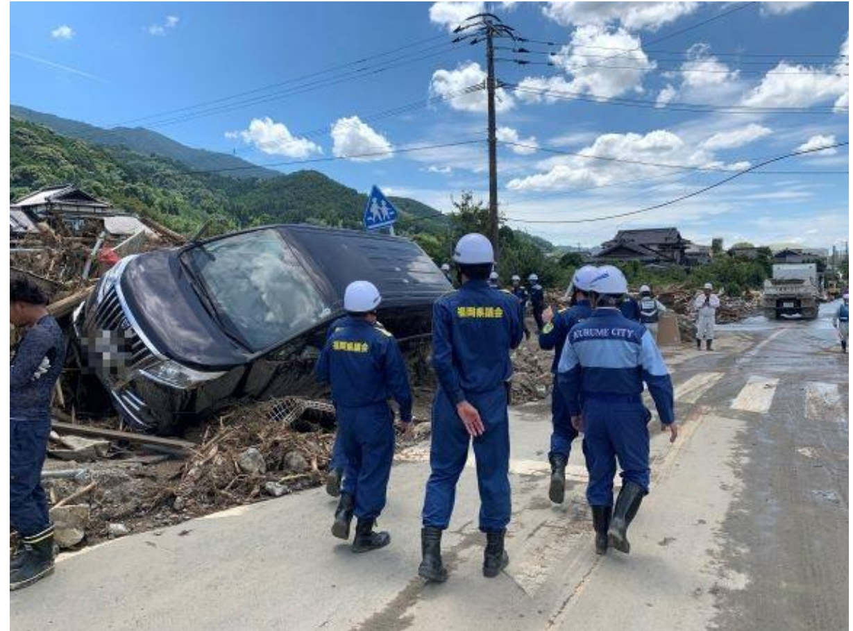
(写真 自由民主党福岡県議団・支部連合会視察の様子)