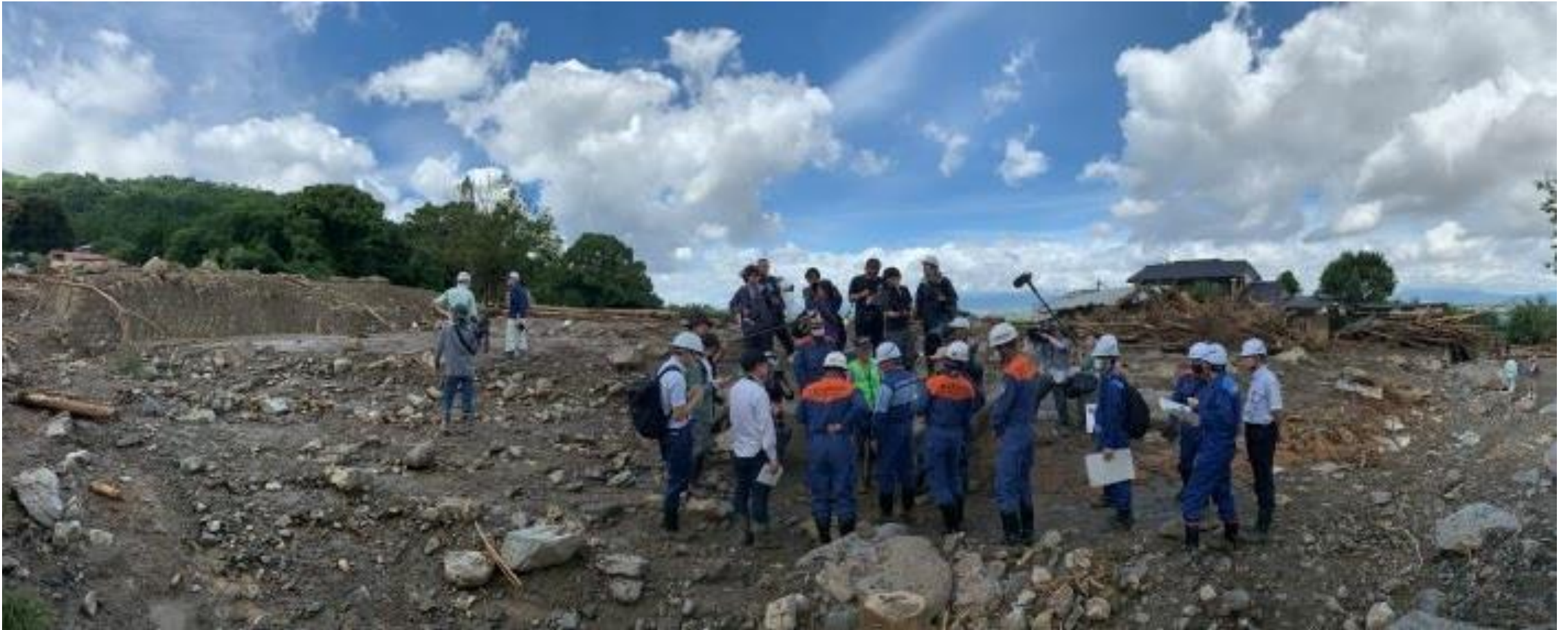
(写真 田主丸町竹野地区を視察する様子)

甚大な被害が発生した田主丸町竹野地区の土砂災害現場を視察しました。想像を絶する被害でした。この災害で亡くなられた方のご冥福をお祈りし、被災された皆様にお見舞いを申し上げます。