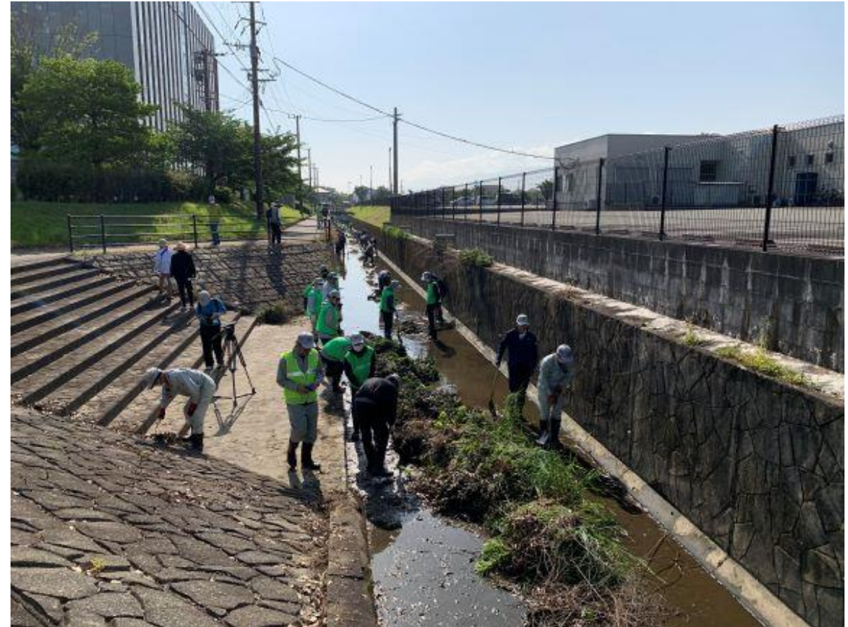
(写真 「みんなで流域治水！」の取り組みの様子)