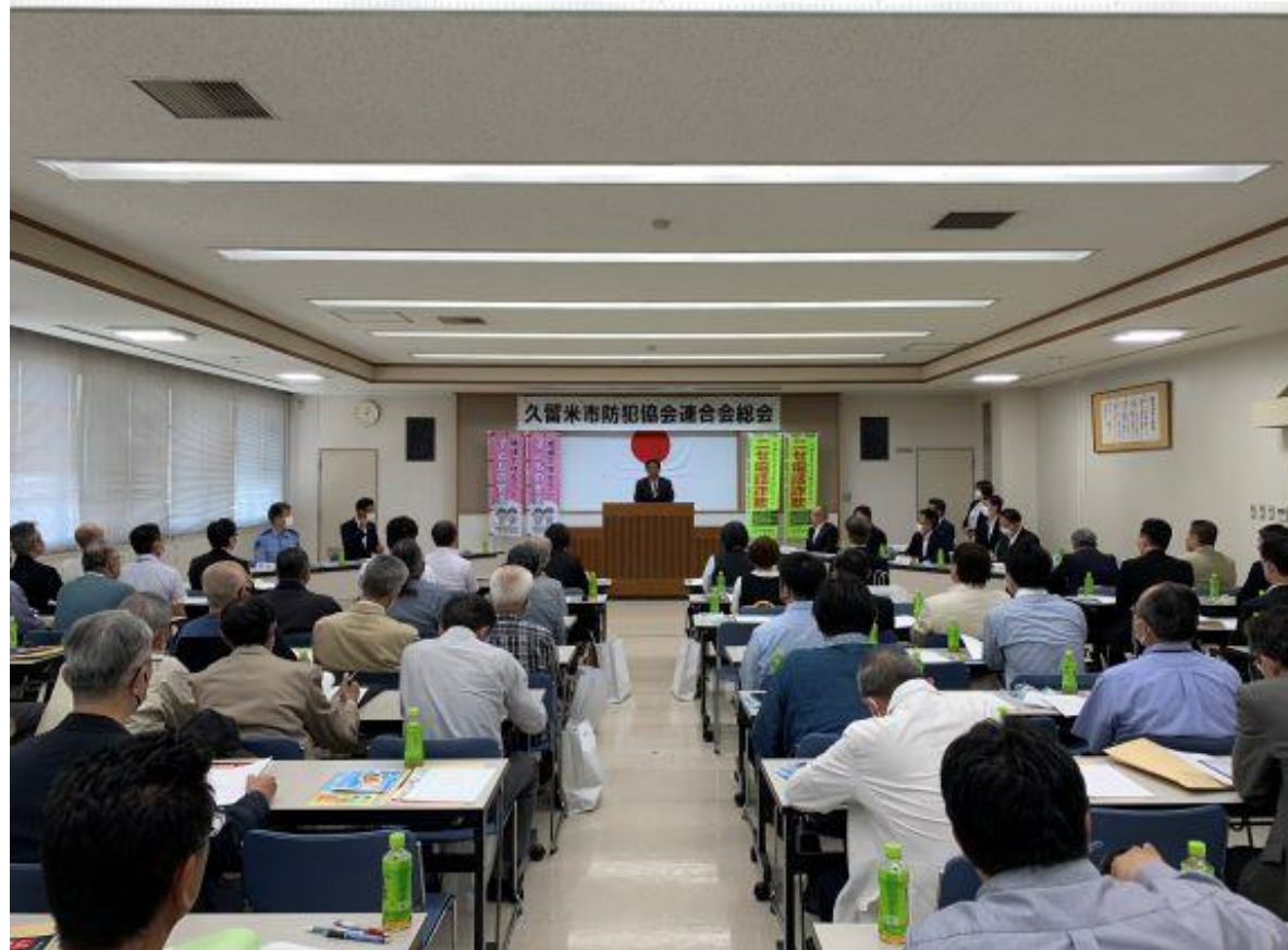
(写真 久留米市防犯協会連合会総会の様子)

久留米市防犯協会連合会総会に出席しました。日頃から青パト車による校区防犯パトロールへの取組など、市民が「安心して安全に暮らせる久留米」の取り組みを進めて頂いています。久留米市も引き続き、セーフコミュニティの「みんなで取り組む安全安心まちづくり」を推進していきます。