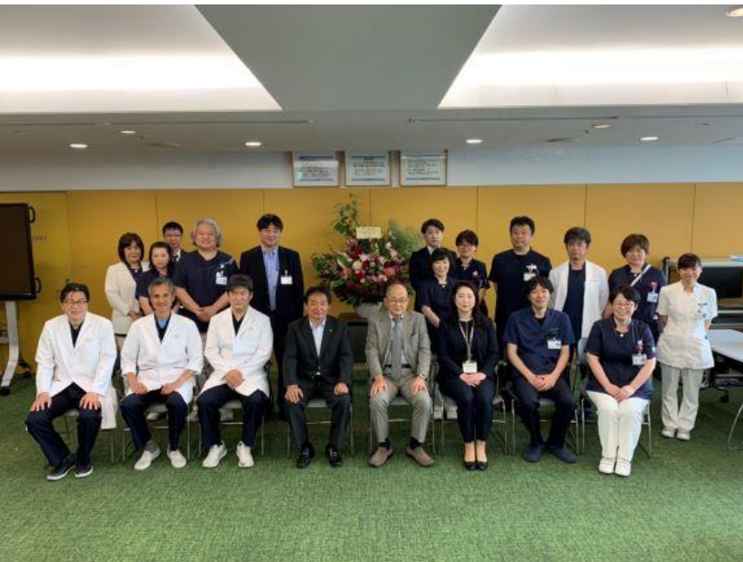
(写真 聖マリア病院様と記念撮影)

新型コロナウイルス対応において多大な貢献を頂きました、聖マリア病院様、JCHO久留米総合病院様、新古賀病院様を訪問し、皆様に感謝を申し上げます。新型コロナウイルス感染症の脅威から久留米市民を守るため、中核的で大変な役割を担って頂き、心から感謝申し上げます。