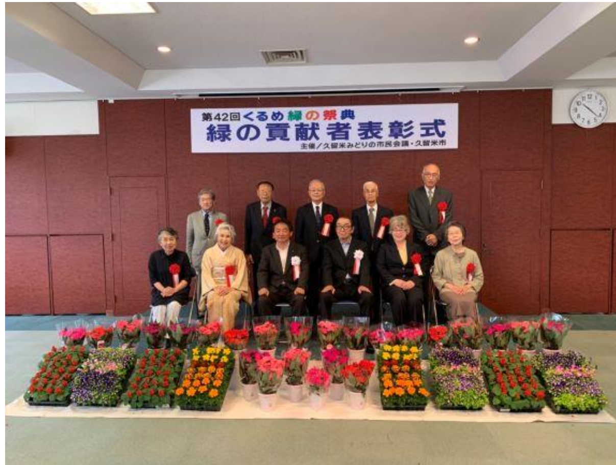
(写真 緑の貢献者表彰式の様子)

第42回くるめ緑の祭典に出席し、「緑の貢献者」を表彰しました。今回、表彰した6団体並びに4名の皆様は、市民の憩いとなる花壇づくりや自然保護活動など、長きにわたりご尽力を頂いています。水と緑の人間都市に向けてご協力いただいていることに感謝いたします。