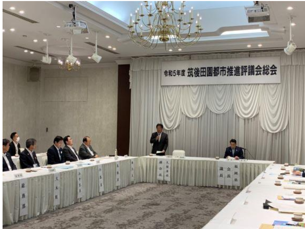
(写真 筑後田園都市推進評議会総会の様子)

筑後田園都市推進評議会の副会長として、総会に出席しました。この会議は大牟田市、久留米市、柳川市、八女市、筑後市、大川市、小郡市、うきは市、みやま市、大刀洗町、大木町、広川町の12市町で構成されており、相互に連携・補完し合うネットワーク型の広域都市づくりを目指し、県・市町が協働したプロジェクトを実施しています。