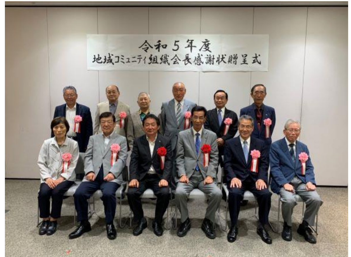
(写真 贈呈式の様子)