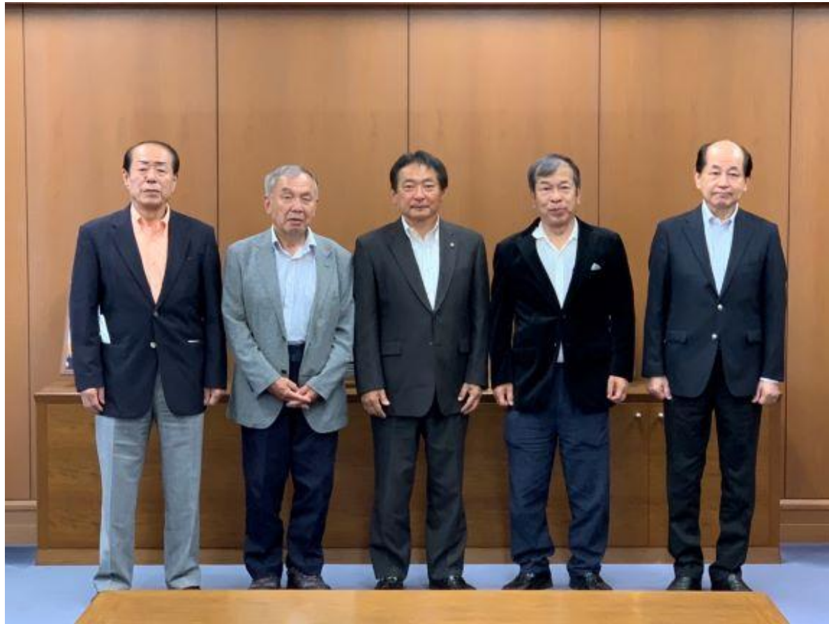
(写真 久留米市校区まちづくり連絡協議会の皆様と記念撮影)

久留米市校区まちづくり連絡協議会の新会長・新副会長がお越しになりました。久留米市の協働の最大のパートナーとして、日頃よりまちづくり活動にご尽力頂いていることに感謝いたします。