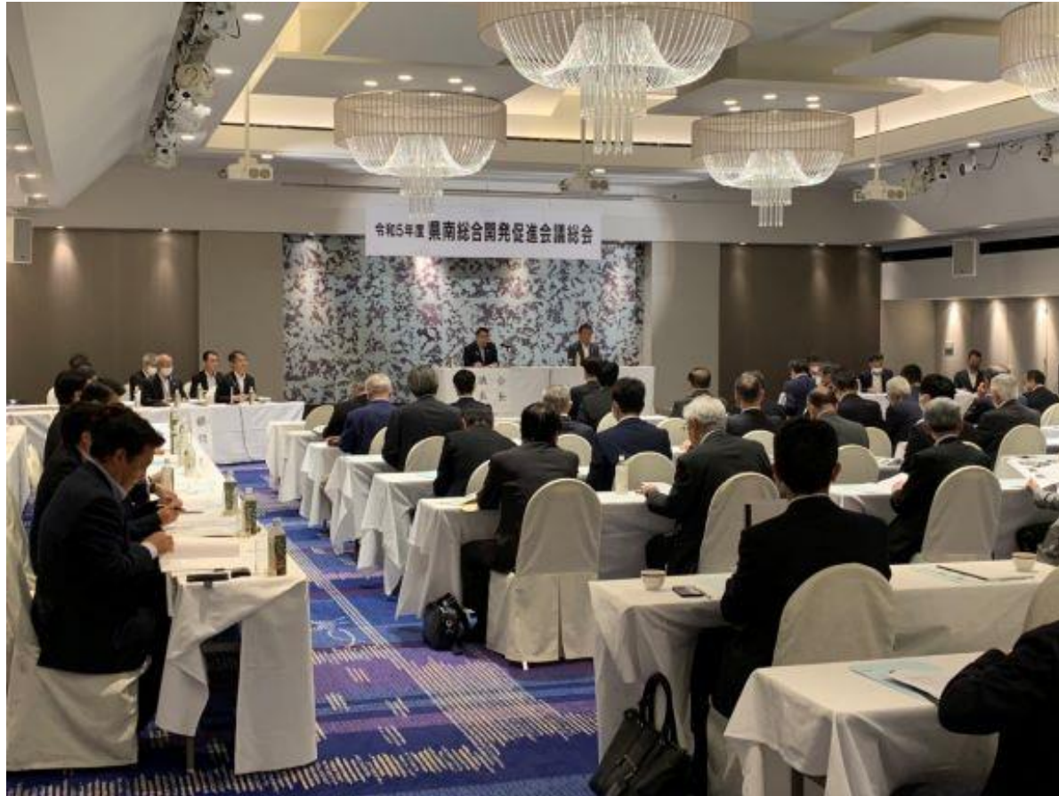
(写真 県南総合開発促進会議総会の様子)

県南総合開発促進会議総会に副会長として出席しました。4年ぶりに対面での開催となった今回の総会では、治水事業の促進や県南地域におけるJR（鹿児島本線）の利便性の維持・確保などを、協議・決定しました。