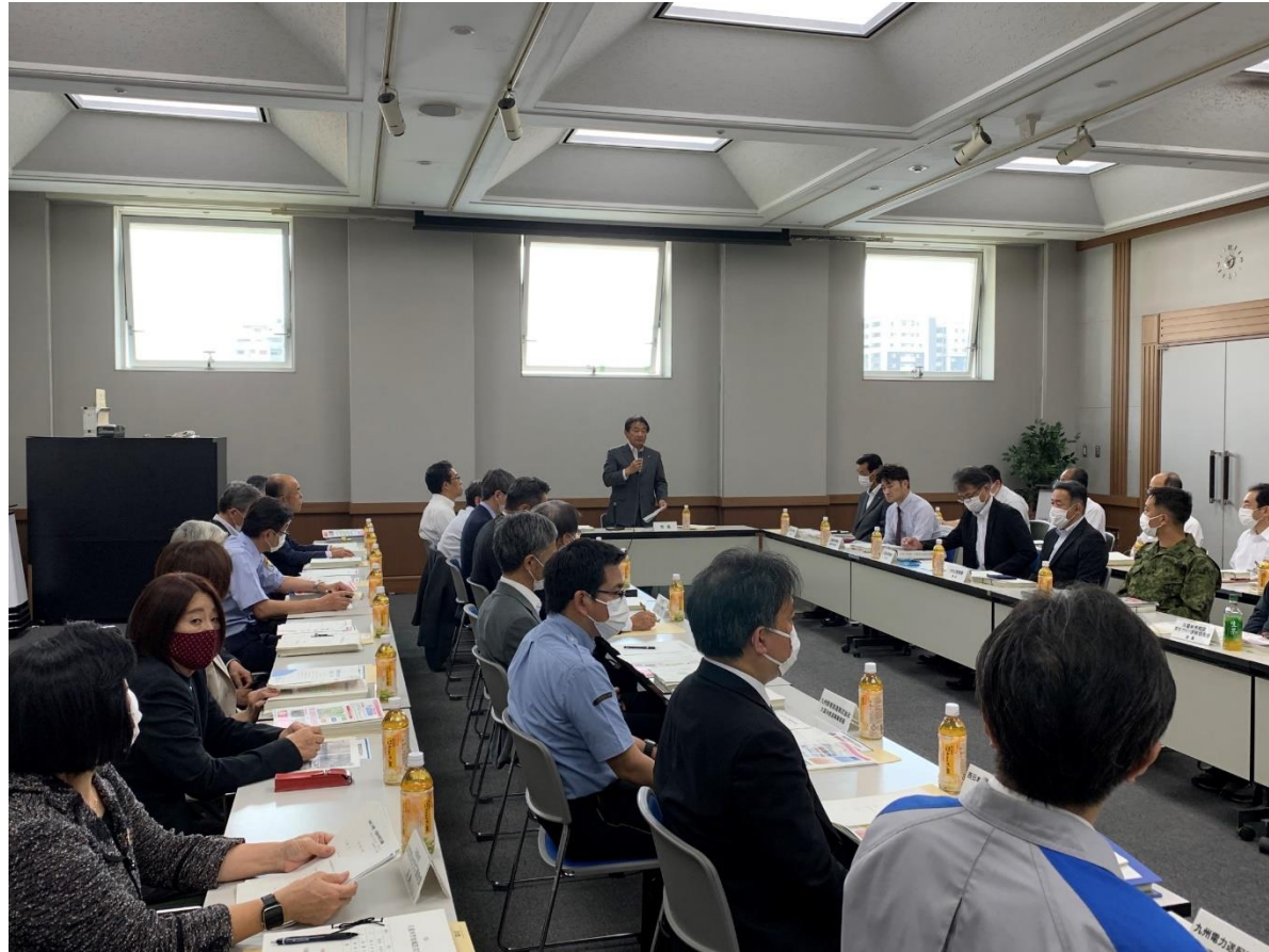
(写真 久留米市防災会議の様子)

令和5年度久留米市防災会議を開催しました。久留米市地域防災計画の策定及び推進をはじめ、地震や風水害など、防災に係る総合的な事項について審議しました。今後とも、防災体制の充実を図るとともに関係機関の連携を図って参ります。