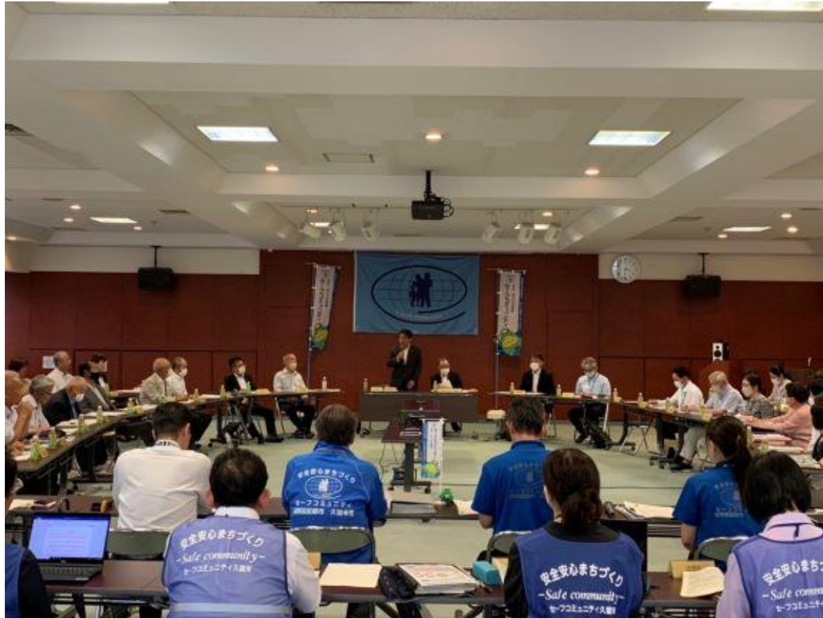
(写真 久留米市セーフコミュニティ推進協議会の様子)

久留米市セーフコミュニティ推進協議会に会長として出席しました。久留米市が国際認証を取得して10年目となり、令和5年度は3回目の国際認証取得に向けた本審査があります。「安心・安全で活力にあふれた、誰もが生き生き生活・活躍できる共生のまち」の実現にむけて、セーフコミュニティの取り組みを発展させてまいります。