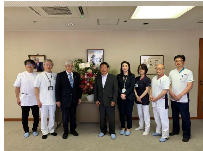
(写真 新古賀病院様と記念撮影)