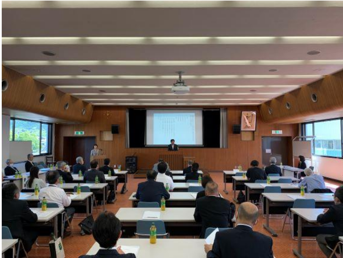
(写真 久留米地区職業訓練協会総会の様子)

久留米地区職業訓練協会の会長として、第50回総会に出席しました。この協会では、地域の職業能力開発の中核機関として、新たな職業能力の開発や、職業訓練の実施を通じて地域の雇用促進と経済の発展に尽力しています。