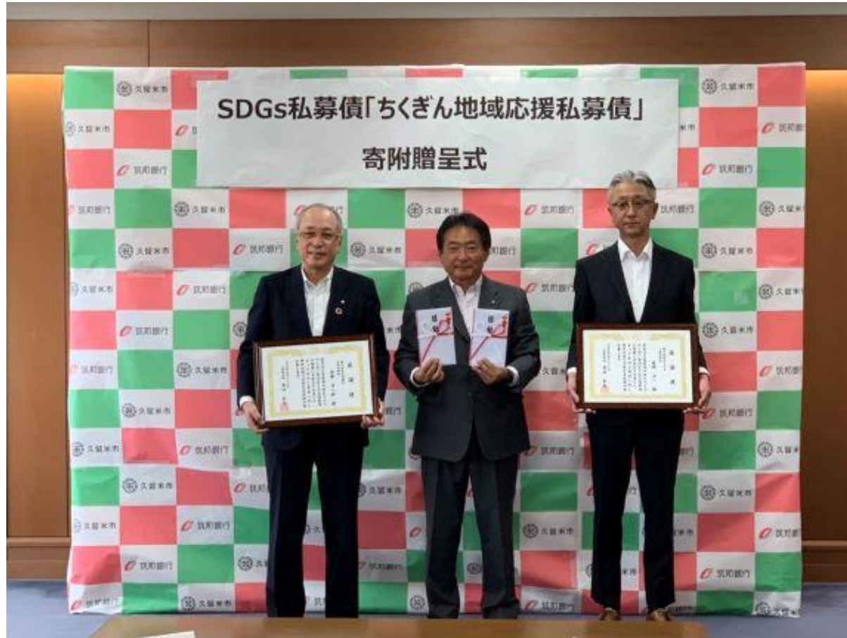
(写真 寄附贈呈式の様子)

株式会社モリサキ様と筑邦銀行様より現金100万円を寄附いただきました。今回の寄附金は、地域社会を応援するとの「ちくぎん地域応援私募債」の趣旨にもとづき、水害対策などの地域応援に活用させていただきます。