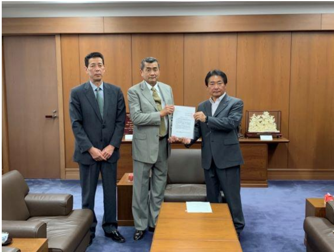
(写真 ふくおか県 酪農業 協同組合様と記念撮影)

ふくおか県 酪農業 協同組合様より、牛乳消費拡大PRのため、久留米市農業協同組合酪農部会が6月1日「牛乳の日」に道の駅くるめで牛乳の無償配布を行うことを報告いただきました。また、酪農業の営農継続支援について意見交換を行いました。