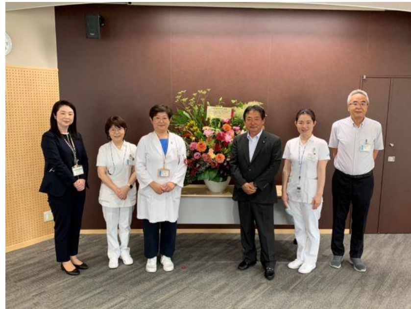
(写真 JCHO久留米総合病院様と記念撮影)