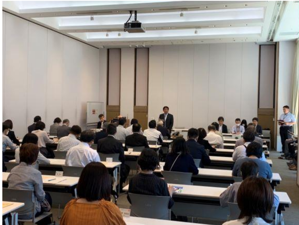
(写真 久留米市人権啓発推進協議会総会の様子)

久留米市人権啓発推進協議会に会長として出席しました。この会では、1998年度の発足以来、部落差別をはじめ、あらゆる差別のない人権が確立されたまちを目指し、市民の皆様との協働により、さまざまな啓発事業を実施しています。