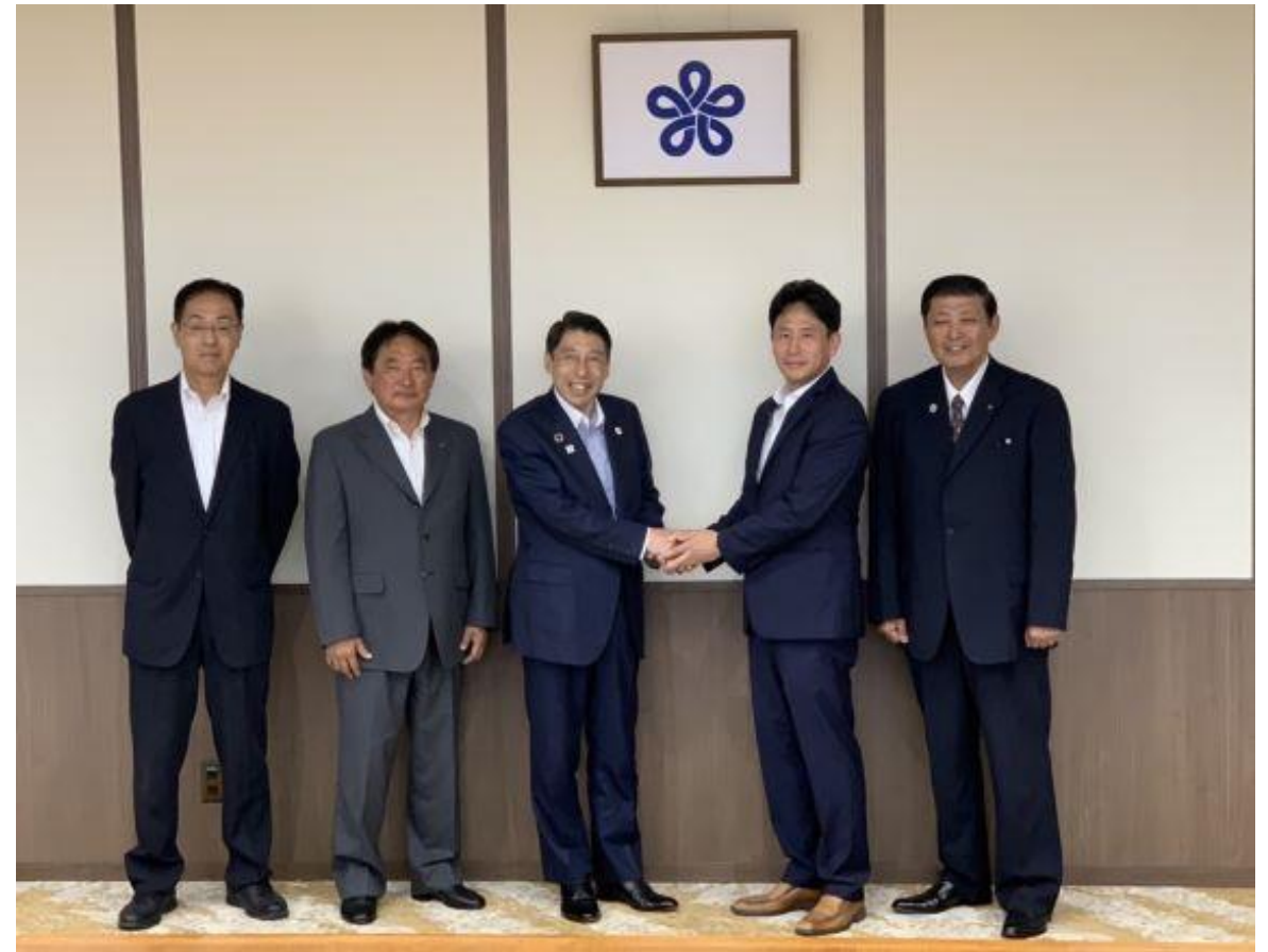
(写真 福岡県知事表敬の様子)