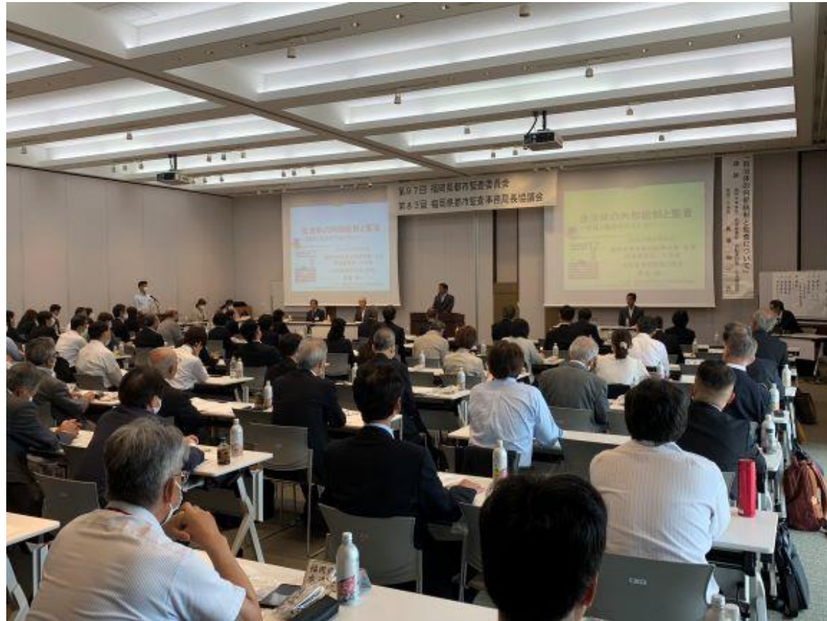
(写真 監査委員会・協議会の様子)

第97回福岡県都市監査委員会と第83回福岡県都市監査事務局長協議会に開催市を代表して出席しました。本会の活動を通して自治体の健全な運営、さらには振興・発展のために研鑽を積まれておられます。今後とも、皆様の活躍をご祈念いたします。