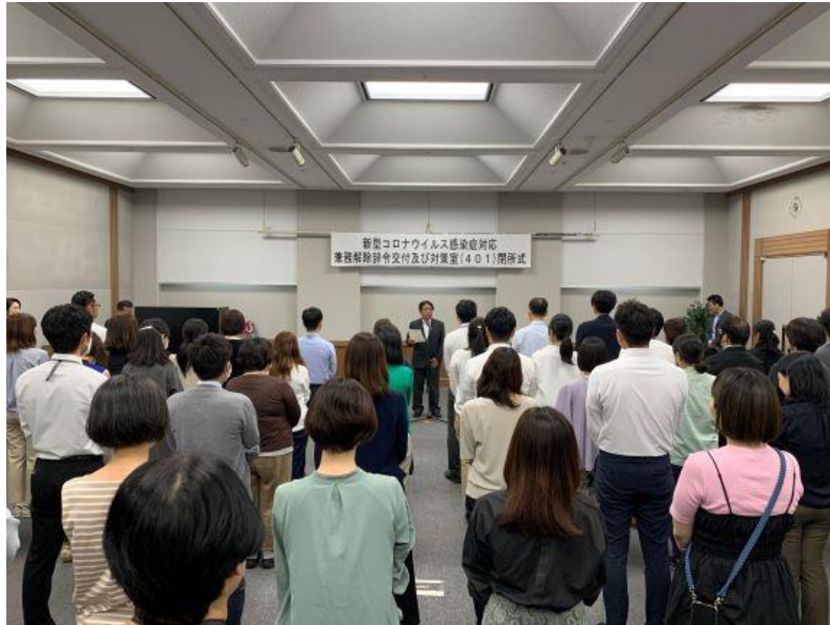
(写真 閉所式の様子)

新型コロナウイルス感染症の5類感染症移行に伴い、コロナ対策を行っていた対策室を閉所しました。対策室では、約3年間にわたり疫学調査やコロナ陽性者への対応を一元的に行ってまいりました。閉所に伴い、新型コロナウイルス感染症対応していた職員の兼務を解除いたしました。