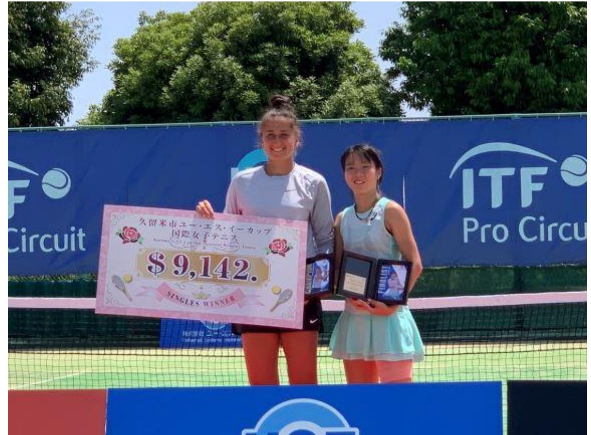
(写真 表彰式の様子)