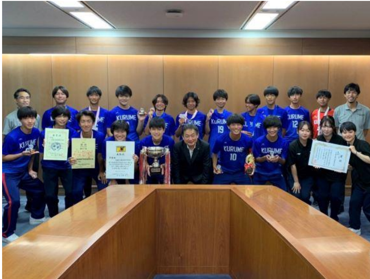
(写真 久留米工業高等専門学校のサッカー部の皆様との記念撮影)

久留米工業高等専門学校のサッカー部の皆様がお越しになり、第57回全国高等専門学校体育大会サッカー競技に九州代表として出場し、準優勝されたことを報告して頂きました。全国の舞台で活躍されたことは、本市のスポーツ振興に大きく寄与するものであります。