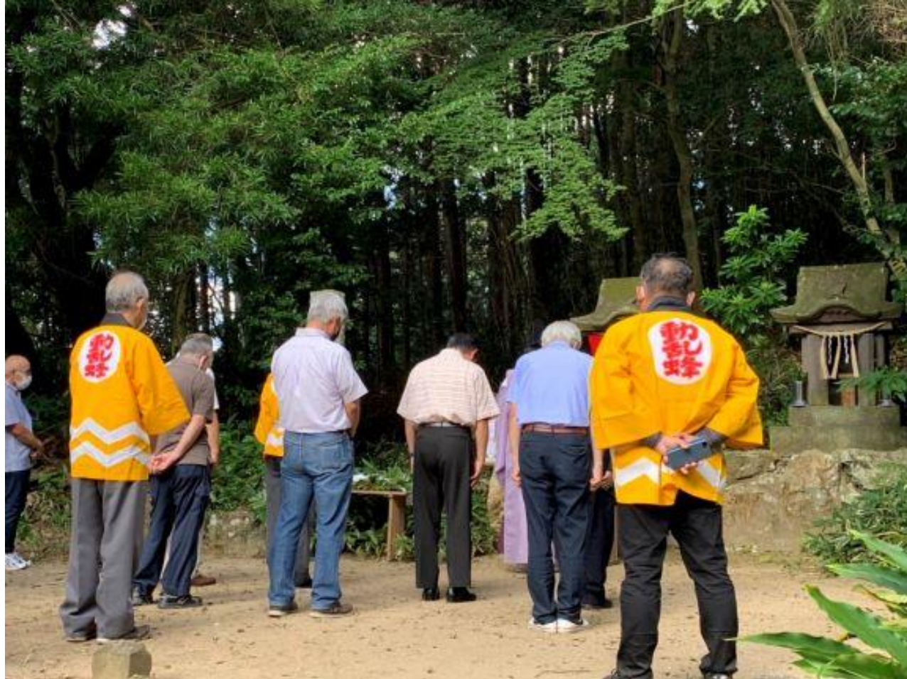
(写真 花火動乱蜂祈願の様子)

江戸時代から伝わる花火動乱蜂は、約360年前の神事が発祥とされ、悪疫退散、五穀豊穰を祈願し、仕掛花火が豪快に打ち上げられます。花火の打ち上げは3年連続中止となっていますが、花火動乱蜂の祈願を行いました。