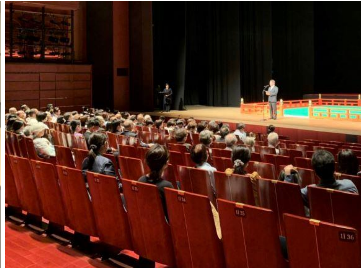
(写真 久留米入城400年を記念した雅楽公演の様子)