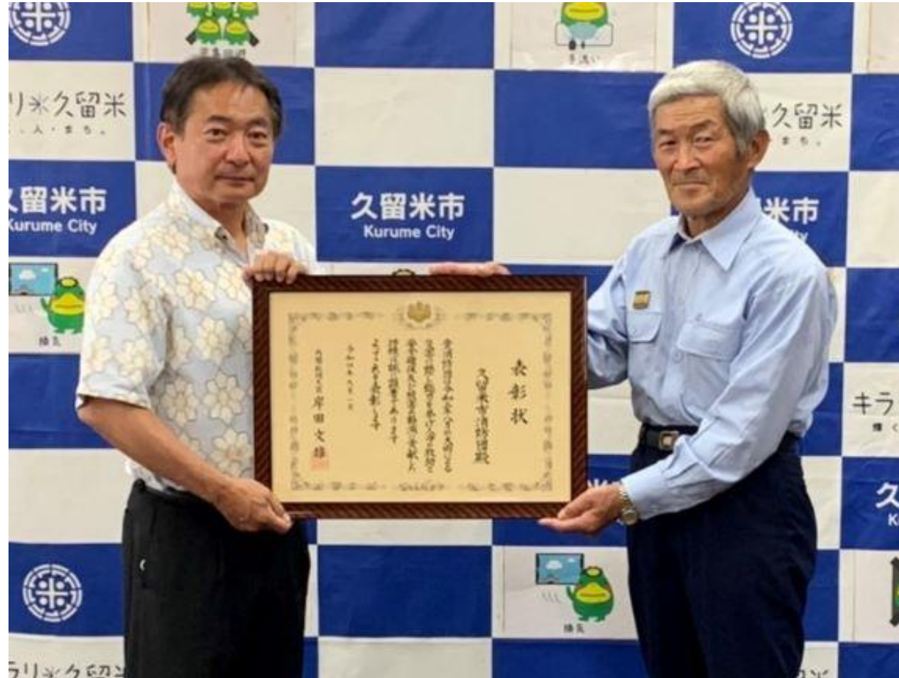
(写真 防災功労者内閣総理大臣表彰受賞報告の様子)

久留米市消防団様が、令和4年度防災功労者内閣総理大臣表彰を受賞されたことの報告でお越しになりました。令和3年8月の豪雨に伴う災害活動の功績が顕著であると認められたものであります。