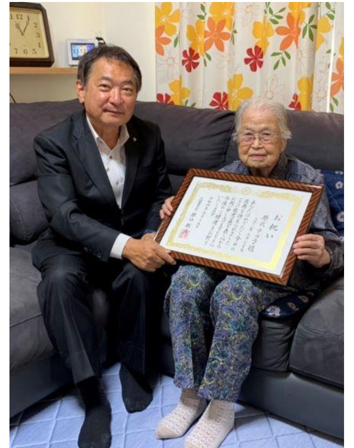
(写真 100歳高齢者のご自宅訪問の様子)