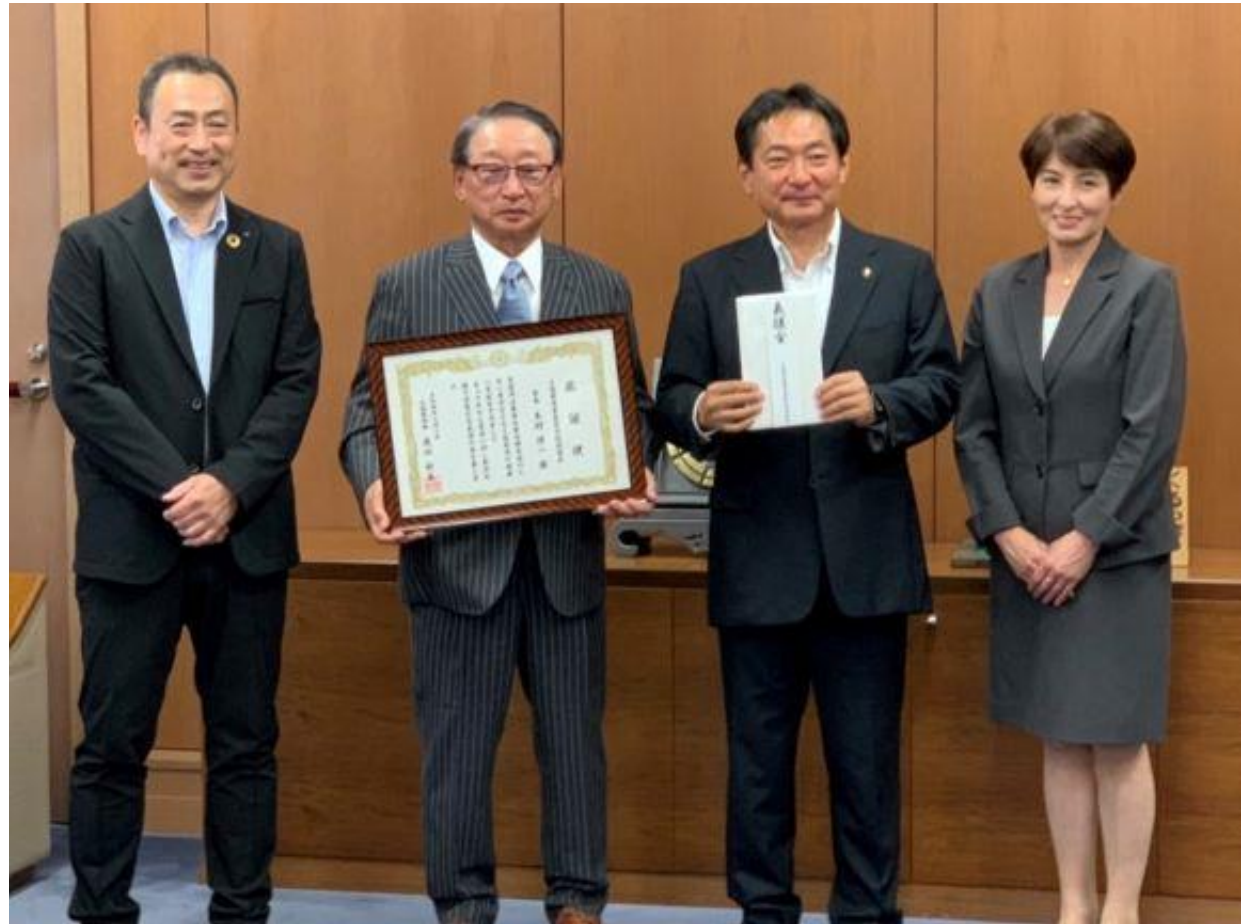
(写真 久留米商業高等学校同窓会様からの寄附金贈呈式の様子)