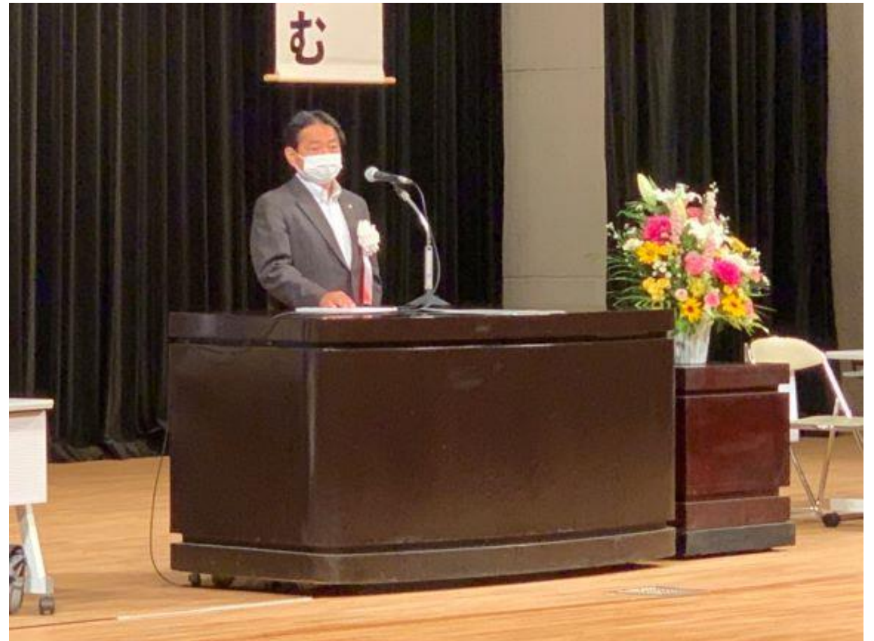
(写真 令和4年度久留米市シルバー人材センター定時総会の様子)