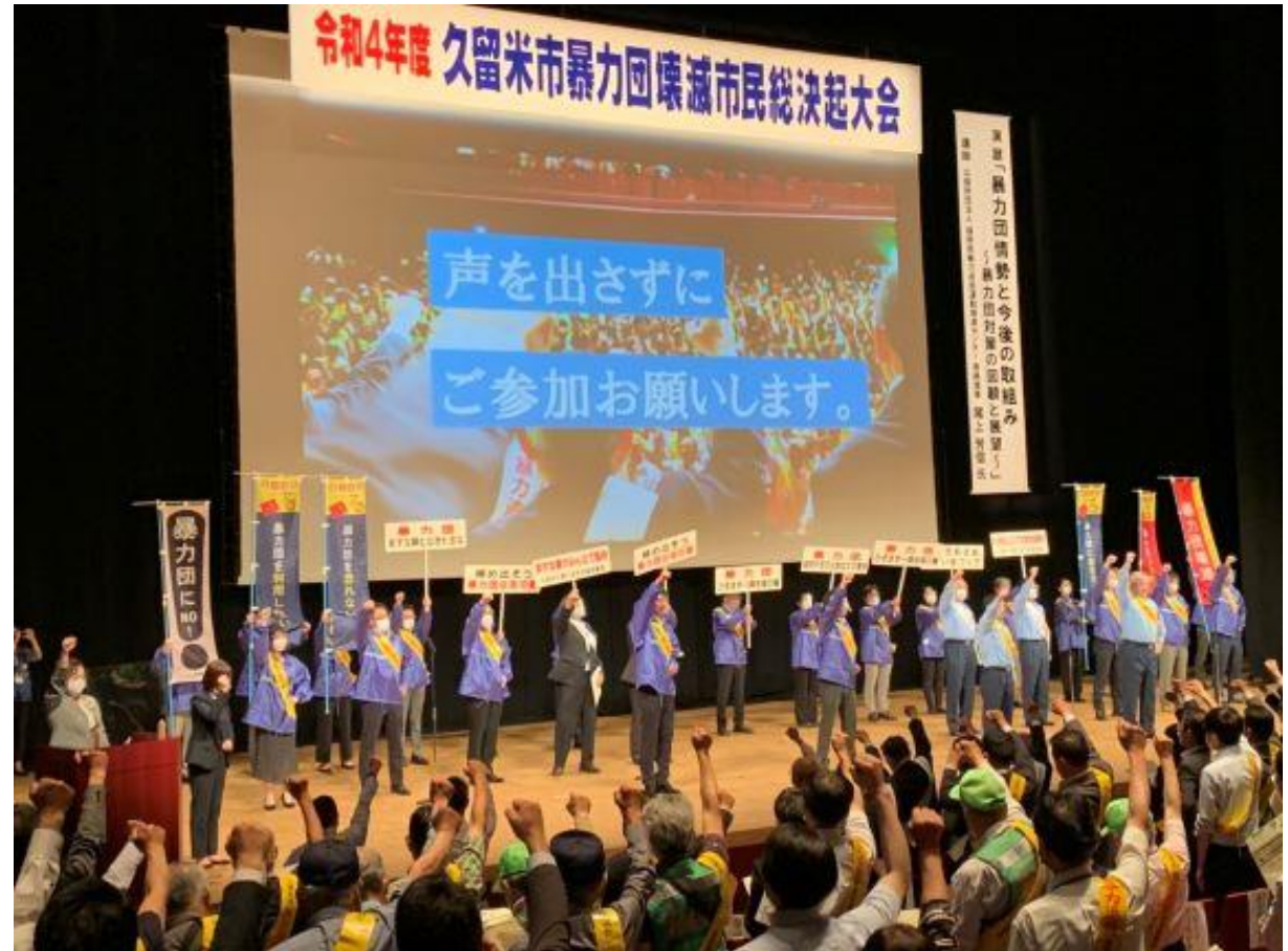
(写真 久留米市暴力団壊滅市民決起大会の様子)