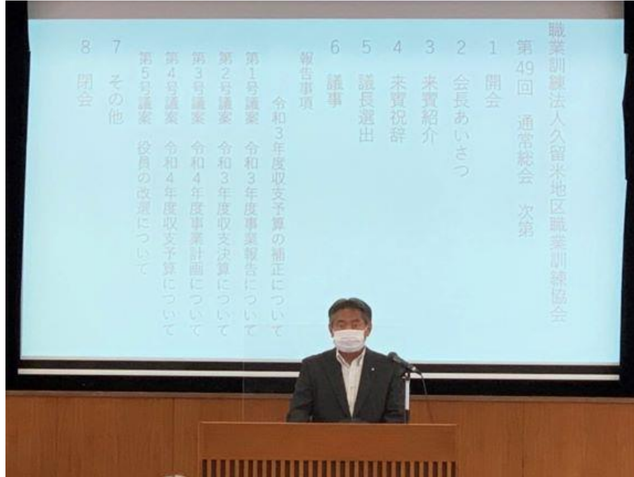
(写真 久留米地区職業訓練協会理事会・総会であいさつする市長)

職業訓練法人久留米地区職業訓練協会様の、令和4年度第1回理事会及び第49回通常総会に出席しました。