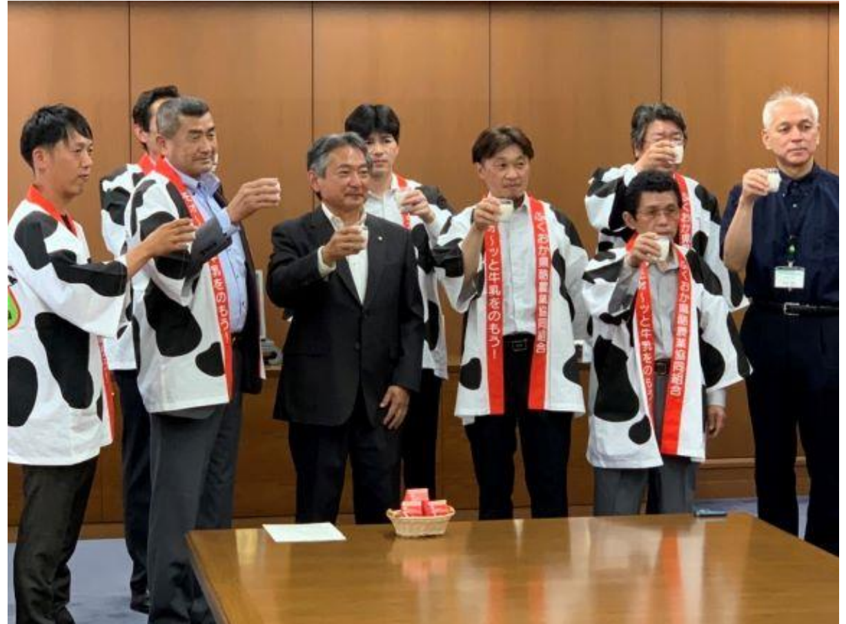
(写真 JAくるめ酪農部会の皆様と市長の写真)