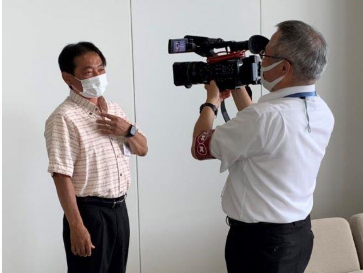
（写真 久留米絣のシャツ姿で取材を受ける市長の様子）

令和4年第3回久留米市議会（定例会）で、出席者全員が地域の特産品である久留米絣製品「絣のシャツ」を着て出席しました。また、このことをNHKに取材していただきました。