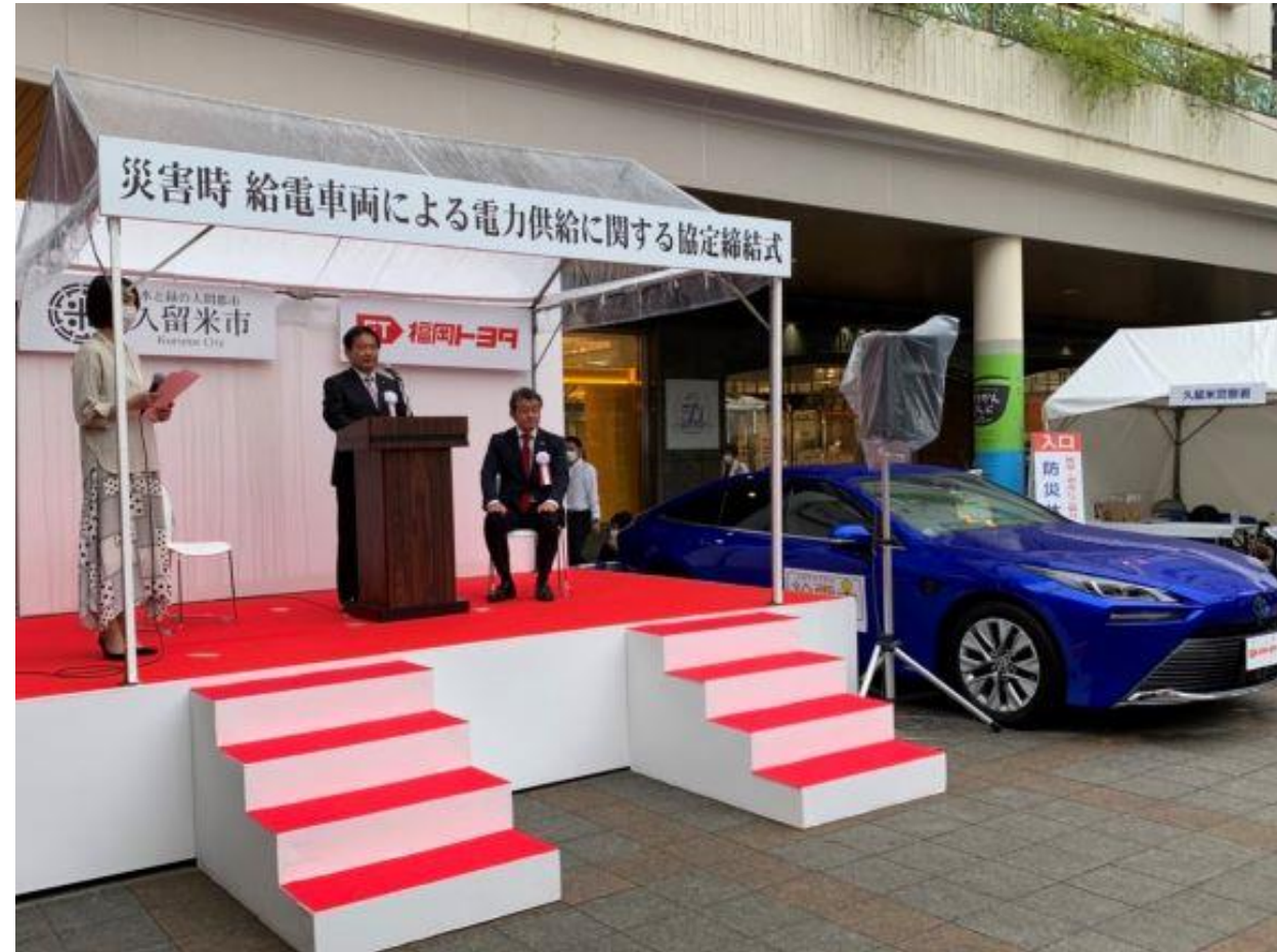
(写真 福岡トヨタ自動車株式会社様との災害連携協定締結式の様子)