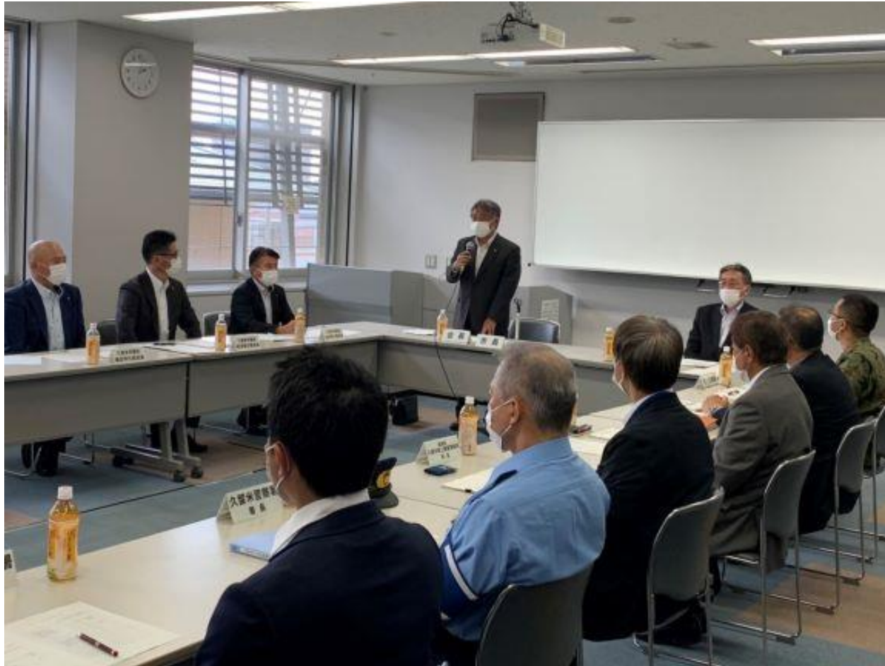
(写真 久留米市水防協議会で挨拶する様子)

久留米市水防協議会を開催しました。水防協議会は、久留米市の水防体制の充実を図るとともに関係機関の連携を深めることを目的として設置した市の附属機関です。