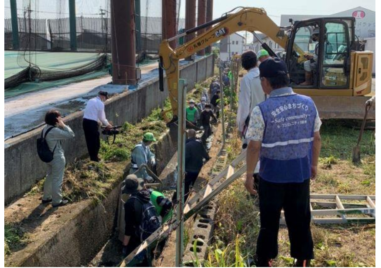
(写真 善導寺しゅんせつボランティアの様子)