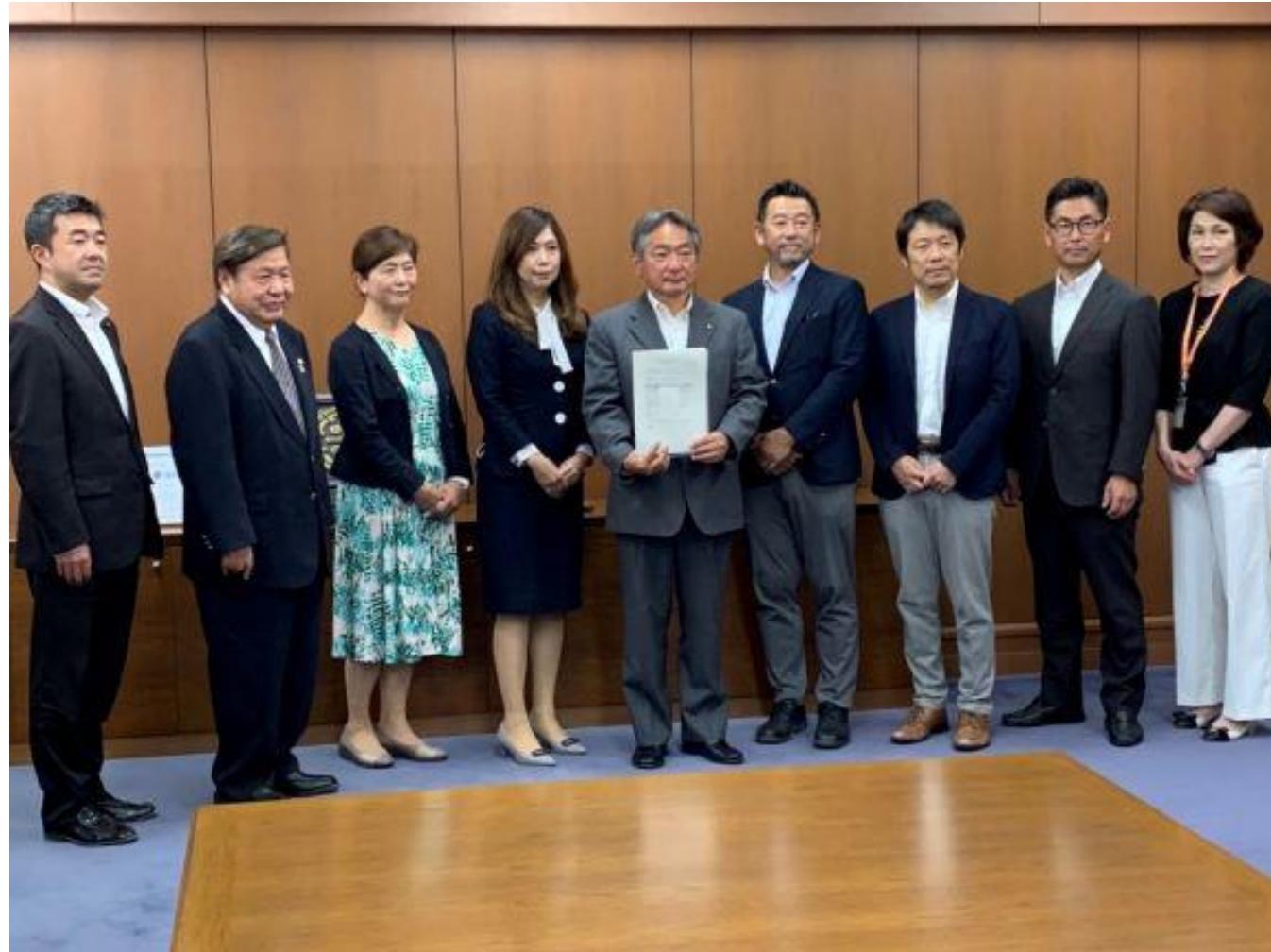
(写真 久留米市私立幼稚園協会の皆様との記念撮影)

久留米市私立幼稚園協会の皆様がお越しになり、市立幼稚園の現状等について報告していただきました。