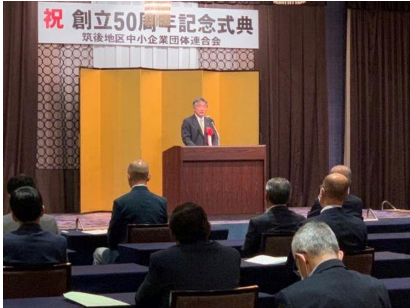
(写真 筑後地区中小企業団体連合会50周年記念式典で挨拶する様子)

筑後地区中小企業団体連合会様の創立50周年記念式典が開催され、来賓として挨拶させていただきました。