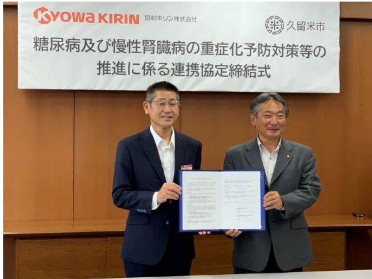
(写真 糖尿病及び慢性腎臓病対策に係る連携協定締結式の様子)

糖尿病や慢性腎臓病に関する正しい知識の普及啓発や発病・重症化の予防を目的として、協和キリン株式会社様と連携協定を締結いたしました。「安全・安心で活力あふれた、誰もが生き生き生活できる、活躍できる共生のまち」の実現に向け、しっかりと取り組んでまいります。