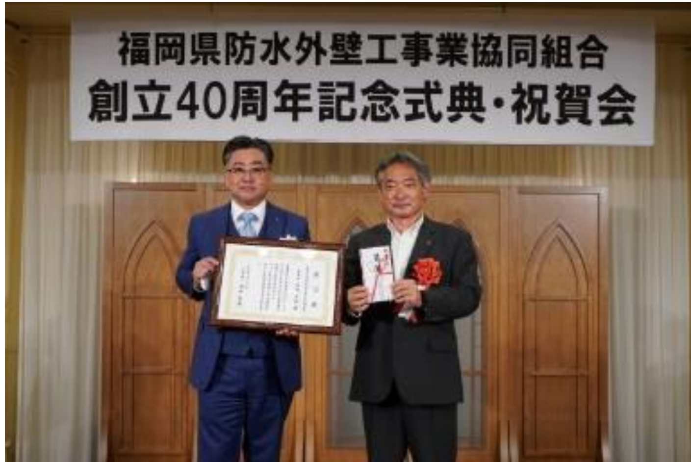
(写真 福岡県防水外壁工事業協同組合様から寄付贈呈の様子)

福岡県防水外壁工事業協同組合様から、同組合創立40周年記念事業の一環として40万円を寄付していただきました。寄付金は、久留米市のまちづくりのために活用させていただきます。