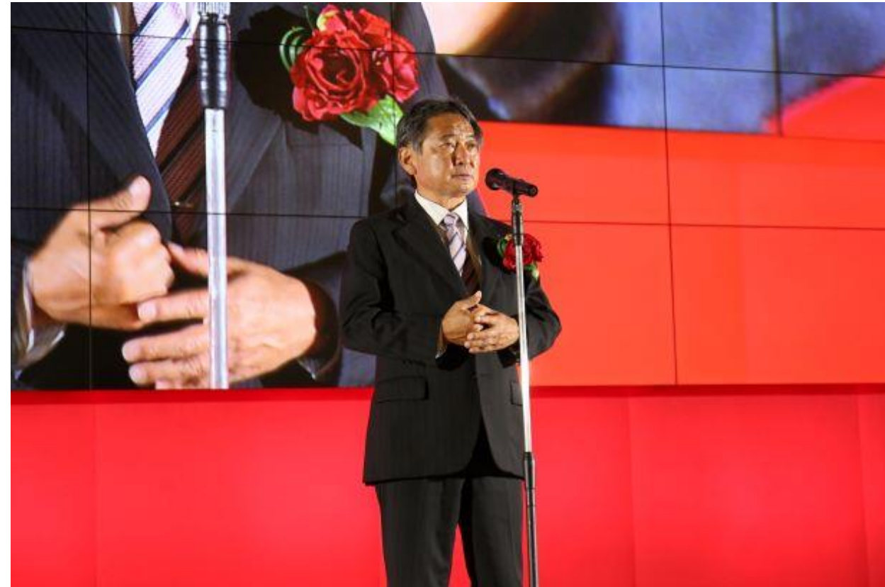
(写真 資生堂久留米工場竣工式の様子)