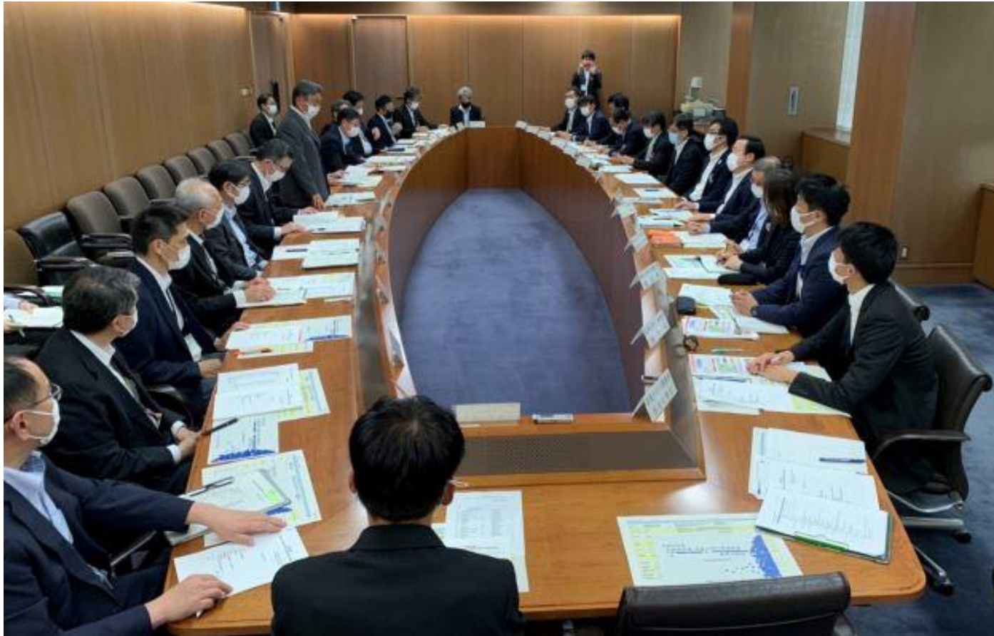
(写真 筑後川河川事務所長との意見交換会の様子)

筑後川河川事務所長を始め、九州地方整備局の皆様との意見交換会を開催いたしました。会では、筑後川本川・支川の整備推進や河川のしゅんせつ、排水ポンプの増強などについて意見交換し、市としての要望も行いました。