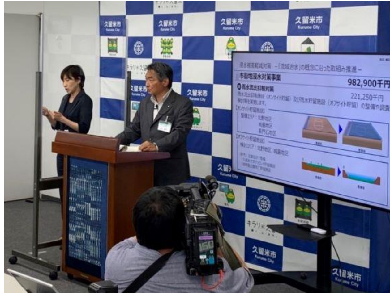
(写真 市長記者会見の様子)

記者会見を開催し、6月議会に提案する議案等について説明しました。また、防災に関し、流域治水推進プロジェクトの進捗状況や防災チャットボットの開始などについて説明いたしました。