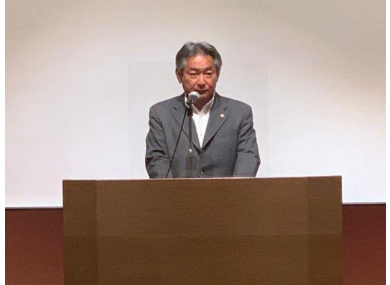
(写真 筑後川流域利水対策協議会総会の様子)