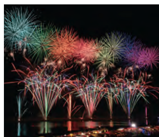
筑後川花火大会 Chikugo River Fireworks Festival