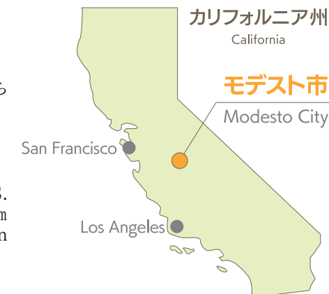
カリフォルニア州 California

Modesto City is the county seat of Stanislaus County, California, the U.S. It is situated 148 km east of San Francisco and approximately 470 km northwest of Los Angeles. The area is approximately 116 km 2 . The population is approximately 223,000.