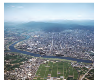
耳納連山と筑後川 Mino Mountain Range and Chikugo River

The city is famous for flowers such as azaleas and camellias, which can be enjoyed in all seasons. In addition, a variety of festivals and events are held here, such as the Kurume Azalea March in spring, the Kurume Water Festival and the Chikugo River Fireworks Festival in summer, the Agricultural Festival in fall, and the Sake Brewery Opening in winter. Popular gourmet foods such as tonkotsu ramen and yakitori also attract tourists.