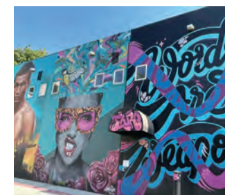
壁画アート Mural Art