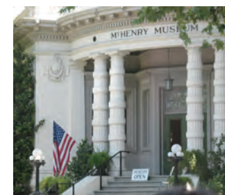
マクヘンリー・ミュージアム McHenry Museum