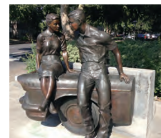
ルーカスプラザ Lucas Plaza