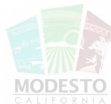
モデスト市長 スー・ズワレン

The international situation is becoming more complex due to frequent wars and conflicts. In times like these, I realize that citizen-led international exchanges are even more necessary. I hope that the circle of friendship between the two cities will continue to expand through international exchange programs that take advantage of our sister city relationship.