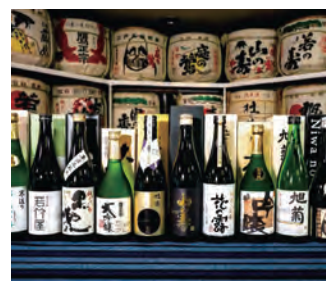
久留米市の日本酒 Sake in Kurume