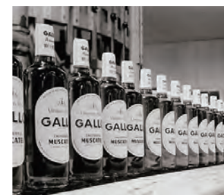
ガロワイン Gallo Wine