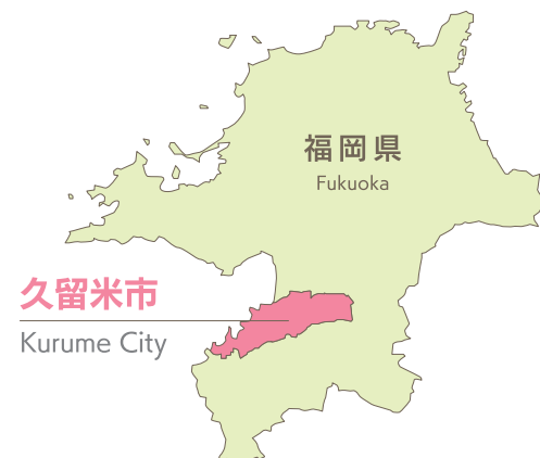
久留米市 Kurume City

Kurume City is located in the northern part of Kyushu and in the southwestern part of Fukuoka Prefecture. It is situated approximately 40 km south of Fukuoka City. The city area is 32.27 km from east to west, 15.99 km from north to south, and has an area of 229.96km 2 . The population is approximately 302,000.