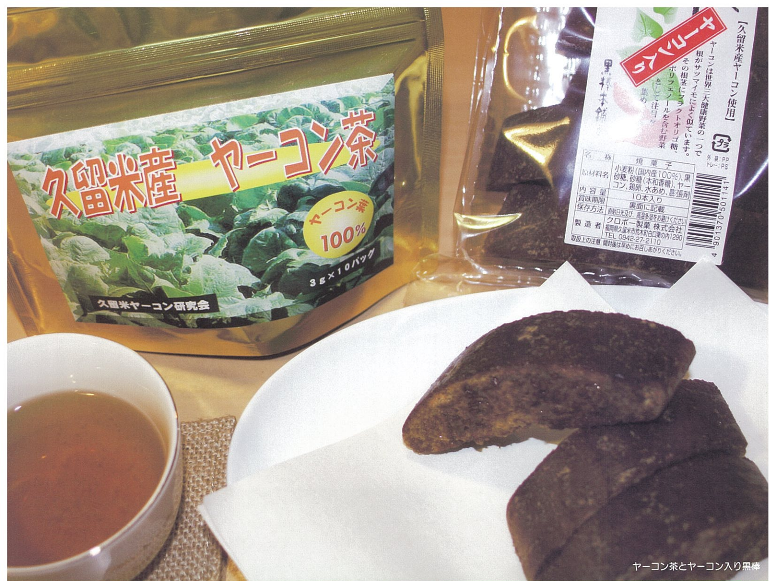
ヤーコン茶とヤーコン入り黒棒