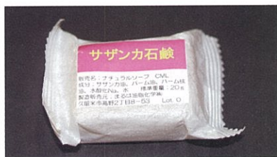
(上) 長岩山のサザンカ群生林 (下) サザンカ油から試作した洗顔石鹸