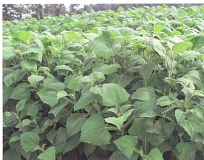
ヤーコン畑。葉は深い緑色をしており、ヤーコン茶の原料となります。

その成果として、平成20年度に販売を開始したのが、ヤーコンを加工したお茶とお菓子です。