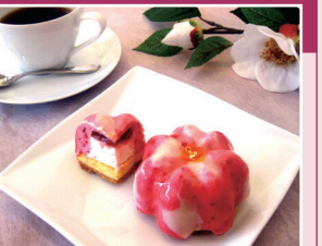
つばきケーキ「正義」

カフェ つばきメニュー(春の花御膳、つばきケーキなど) ギャラリーショップ つばきグッズ販売 期間 3月2日 土 ~4月7日 日 ※月曜休み 営業時間 各日10:00~17:00 ランチタイム/11:00~14:30 カフェオーダーストップ/16:30