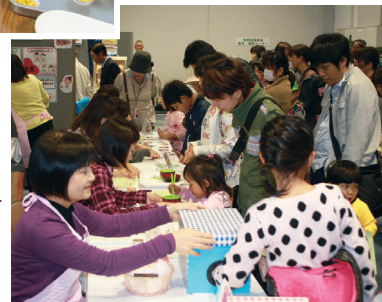
くるめ食育フェスタの展示・相談コーナー▶