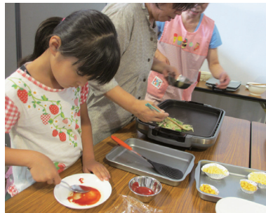
◀くるめ食育フェスタの体験イベント

市民全体を対象に、イベントの開催や広報誌等を使った情報発信などを行い、食育への理解と関心を高めます。