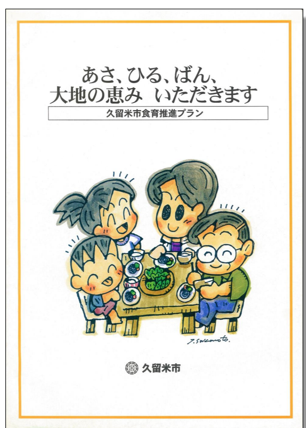
第1次食育プラン (平成19年6月～平成22年度)

今後も、市民一人ひとりが食育基本法にある基本理念を再認識し、自ら食育を実践するまちを目指します。