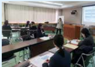
女性リーダー養成講座