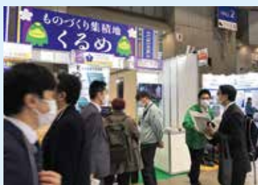
見本市の会場(一例)