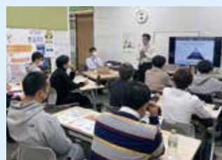
若者創業セミナー