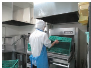
職場訪問し、仕事の作業手順の確認なども行います

社会の一員として活動し、自立してもらうことが目標です。生きがいややりがいからコミュニティが広がり、新しい出会いに繋がれば良いと思います。