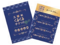
久留米くるくるチケット (4枚つづり 2,000円)

水郷柳川川下り ③ →杜の離れ(飲み比べ ① )→西鉄観光案内所(ダルムチップス ① )→ロヂウラ酒八利(立ち飲み ① )→串焼ほたる川(焼きとり ① )→清陽軒文化街店(ラーメン ① )