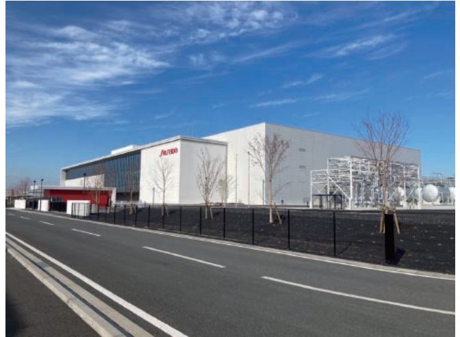
建築工事が完了した株式会社資生堂福岡久留米工場

同団地には、愛媛県八幡浜市の和洋生菓子メーカー株式会社あわしま堂の立地も決定。残る2区画（久留米市域）も分譲が決定しており、本市への企業集積が進んでいます。