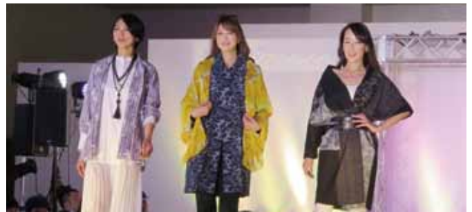
ポップな色合いの製品も楽しめます