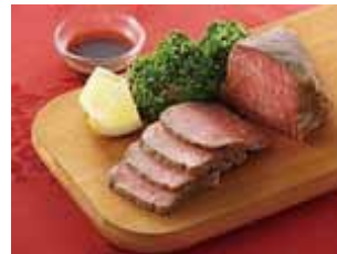
久留米産の「博多和牛」を使って作られたローストビーフ