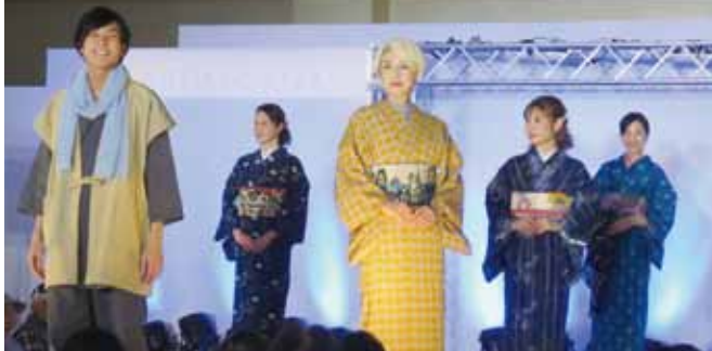
あてやかな和装のファッションショーの様子

職人たちの「丹念な手仕事」、自然素材「木綿の持つ風合い」、素朴な中にも「精巧な美しさ」があり、200年を超える技術の集積。それが伝統的工芸品「久留米絣」です。