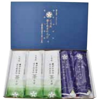
耕作放棄地を再生して生産したそばから製品化した「くるめほとめきのそば」