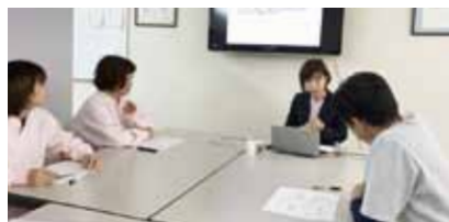
働き方の見直しのため実施した研修の様子

当社は、パートタイムで働く人が多く、扶養の範囲内で働きたい希望者のために労働時間の調整が必要で、年末になるとシフトの調整に苦労していました。そのため、社員の皆さんに社会保険などの制度について説明することで、改めて自身の働き方を考えてもらいたいと思ったことが、研修を実施したきっかけです。