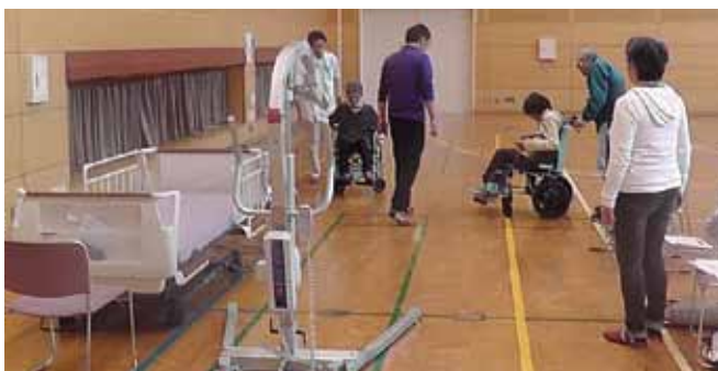
家族介護教室でさまざまな福祉用具を体験する参加者

仕事と介護の両立のために、社内制度の整備とあわせて、いつか訪れるかもしれない介護についての理解を深めましょう。