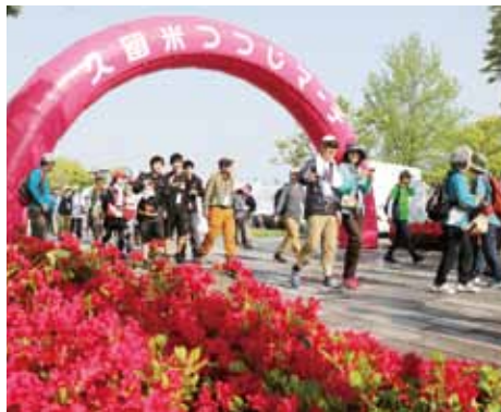
色鮮やかなつつじを見ながらウォーク(昨年の様子)