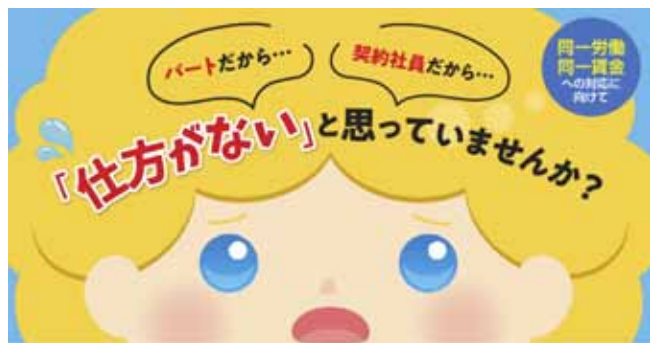
パートタイム・有期雇用労働法キャラクター「パゆう」ちゃん