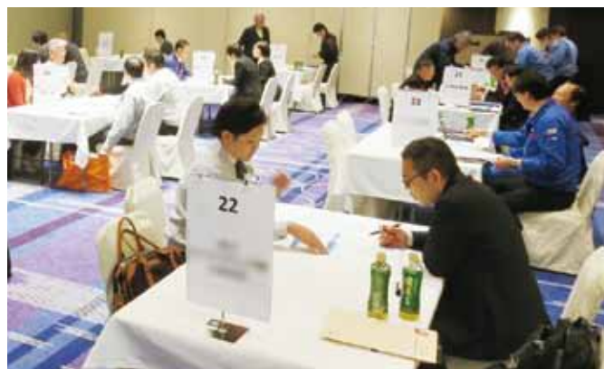
昨年の商談会場の様子