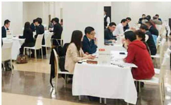
昨年の観光商談会の様子

この観光商談会は、国内外の旅行社(バイヤー)を久留米に招き、参加者(セラー)が観光資源を売り込むスタイルのBtoB商談会です。