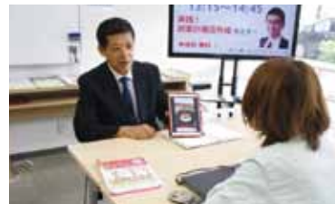
コーディネーターに 宣伝方法について相談中