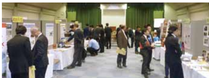
研究開発支援成果や中小企業支援に関する展示も行います

今回のテクノ交流会では、独自の技術、開発思想、イメージ戦略など自社の企業「らしさ」を生み出している特色ある企業の取り組みを紹介し、地域の中小企業が今後の企業活動のヒントを得る機会として開催します。