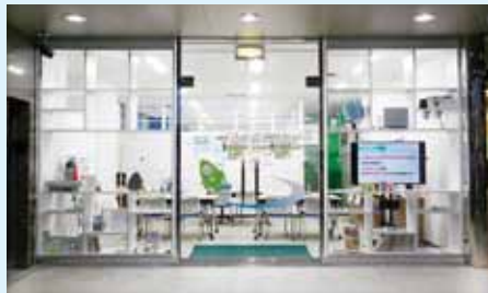
くるめ創業ロケットの外観