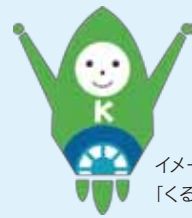
イメージキャラクター「くるめ」

市は、創業支援の拠点として平成28年4月に「くるめ創業ロケット」を開設しました。創業を考えている人だけでなく、すでに事業を行っている人も利用できます。商工団体や教育研究機関、金融機関など、産学官金の団体からなる「くるめ創業支援ネットワーク」や、中小企業庁が設置する「よろず支援拠点」と連携し、みなさまの創業・経営をサポートしています。