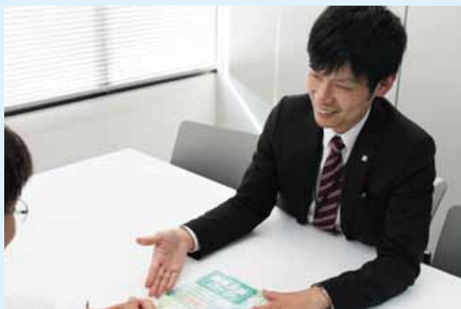
相談員が真摯に対応します