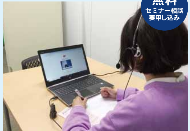
利用者がくるめ創業ロケットのテレビ電話で専門家に相談している様子

テレビ電話を通して福岡県よろず支援拠点(博多本部)にいる専門家への相談ができます。