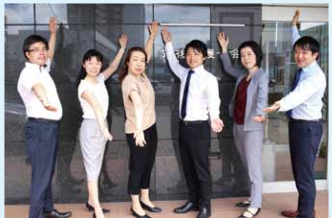
中小企業の支援に詳しい弁護士が全力サポート