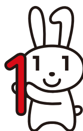
マイナンバー制度ロゴマーク 「マイナちゃん」

申込条件 交付申請希望者が10人以上であること その他の詳しい条件については、お問い合わせください。