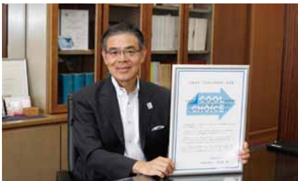
市民や事業所の皆さんに、取り組みを呼びかけるため「COOL CHOICE宣言」をした大久保市長

問 環境政策課 ☎0942-30-9146 📠0942-30-9715 ✉kansei@city.kurume.fukuoka.jp