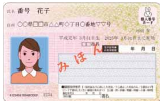
今後さまざまな生活シーンで使われるようになるマイナンバーカード(見本)

市は、マイナンバーカードの企業一括申請を受け付けています。申請から受け取りまで企業の事務所内で手続きをすることができます。