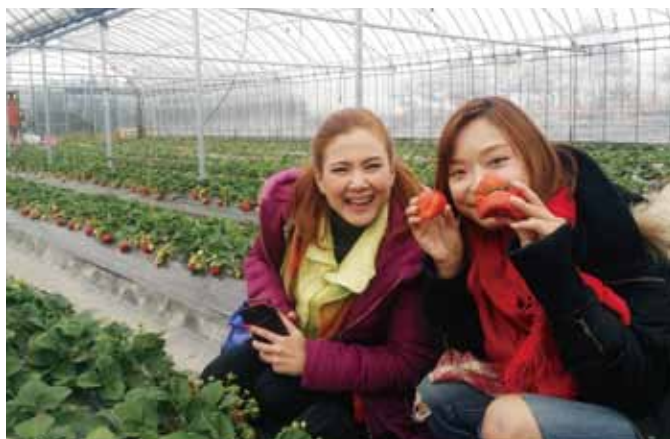
フルーツ狩りで久留米を訪れる外国人も増えています