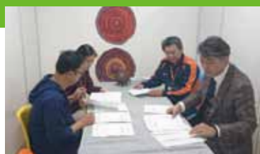
就業規則の見直し内容を周知する社内研修の様子

子育てや介護のために時間的に制約がある従業員がおり、柔軟に働くことができる在宅勤務の導入をしたと考えていました。