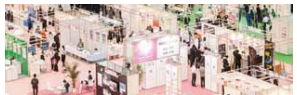
自社の製品や技術を展示する見本市の会場(一例)

※国内出展の場合は、出展小間数100以上または出展予定企業が100社以上の規模で沖縄を除く九州以外の地域で開催されるもの