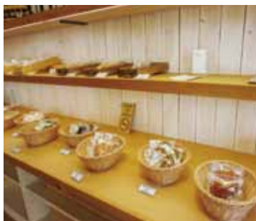
店内には、新鮮なフルーツを使ったケーキやこだわりの焼き菓子が並び

独立開業を目標に、レストラン、ホテル、ブライダルでさまざまな経験を積んできました。自分がおいしいと思うケーキをお客さまに喜んで食べてもらいたいと思っており、良い物件が見つかったことをきっかけに開業を決めました。