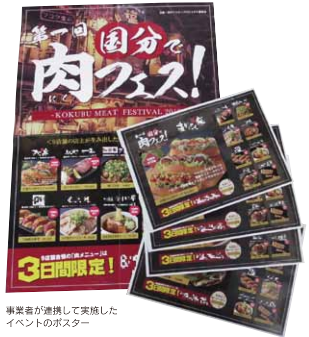
事業者が連携して実施したイベントのポスター