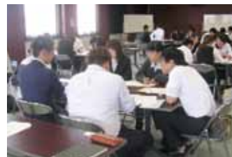
グループワークを通じて、仕事のスキルアップを図ります

久留米市雇用・就労推進協議会は、合同研修を通じて仕事のスキルアップを図るとともに、他社の社員との交流により社外のつながりをつくるために、市内事業所の新入社員や採用2年目社員を対象に、合同研修会を実施します。