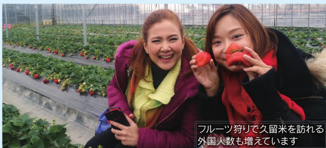
フルーツ狩りで久留米を訪れる 外国人人数も増えています

市では外国人旅行者受け入れのために、事業者が自主的に行う環境整備のための費用の一部を補助しています。外国人旅行者の消費拡大やリピート化などインバウンドビジネスの拡大にぜひご活用ください。