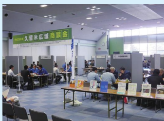
産学官連携による広域商談会