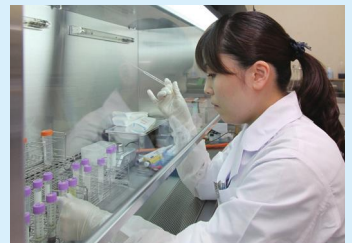
バイオベンチャーによる研究