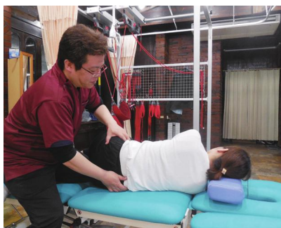
骨盤矯正で体のゆがみを調整

開業前は理学療法士として病院に勤務していましたが、管理職として病院経営全般に携わるようになり、患者さんに接する機会が少なくなっていました。直接患者さんに触れ、治していくことが好きだったため、10年ほど前から独立を考えていましたが、人材育成に時間がかかり、昨年ようやく開業することができました。