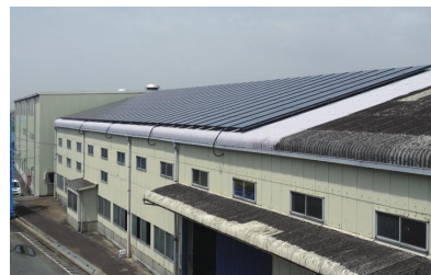
太陽光パネル(約40kw)を設置し、再生可能エネルギーを活用

コスト削減は永遠の課題です。費用対効果を充分検討し、長期的な視点で投資を行う必要があります。今回のノウハウを生かし、環境に配慮する視点も踏まえながら、全社での取り組みを推進していきたいと考えています。