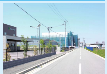
立地率100%となった藤光産業団地