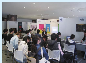
市内企業のインターンシップ企業説明会