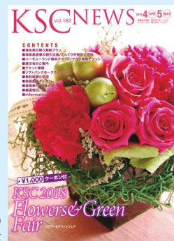
KSCが行う 福利厚生サービスの 情報発信