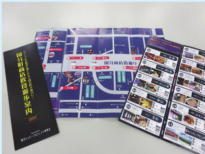
事業者が連携して作成した商店街マップ