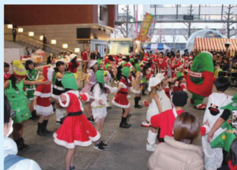
冬のにぎわい創出 (昨年のまちなかクリスマスの様子)