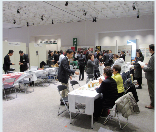
自慢の商品をバイヤーにPRします