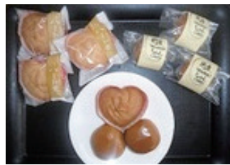
ハトムギを使って開発した商品