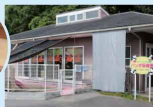
院内保育所「バンダ保育園」