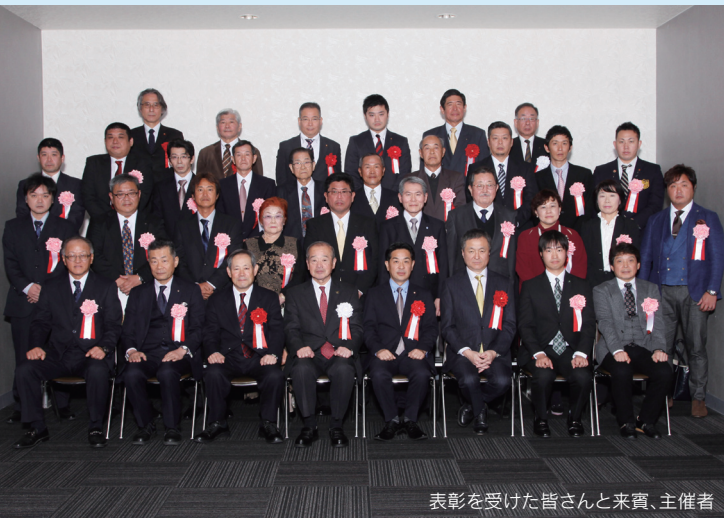
表彰を受けた皆さんと来賓、主催者