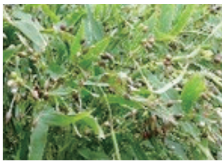
三潯地域の特産であるハトムギ

※久留米市農商工連携会議…久留米市及び市内の4商工団体、5農業協同組合で構成する組織