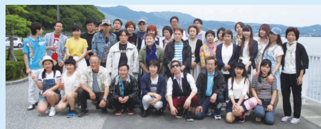
温泉旅行で親睦を深めます