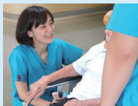
院内保育所があるので、安心して仕事に取り組みます