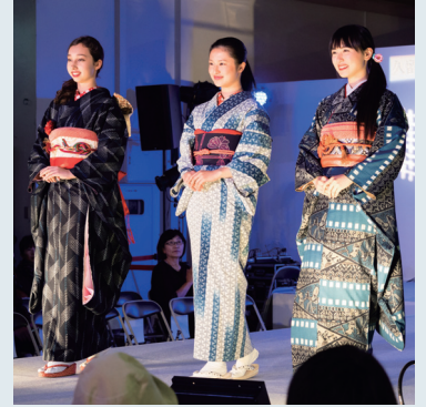
艶やかな和装のファッションショー