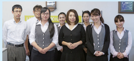
日頃から互いにサポートし合えるよう意識しています