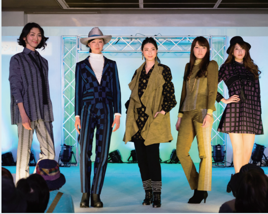
笑顔あふれるファッションショーの様子

夏は涼しく、冬は暖かい。使うほどに肌に馴染み、着心地が良くなる。柄の細かな「かすれ」と「にじみ」が味わい深い素朴で温かみのある久留米絣。ずっと残していきたい伝統工芸品です。