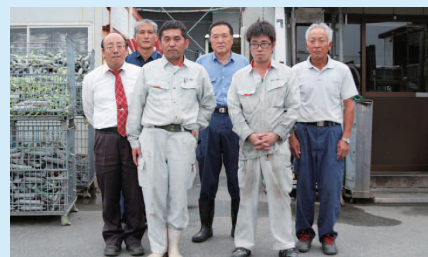
コミュニケーションを取ることを大切にしています