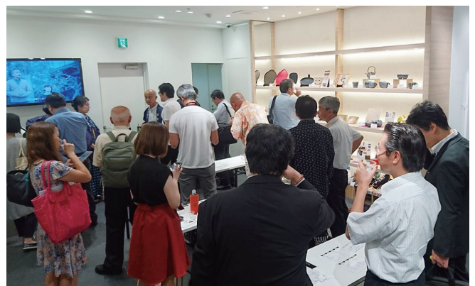
イベント例 9月8日に開催された筑後のSAKEフェア

申込みの際は、右記問い合わせ先にメールまたは電話で空き状況等を確認ください。なお、申込み期間は、6ヶ月前から2ヶ月前までです。