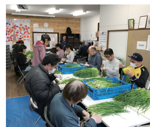
農業・ITを中心に就労の機会を提供しています

就労継続支援A型といっても、事業所により特長は様々です。近々、パソコン作業をメインとした事業所のオープンも考えています。時代の流れを読んで、それに合わせ、自分が正しいと思う経営を行っていきたくです。