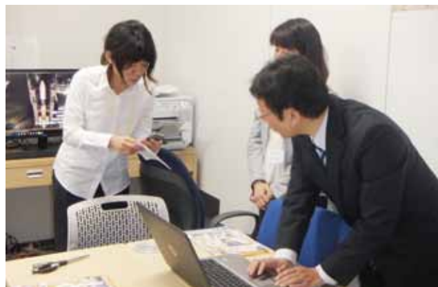
交流スペースは様々なスタイルで利用できます

URL http://www.kurumebp.jp/rocket または https://www.facebook.com/kurume.rocket/