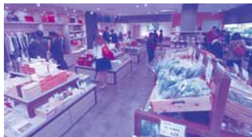
「くるめヨカモン屋 店内の様子」