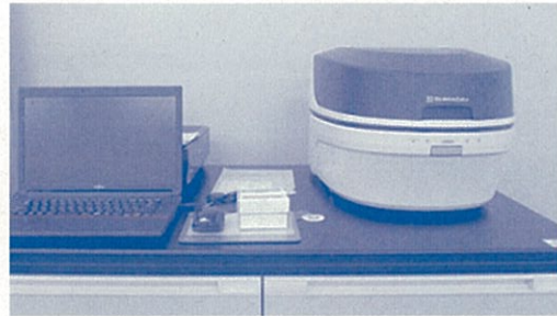
混入元素分析など幅広い分野での利用が可能です

さまざまな分析・研究・評価に利用できますので、お気軽にご相談ください。詳しくは㈱久留米リサーチ・パークのホームページをご覧ください。