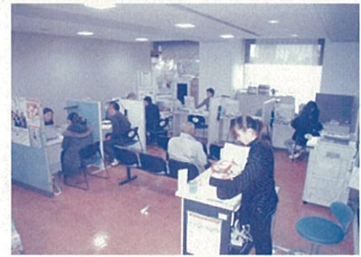
相談しやすい雰囲気のジョブプラザ

プラザ内には、求人検索機が5台設置されており、全国の求人情報をご覧になれます。また、通常のハローワーク（国）と就労サポーター（市）のサービスに加え、年齢層別や女性就職支援の専門相談（県）も行っています。