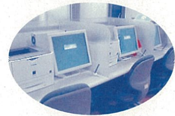
ハローワークの求人検索機を設置しています