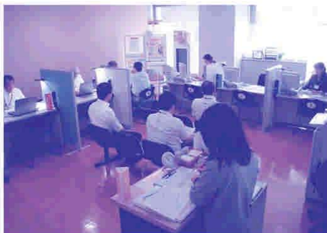
久留米市求職者総合支援センター(久留米市庁舎2階)