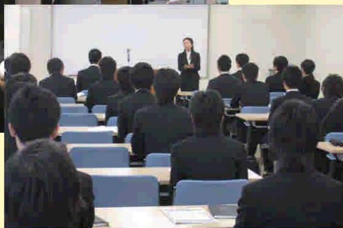
4・6月に開催された市合同会社説明会と セミナーの様子