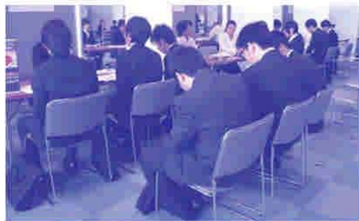
6月9日 合同会社説明会の様子

問い合わせ先 久留米市合同会社説明会事務局(事業受託会社:株式会社クローバーサポート) TEL 0942-30-0905 FAX 0942-30-9681 ホームページ http://cloversupport.co.jp