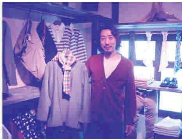
お気に入りのシャツと一緒に

紹介したお店 Common room 久留米市六ツ門町13-20K8ビル3F TEL 0942-27-8334