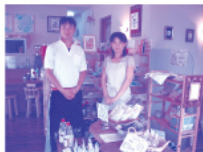
こだわりの食材と一緒に

紹介したお店 ▶ 玄米カフェ 穂々恵み 久留米東郷原町609-1 TEL:0942-37-2404