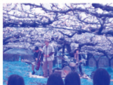
梨山コンサートの様子

当日は1,880人の来場者で賑わい、梨山コンサートで流れてくる音楽をBGMに、梨の花を觀賞しながら地元農産物を使った弁当等を食べたり、梨の花の受粉体験や梨を使った料理教室、牛の乳しぼり体験、野草摘み体験の他、梨の予約販売や地元農産物の販売も行われ、楽しい一時を過ごされていました。