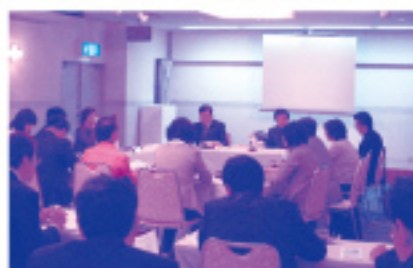
市長報告会の様子

久留米の地域資源や個性を活かし、独創的でチャレンジ精神あふれた活力ある地域社会を構築するため、農業・工業・商業・観光などの各分野の連携強化を図り、本市産業の活性化を進めることを目的として設置されました。各分野から選出された15名の委員で構成され、「農」・「かすり」・「専門マップ」の3つのグループに分かれて活動して頂いています。