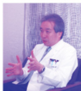
教授 内村 直尚氏

★申し込み・問い合わせ先 久留米市保健所保健予防課 TEL0942-30-9728 FAX0942-30-9833