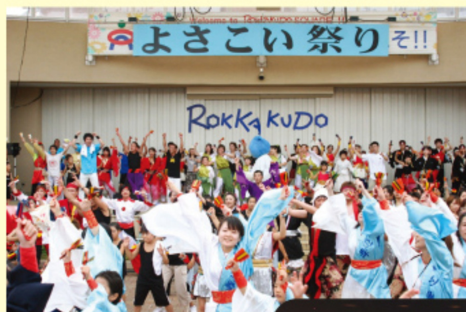
▲くるめほとめき祭り