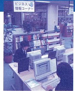
ビジネス情報コーナーの様子

問い合わせ先 中央図書館 〒839-0862久留米市野中町970-1 TEL0942-38-7116 FAX0942-38-7183