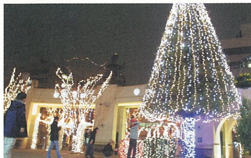
▲ 久留米六角堂広場

冬の中心市街地を元気にしようと11月3日から、くるめ光の祭典「ほとめきファンタジー」が始まりました。3年目を迎えた今回の特徴は、明治通りの灯りを文化街近くのえびす橋まで延長したこと、基本色を温かいオレンジ色にしたこと、東町公園などにオブジェを新設したことなどです。また、西鉄久留米駅東口・六角堂広場にも輝くたくさんのオブジェやツリーなどを設置しています。この「ほとめきファンタジー」に合わせて、中心商店街や池町川沿道などでも、季節を彩る様々なイルミネーションが飾られています。