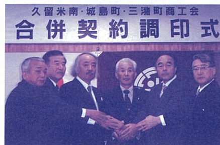
久留米南・城島町・三潯町商工会の合併契約調印式

合併契約を締結した久留米南・城島町・三潯町の3商工会は、平成20年4月に「久留米南部商工会」として発足することとなり、また、基本協定を締結した北野町・田主丸町・東久留米の3商工会は、平成21年4月合併に向け、引き続き協議を進めていくこととなります。