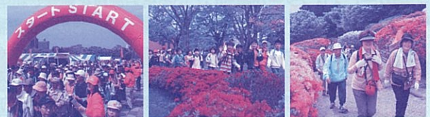
第10回久留米つつじマーチの様子

[申し込み先] 久留米つつじマーチ実行委員会事務局 (財)久留米観光コンベンション国際交流協会内 〒830-0022福岡県久留米市城南町16-1 TEL0942-31-1777 FAX0942-31-3210 申し込み用紙は事務局で配布しております。(郵送可能) まずは、事務局までお問い合わせ下さい。