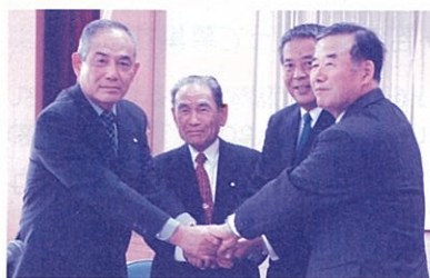
北野町・田主丸町・東久留米商工会の合併基本協定締結式