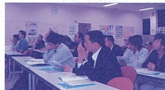
久留米エンジン工場の説明を受ける参加者

ご参加いただいた皆様の感想として、「工程・管理等が勉強になった」「体制の整備等を自社に活かしたい」といった声が上がっていました。