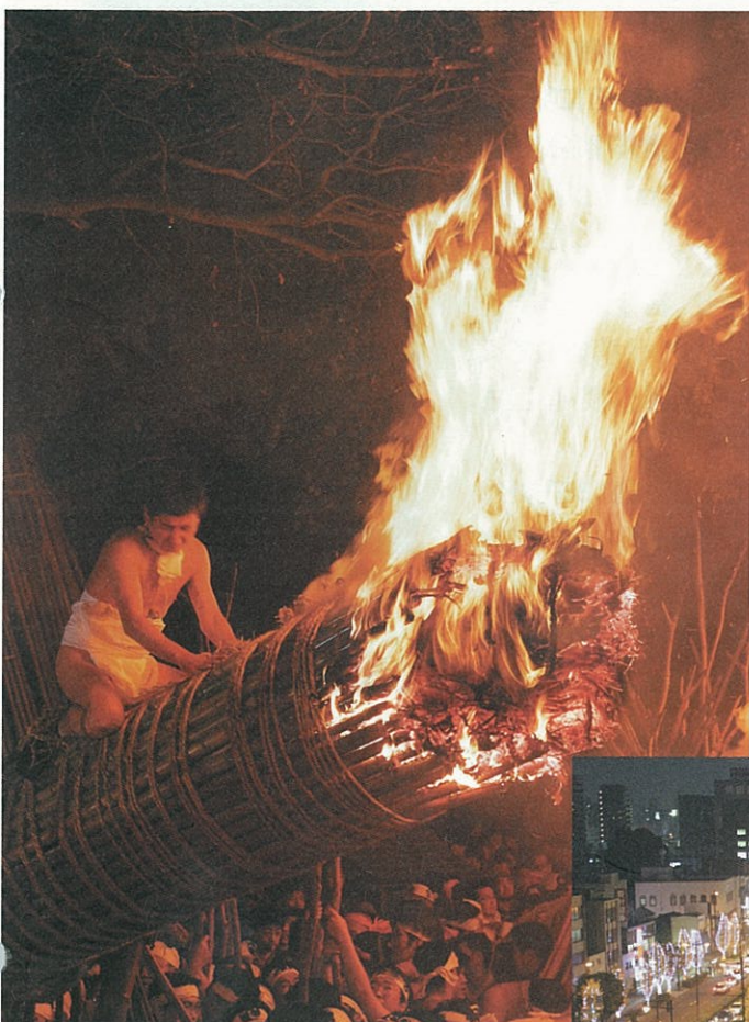
▲ 鬼夜(大善寺玉垂宮・平成18年の様子)