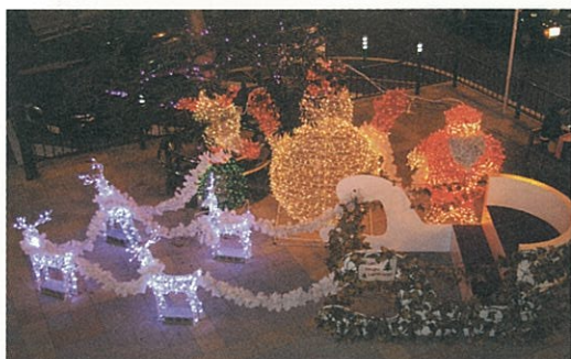
▲ 西鉄久留米駅東口