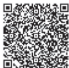
介護休業制度 特設サイト