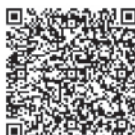
こころの健康相談