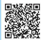
久留米ビジネスプラザ

※よろず支援拠点による相談窓口・セミナーに関するお問い合わせは、☎092-622-7809まで。